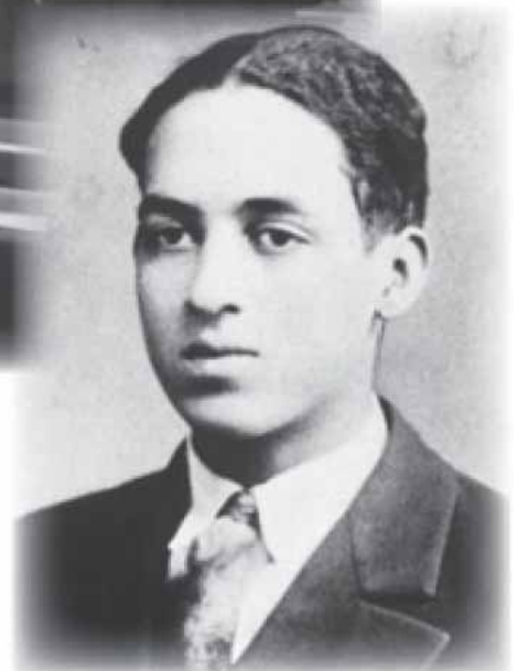
Esta foto de Thurgood Marshall no ensino médio foi tirada por volta de 1921-25