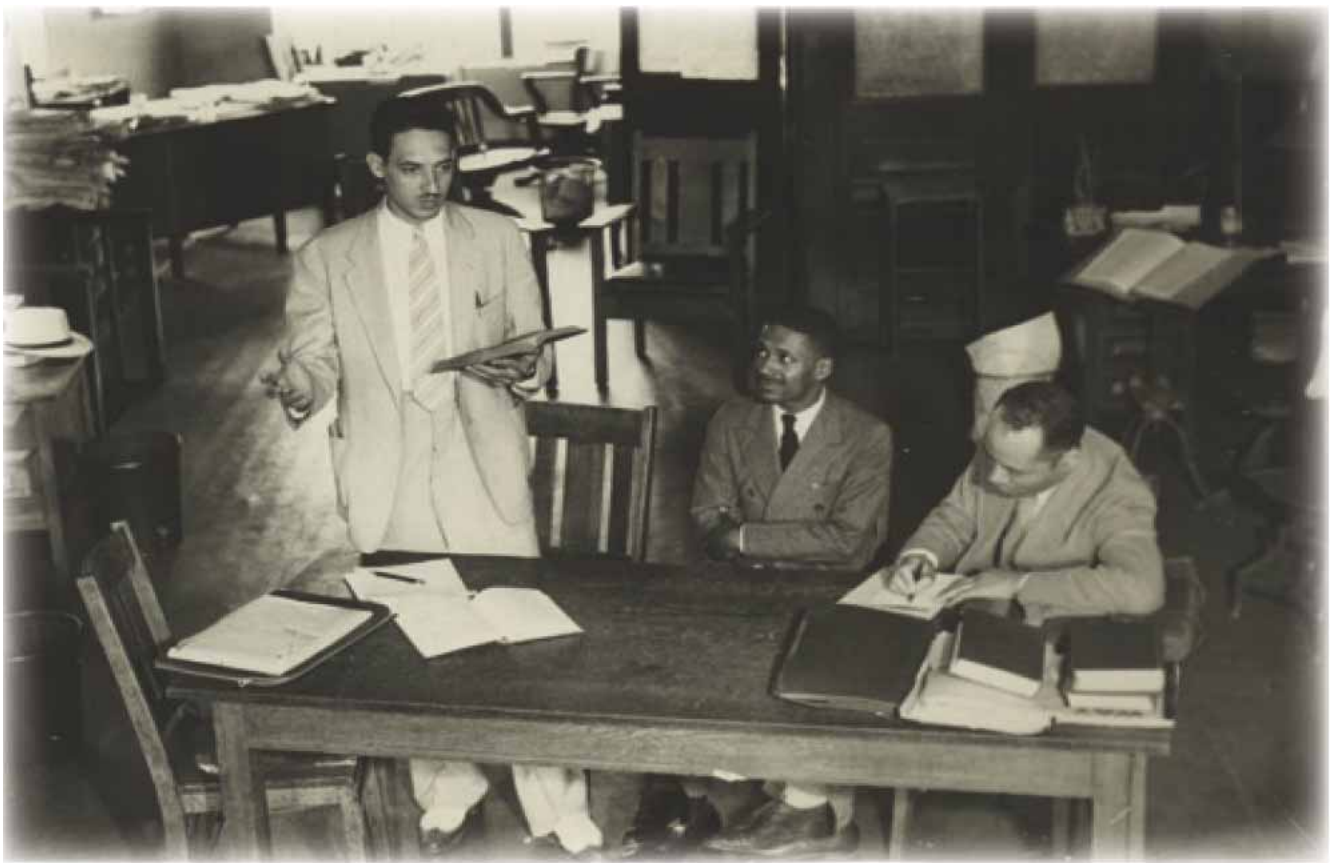
O jovem Thurgood Marshall, de pé; Donald Gaines Murray, ao centro; e Charles Houston, à direita, preparam um processo de dessegregação contra a Universidade de Maryland, em 1935