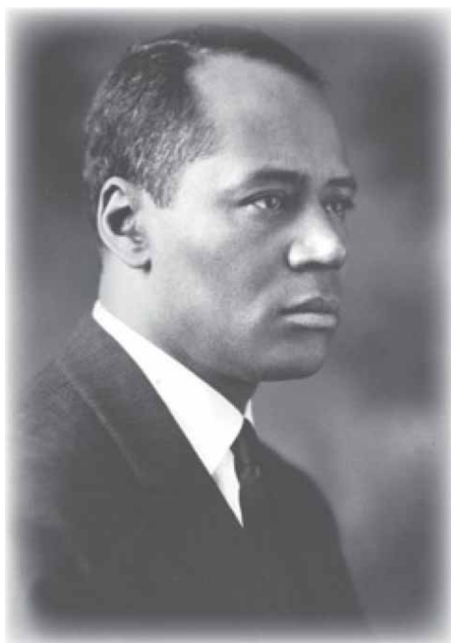
Charles Hamilton Houston em foto sem data

Houston nasceu em 1895 em Washington, D.C. Tinha apenas 19 anos quando se formou pela