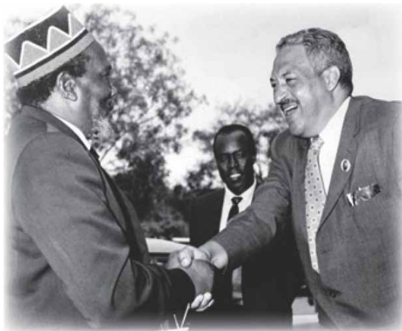
O primeiro-ministro do Quênia, Jomo Kenyatta, à esquerda, dá as boas-vindas a Thurgood Marshall em sua chegada a Nairóbi, em 11 de julho de 1965

Marshall e Mboya foram a Kiambu, fora de Nairóbi, para se reunir com líderes nacionalistas. Embora tivessem recebido a permissão exigida para a reunião, uma autoridade colonial barrou a participação de Marshall. A permissão para sua participação havia sido revogada. Esse incidente ajudou Marshall a avaliar as dificuldades que os africanos enfrentavam diariamente sob as normas coloniais. Mais tarde, em declaração à imprensa, afirmou: “chegou a hora da independência e da liberdade para o Quênia”. “Essas pessoas já agüentaram demais”, escreveu à sua esposa, “e não estão dispostas a tolerar mais nada”.