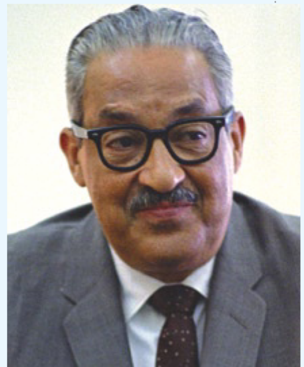
Thurgood Marshall, 1962

Foto da capa: Thurgood Marshall em 11 de setembro de 1962, após a confirmação de sua nomeação para a 2ª Circunscrição do Tribunal Federal de Recursos pelo Senado