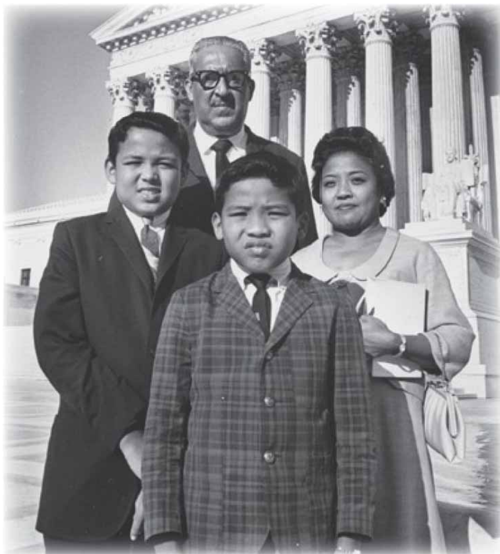
Juiz Thurgood Marshall e sua família na parte externa do prédio da Suprema Corte em Washington, D.C., em 1o de setembro de 1967, após seu juramento como juiz da Suprema Corte

O Departamento de Estado dos EUA não se responsabiliza pelo conteúdo e disponibilidade dos recursos de outras agências e organizações relacionados acima. Todos os links de internet estavam ativos em janeiro de 2007.