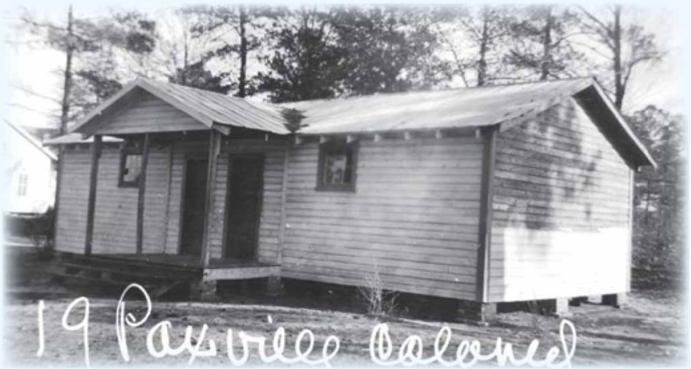
Escolas para "brancos" (ao alto) e para "negros" (acima) em Paxville, Carolina do Sul (1935-1950), onde, assim como em outros estados do Sul, as escolas para "brancos" costumavam receber duas ou três vezes mais verbas por aluno do que as escolas para afro-americanos