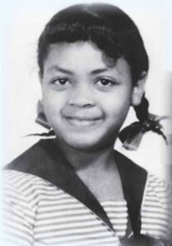
Linda Brown Smith em foto de 1952, aos 9 anos. O pai de Smith entrou com uma ação civil pública que, juntamente com 4 outras ações, levou à histórica decisão do processo Brown vs. Conselho de Educação