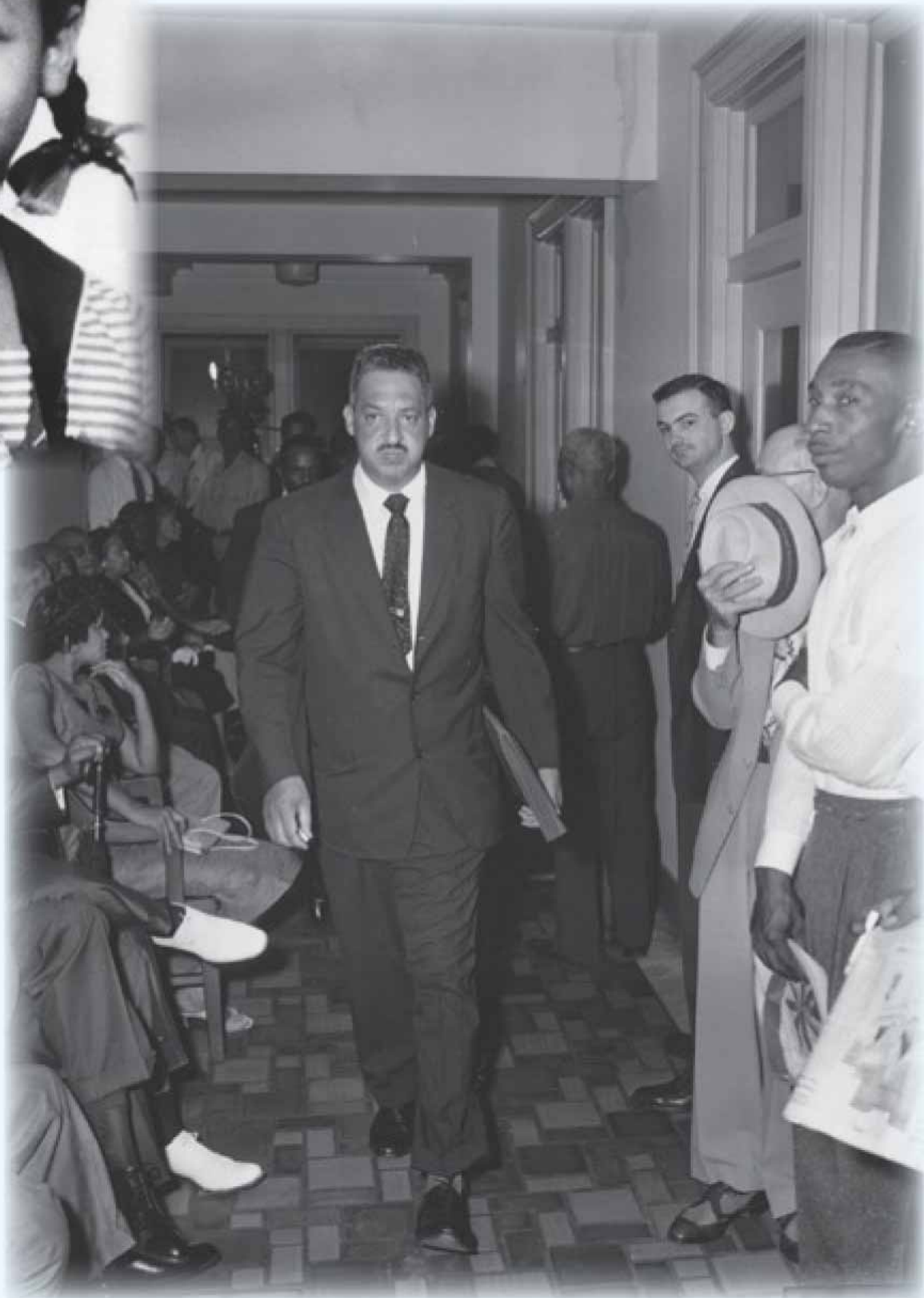
Thurgood Marshall, à esquerda, chega ao Juízo Federal de primeira instância em Little Rock, Arkansas, em 20 de setembro de 1957. Com sua habilidade profissional, ele conseguiu forçar o governador de Arkansas, Orval Faubus, a retirar a Guarda Nacional da Escola Central de Ensino Médio e integrar a escola, que anteriormente era só para brancos