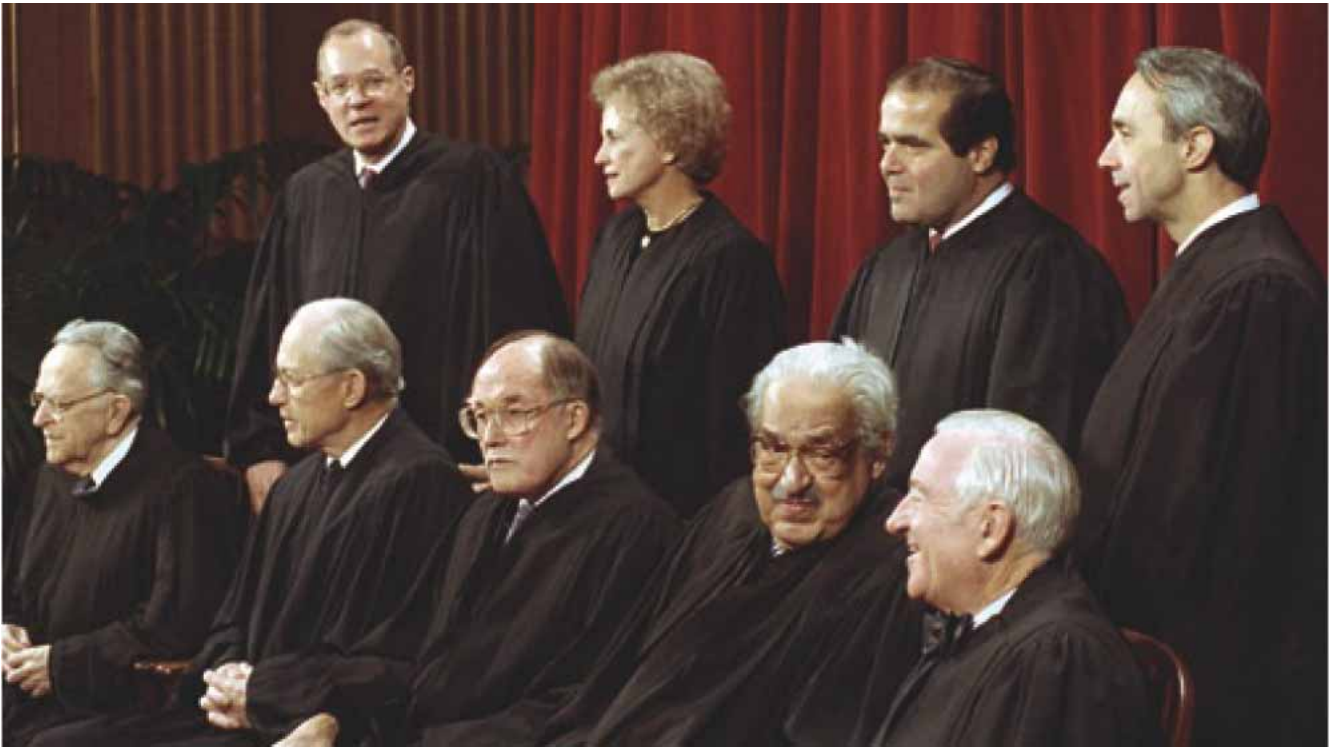
Os juizes da Suprema Corte em 1990: de pé, a partir da esquerda, Anthony M. Kennedy, Sandra Day O'Connor, Antonin Scalia e David Souter. Sentados, a partir da esquerda: Harry A. Blackmun, Byron R. White, o presidente William H. Rehnquist, Thurgood Marshall e John Paul Stevens

Em 13 de junho de 1967, o presidente Johnson nomeou Marshall para juiz da Suprema Corte dos Estados Unidos, o primeiro afro-americano a atingir esse posto. “Acredito que ele já conquistou seu lugar na história”, disse o presidente. “Mas acho que a história será muito melhorada com seus préstimos na Corte”.