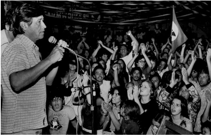
César Chavez accepte la tâche consistant à organiser les ouvriers agricoles.