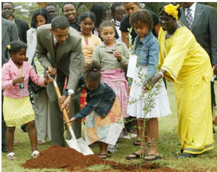
Wangari Maathai, à droite, plante un arbre à Nairobi (Kenya), en 2006, avec Barack Obama.

Il n'y a pas de formule toute faite pour susciter un changement social constructif dans un monde aussi complexe et pluriel que le nôtre. Ce dernier offre pourtant une myriade de possibilités à ceux qui ont la vision et le dévouement nécessaires pour tendre la main à un nombre sans précédent de personnes et pour élaborer des programmes puissants fondés sur les principes de la non-violence, sur le progrès et sur l'espoir. Nous rendons ici hommage à sept personnes qui montrent le moyen de favoriser ce genre de changement.