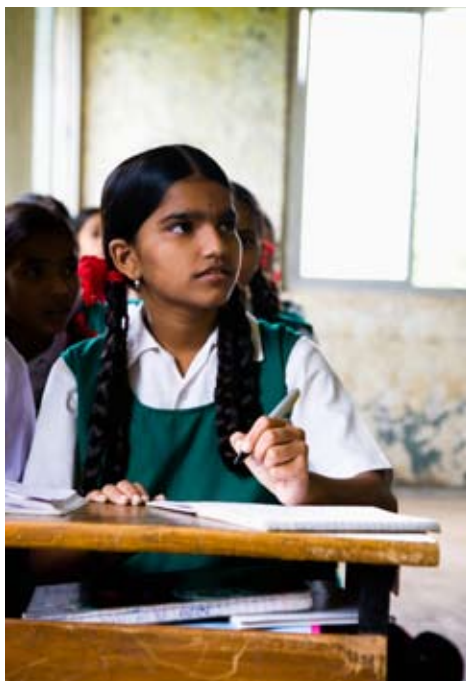
L'enseignement des filles contribue à réduire la croissance démographique et les troubles sociaux.

La statistique la plus encourageante et la plus surprenante qui émane des travaux récents de recherche sur la guerre est probablement le fait que, dans son ensemble, l'humanité est devenue beaucoup moins belliqueuse que par le passé. La Première et la Seconde Guerres mondiales et tous les autres conflits horribles du XX e siècle ont causé la mort de moins de 3 % de la population mondiale. Il s'agit d'un ordre de grandeur inférieur au taux de mortalité des mâles due à la violence dans une société primitive