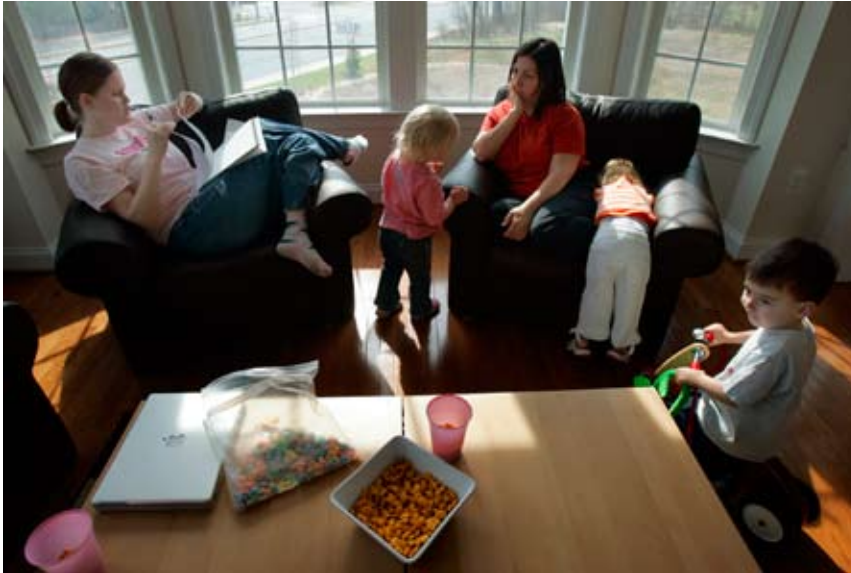
Entrées en relation grâce à l'Internet, deux partisanes de M. Obama accompagnées de leurs enfants participent à une réunion électorale.