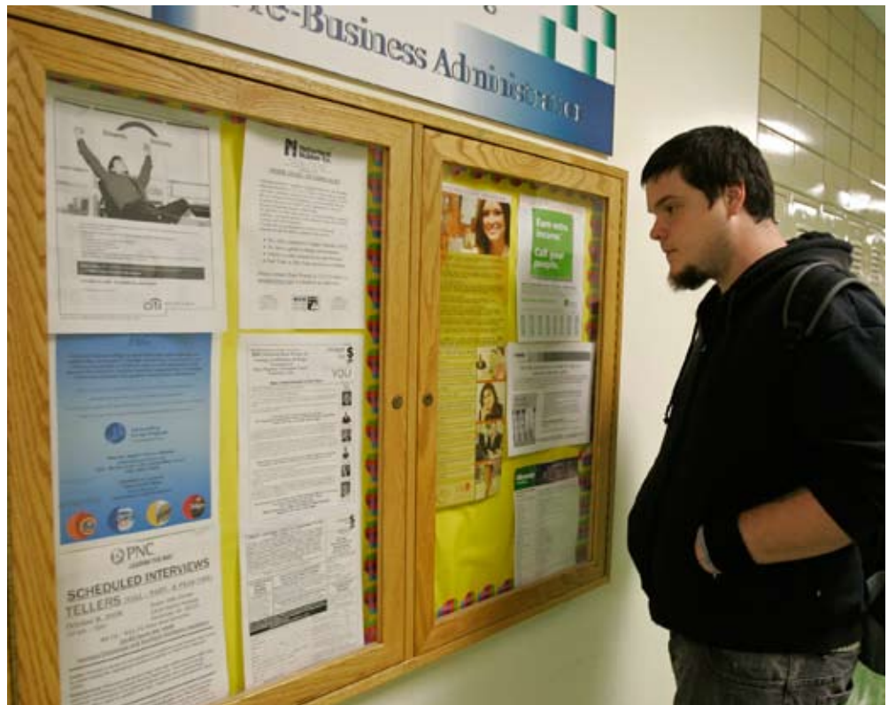
Los estudiantes del colegio universitario estatal técnico de Cincinnati pueden informarse sobre oportunidades de empleo en los tabloneros de anuncios que hay en distintos edificios del campus. Muchos sistemas de colegios universitarios que reciben fondos del Estado hacen hincapié en la importancia de capacitar a los estudiantes en las especialidades que necesitan las empresas de su zona.

Internet también ha hecho posible que un mayor número de estadounidenses pueda obtener la titulación