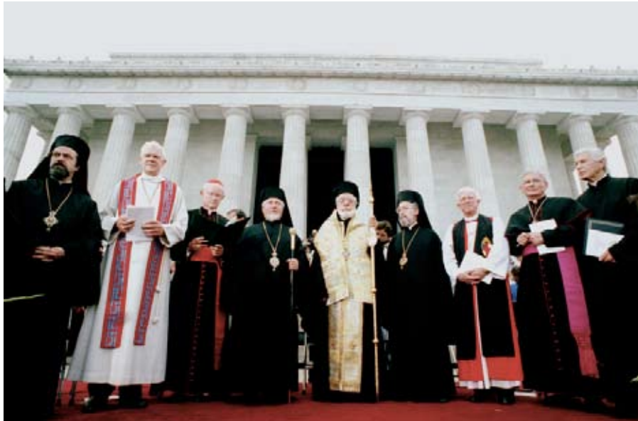
رهبران روحانی از گروه‌های ادیان مختلف برای شرکت در مراسم وحدت مذهبی برای صلح، به واشنگتن دی سی می‌آیند.

«کنگره در خصوص ایجاد مذهب، یا منع پیروی آزادانه از آن هیچ قانونی وضع نمی‌کند.»