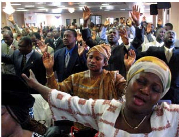
عبادت کنندگان کلیسای پنکوست در نیویورک. مهاجرت منجر به تاسیس کلیساهای انجیلی بیشتری شده است.

بودایی ها ۰,۷ درصد از جمعیت بزرگسال را تشکیل می دهند. بر خلاف اسلام و هندویسم، بودایی های ایالات متحده در وهله اول متولد همین کشور هستند. تنها یک نفر از هر سه پیرو بوداییسم از نژاد آسیایی است، و نزدیک به سه بودایی از