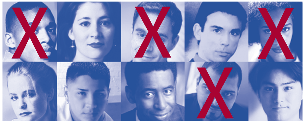
Aproximadamente cuatro de cada diez muertes por SIDA en los Estados Unidos están relacionadas al abuso de drogas.

C ualquier persona es vulnerable a contraer el VIH. Mientras que los usuarios de drogas inyectables (UDI) se exponen a un riesgo particularmente alto de contraer el VIH/SIDA, cualquier persona bajo la influencia de drogas o de alcohol tiene más probabilidad de contraerlo. Esto incluye a los UDI que comparten sus jeringuillas o accesorios para el abuso de drogas, así como cualquier persona que tenga