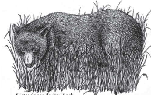
Ilustraciones de Dov Book

No beba agua de los ríos, lagos o deshielos sin antes tratarla. Hierva el agua durante cinco minutos o use un desinfectante con yodo o un filtro de agua que esté certificado para Giardia.