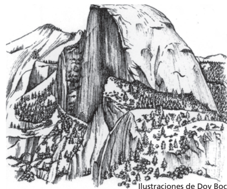
Ilustraciones de Dov Bock

Históricamente, los frecuentes incendios naturales abrieron el bosque, eliminaron las plantas que hacían competencia y dejaron un suelo rico en minerales. Pero por efecto de varios años de supresión de incendios naturales, los restos vegetales -por ejemplo las ramas caídas- se acumularon en el suelo del bosque. Esto frenó la reproducción de las secuoyas y permitió que invadieran la zona los árboles tolerantes a la sombra. Actualmente, el Servicio de Parques Nacionales realiza incendios controlados que simulan los incendios naturales y mejoran la salud del bosque.