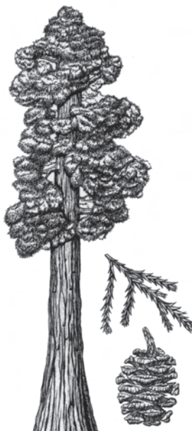
Ilustraciones de Dov Bock

En Wawona usted puede aprender más acerca del desarrollo de Yosemite y de la gente que estuvo involucrada en dicho desarrollo. En el Pioneer Yosemite History Center, usted podrá ver varias casas con características históricas al estilo de los primeros colonos y una colección de carruajes tirados a caballo.