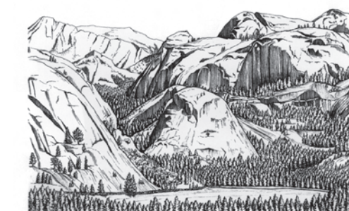
Ilustraciones de Dov Bock

Tuolumne Meadows (2.600 metros/ 55 millas/ 89 kilómetros del Valle de Yosemite, 1 hora y media en auto) es la pradera subalpina más grande de la Sierra Nevada. En verano, hay un Centro de Visitantes, lugares para camping, alojamiento, servicios de comida y carga de combustible. Esta zona, punto de partida predilecto para mochileros y caminatas diurnas, es espectacular en verano, cuando abundan las flores y fauna silvestres en las praderas. El tránsito a pie daña fácilmente las frágiles praderas de Yosemite y está vedado en ellas el acceso a bicicletas, cochecitos de bebé y vehículos. Las excursiones a las tierras altas pueden ser gratificantes, aunque a estas alturas de entre 2.000 y 4.000 metros el ejercicio agotador puede poner a prueba hasta a los visitantes más resistentes.