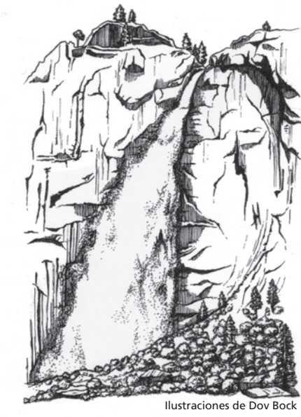
Ilustraciones de Dov Bock

Está prohibido juntar madera para fuego en el Valle de Yosemite, en los bosques de secuoyas gigantes y a elevaciones de más de 9.600 pies, pero en los demás lugares está permitido. Está prohibido juntar madera que no esté seca o caída en el suelo.