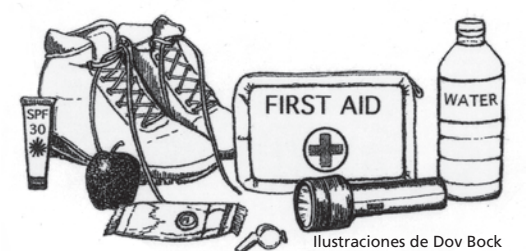
Ilustraciones de Dov Bock

climas, elevaciones y escenarios espectaculares. Cerca del filo de la cadena de la Sierra Nevada se pueden hacer viajes cortos o largos a elevaciones de más de 9.000 pies. Las regiones más altas ofrecen un clima frío, las más bajas son cálidas y secas. Los mapas y guías que se consiguen en los Centros de Visitantes pueden ayudarlo a planificar su viaje.