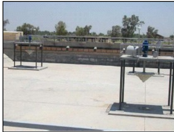
مشروع معالجة المياه الثقيلة في وسط العراق .

كانت اقسام معالجة المياه والمجاري تعمل بأقل من قدرتها الكاملة بسبب سنوات من الاهمال والعجز في الطاقة الكهربائية وعمليات السلب والسرقة التي تلت الحرب ، وقد تم ضخ الماء الغير معالج للاستهلاك من خلال النظام بينما تم تنفق المجاري الغير معالجة مباشرةً خلال شوارع المدينة والانهار والاهوار ، اضافة الى ان العديد من المناطق الريفية غير مربوطة بأنابيب المياه والمجاري الرئيسية ولا يصل اليها الماء الصالح للشرب وتعاني من المشاكل الصحية المتعلقة بضعف امكانية التخلص من المجاري . ان هدف الوكالة الامريكية للتنمية الدولية USAID هو تحسين كفاءة وقدرة اقسام معالجة المياه والمجاري الموجودة وخصوصاً تلك التي في الجنوب حيث كمية ونوعية الماء فيها منخفضة بشكل خاص ، ومن المتوقع ان الفائدة ستعود على 11.8 مليون مواطن عراقي من مبلغ $ 600 مليون دولار للوكالة الامريكية للتنمية الدولية الى مشاريع الماء وتعزيز الصحة العامة .