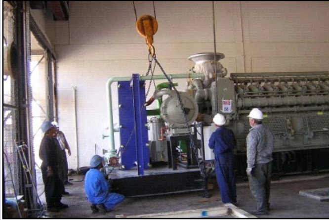
عمال يقومون بصف المبرد الزيتي للمولد الجديد .

تتضمن مشاريع الوكالة الامريكية للتنمية الدولية اعادة الطاقة الكهربائية الى المنازل والمباني العامة والشركات والتي تعتبر خطوة حرجة في اعادة تأسيس جميع ظواهر الحياة الى المجتمع العراقي والذي يتطلبه النمو الاقتصادي المستديم بعد عقود من التشغيل بدون صيانة منتظمة والتي أدت الى تأخير وصول الطاقة الكهربائية في العراق .