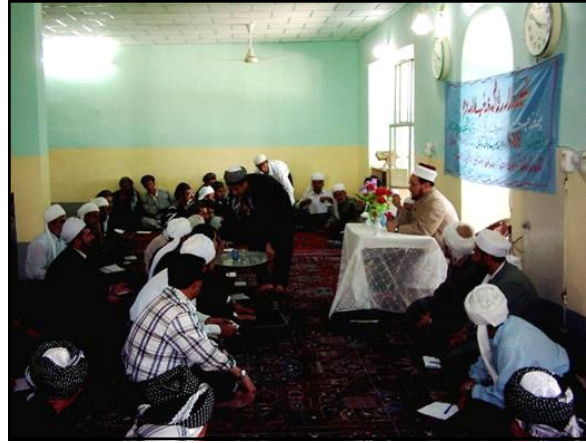
قطعة فنية من معرض تموله الوكالة الامريكية للتنمية الدولية في جنوب العراق.

يُدمج مكتب مبادرات الانتقال (OTI) التابع للوكالة الامريكية للتنمية الدولية (USAID) النشاطات المهمة التي تبني ثقة العراقيين الوثيقة في الانتقال الى عراق مستقر و ديمقراطي و قائم على مشاركة المواطنين . يعمل مكتب مبادرات الانتقال على تحديد و ملا الفراغات في جهود مساعدات الحكومة الامريكية و زيادة دعم العراقيين لعملية الانتقال من خلال توفير منح ذات تأثير سريع و كبير . و تلبية الخطوات السريعة لهذا المكتب الحاجات الاساسية من خلال توفير وظائف قصيرة المدى و استعادة الخدمات الاجتماعية و الحكومية الاساسية و زيادة وصول العراقيين على المعلومات و الاتصالات و تشجيع حماية حقوق الانسان .