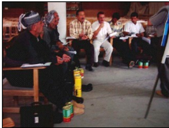
زراعة فسائل اشجار النخيل في منطقة الاهوار في العراق.

لقد تدهورت الزراعة نتيجة لسنوات من سياسة الحكومة المتعسفة و الحروب، حيث ان انخفاض انتاج المزارع لا يمكن ان يوفر مصدر غذائي يعتمد عليه للمدن و السكان في المناطق الريفية. اكثر من نصف المتطلبات و الحاجات الغذائية في العراق يتم استيرادها كما يعتمد نسبة كبيرة من السكان على الحصص الغذائية التي تقدمها الحكومة كمصدر غذائي. و لاعادة تاهيل البنى التحتية الزراعية و زيادة الانتاج و استعادة الخدمات عملت الوكالة الامريكية للتنمية الدولية بالتعاون و التنسيق مع الوزارات العراقية و القطاع الخاص و معاهد و مؤسسات التعليم العالي لاعادة احياء الانتاج الزراعي و توفير فرص عمل و مصدر للدخل و مبادرات عناية بالمناطق الريفية و اعادة تاهيل المصادر الاساسية الطبيعية.