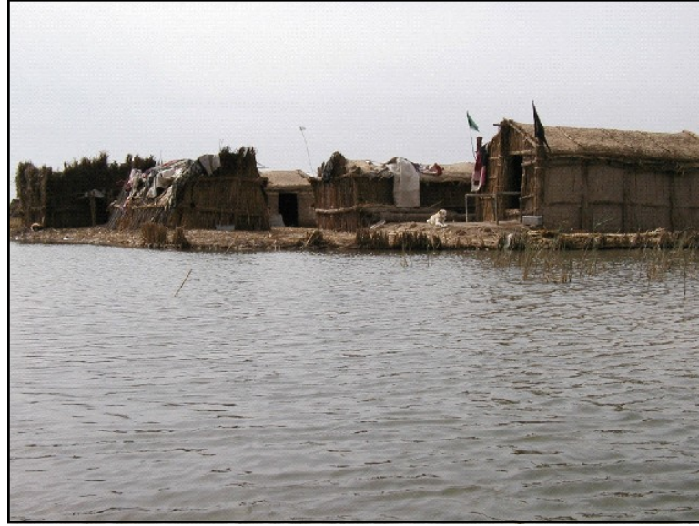
الاستقرار في الاهوار العراقية.