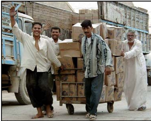
وكلاء الغذاء العراقيون يقومون بأستلام المواد التموينية من نظام التوزيع العام للغذاء.

الأمن الغذائي - - تتضمن مشاريع الوكالة الامريكية للتنمية الدولية USAID في مجال الأمن الغذائي في العراق تقديم الدعم لنظام التوزيع العام الغذائي في عموم القطر والذي يوفر الغذاء الاساسي والسلع الغذائية وغير الغذائية الى تقريباً 25 مليون مواطن اضافة الى المشاركة في أعداد برامج المساعدات المادية بدل السلع الاساسية في نظام التوزيع العام لدعم الانتاج المحلي والبنى التحتية للاسواق العامة وتطوير الاصلاح الزراعي الشامل لأفضلية المشاركة الخاصة في الانتاج وأسواق البيع بالجملة .