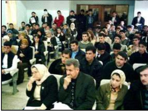
: مشاركين في جلسة عن الصحة في كلية الآداب في اربيل.