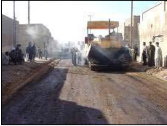
معدات آلية ثقيلة تقوم بتبليط الطرق في الراشدية.