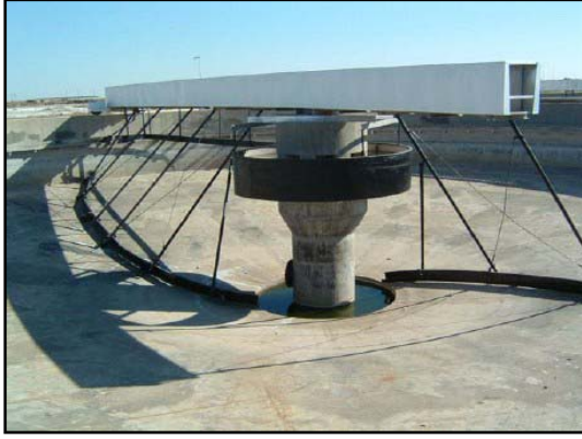
مشروع الديوانية لمعالجة المياه الثقيلة.