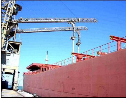
عملية تفريغ سفينة في قسم استلام الحبوب في ميناء ام قصر.