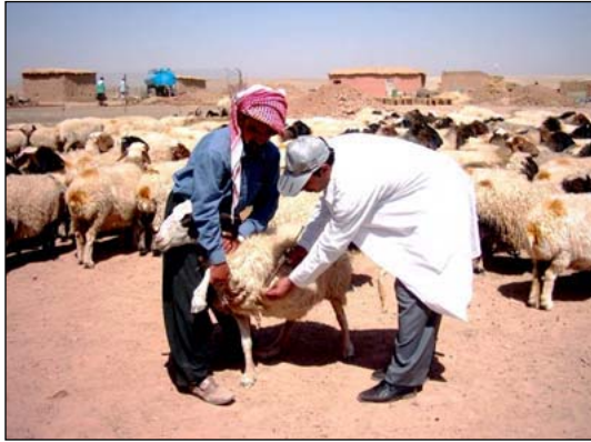
عملية تلقيح الاغنام قرب مدينة كركوك.