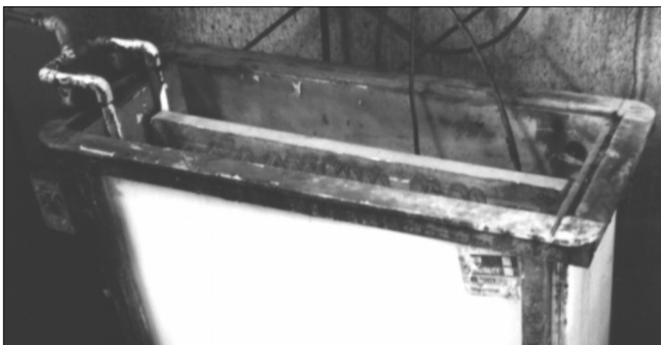
El tanque de recuperación cerrado de T.S. Designs ha reducido el uso de agua de la compañía por la mitad.

El proceso de eliminación de emulsión presentaba varios de los mismos problemas del proceso de eliminación de tinta. Se lavaban demasiados químicos peligrosos y se descartaban en