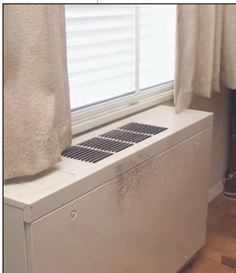
Moho creciendo sobre la superficie de un ventilador.