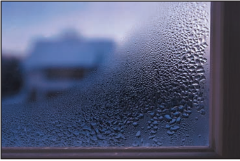
Condensación en el interior del vidrio de la ventana.