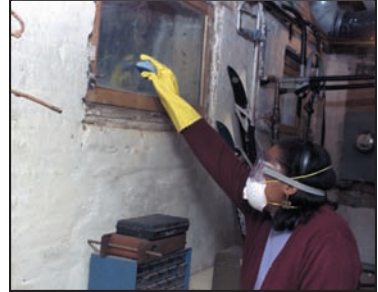
Persona limpiando con respirador N-95, guantes y gafas de protección.