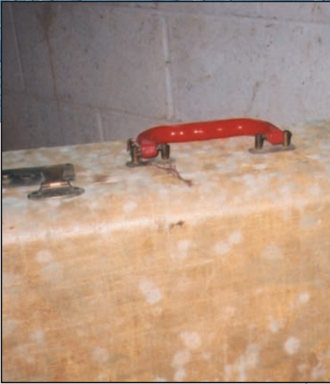
Moho creciendo en una maleta guardada en un sótano húmedo.

Es importante tomar precauciones que limiten su exposición al moho y a las esporas de moho.