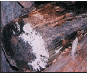
Moho creciendo sobre leña al exterior. Los mohos tienen varios colores, esta foto enseña ambos mohos blanco y negro.

¿Por qué crece el moho en mi hogar? Los mohos forman parte del medio ambiente natural. Al exterior, los mohos juegan un papel en la naturaleza al desintegrar materias orgánicas tales como las hojas que se han caído o los árboles muertos. No obstante, al interior, es necesario evitar el moho. Los mohos se reproducen mediante esporas; las esporas son invisibles a simple vista y flotan en el aire exterior e interior. Las esporas de mohos se hallan normalmente presentes en el aire exterior e interior. El moho puede crecer al interior cuando las esporas caen sobre