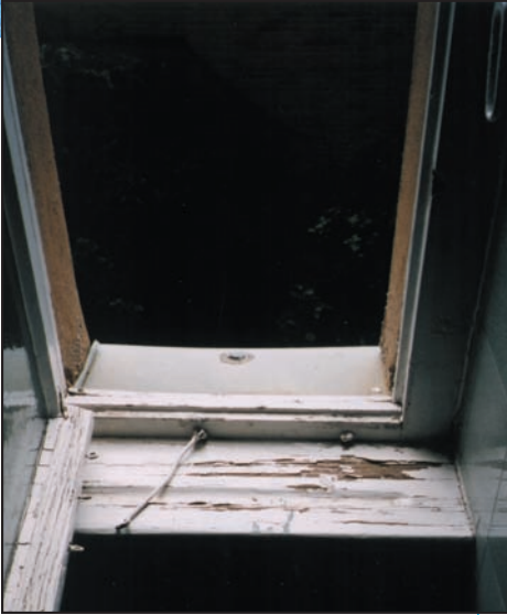
Ventana con fugas - el moho está empezando a crecer en el marco de madera y en el apoyo de la ventana.

Si ya tiene un problema con el moho — ACTÚE RÁPIDAMENTE.