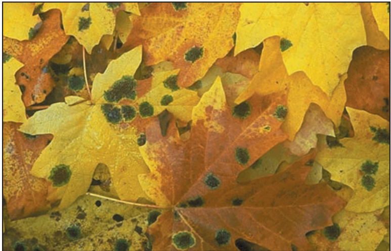
Moho creciendo en hojas caídas.

Se puede obtener este documento del sitio Web de la División para Medio Ambientes Interiores, EPA en www.epa.gov/mold