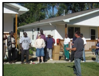
UNL - Extensión Condados de Douglas y Sarpy