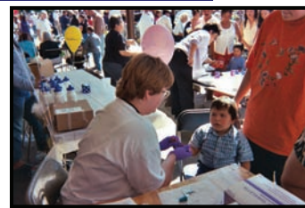
Departamento de Salubridad del Condado de Douglas