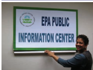
EPA Centro de Información Pública Sucursal Norte