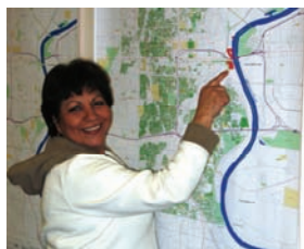
EPA Centro de Información Pública Sucursal Sur