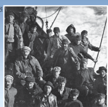
左上：三文魚漁人在Star of Alaska號上，加州，1920年代；右上：公園的研究圖書館；下：蒸氣船小冊，1880年代。