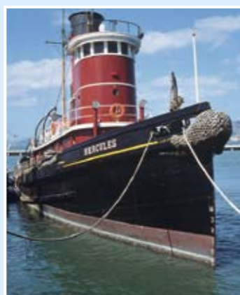
Hercules號：蒸氣推動拖船；139呎；於1907年在新澤西州Camden建造。