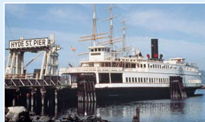
Eureka號：船側明輪渡船；299.5呎；原名Ukiah號，先於1890年在加州Tiburon建造；1922年重建，改名Eureka號。