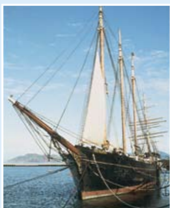
C.A. Thayer號：三桅縱帆船；156呎；於1895年在加州Fairhaven建造。