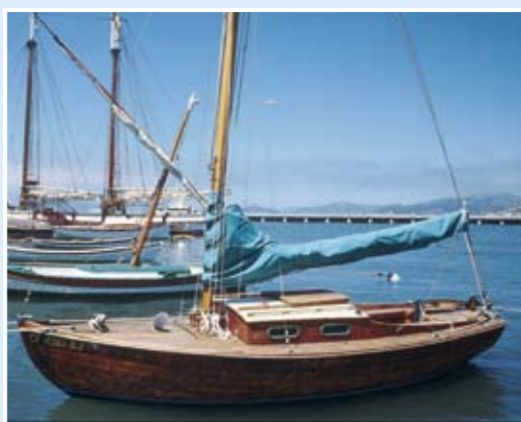
在Hyde Street碼頭東邊停泊的小船。