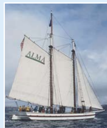
Alma號：平底縱帆船；59呎；於1891年在加州舊金山建造。