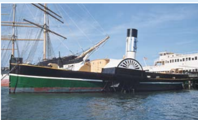
Epplerton Hall號：鋼拖船；100.5呎，於1914年在英國South Shields建造。