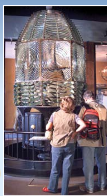
Printed Spring 2008. Printed on recycled paper. Chinese version.