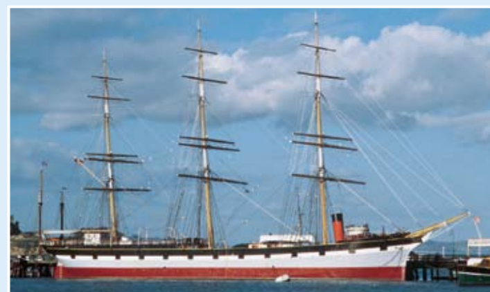
Balclutha號：橫帆船；256呎；於1886年在蘇格蘭格拉斯哥建造。