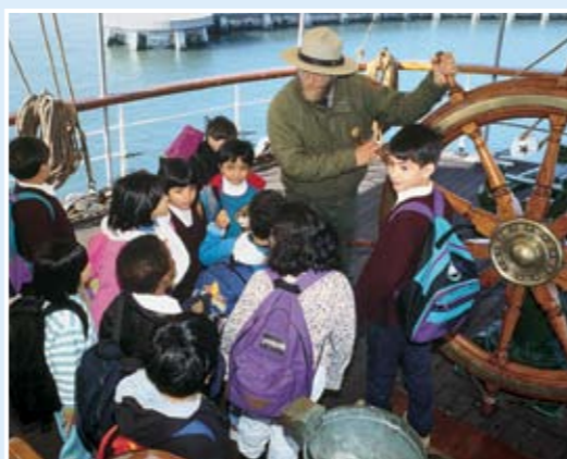
學童在Balclutha號上。公園管理員為不同年齡的訪客提供講解。

文物，剪貼簿，水手工藝品，和船上的機器——都講出了創製和使用者的故事。在訪客中心的Collections Discovery Room，請留心聽聽水手歌(Chanteys)或一段在1906乘公園的運木縱帆船C.A. Thayer號旅程之口述歷史。對希望深入認識的訪客來說，海事圖書館藏有數以千計的書本，照片和文件，是研究西岸海事歷史的第一站。