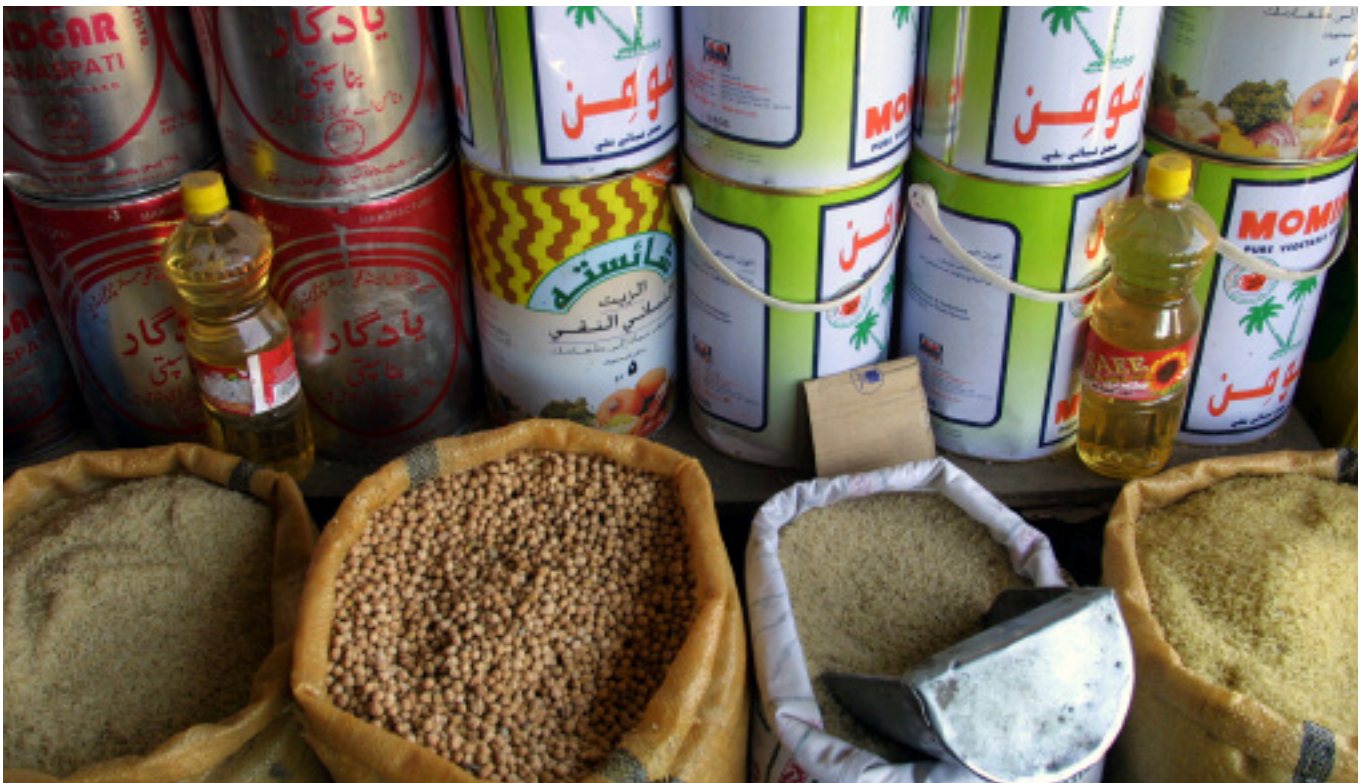
Los granos básicos en un mercado en Afganistán.

En julio de 2004, los miembros de la OMC se fijaron un programa ambicioso para la conclusión de la Ronda de Doha de negociaciones comerciales. En ese momento, los miembros reconocieron,