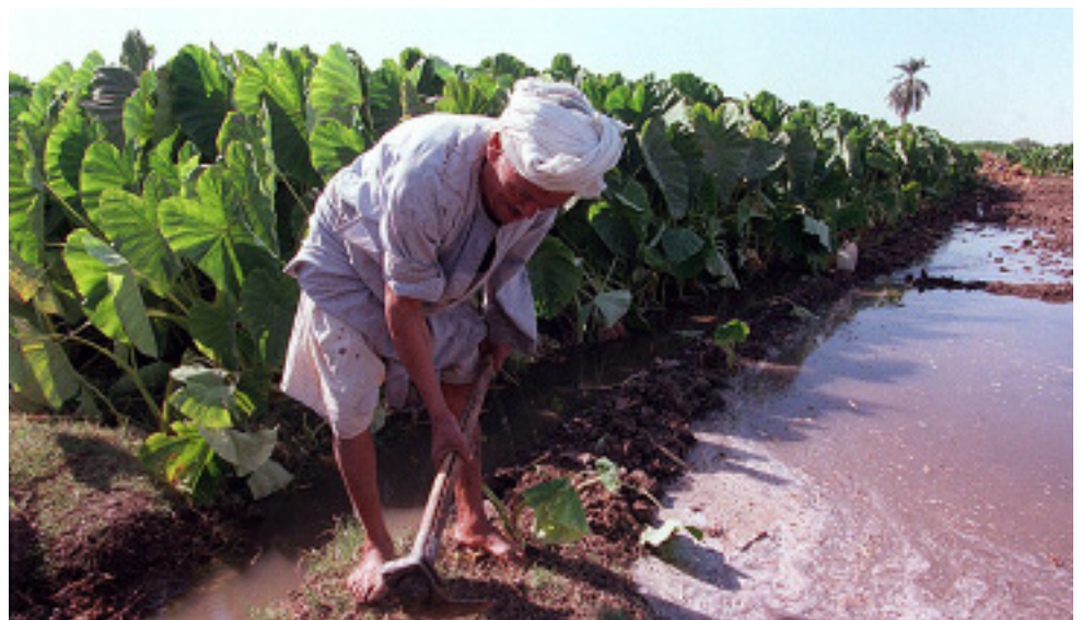
Mejora de la productividad en el sector agrícola de Egipto.

Uno de los mecanismos primordiales de los Estados Unidos para prestar asistencia a la