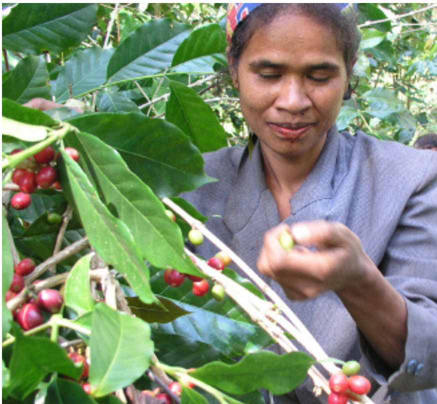
Los cultivadores de café de Timor-Leste amplían sus ventas mediante el reconocimiento de los posibles mercados de café orgánico certificado.

Los Estados Unidos son el mayor país donante de asistencia para el FCC, a lo que contribuyen más de $1.340 millones durante el ejercicio fiscal de 2005, lo que representa un aumento considerable respecto de los