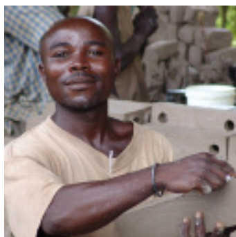
En Uganda, el fortalecimiento en capacidad de comercio ayuda al crecimiento de las pequeñas empresas.

Director, Departamento de Comercio y Competencia, 7 de octubre de 2005