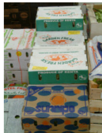
Productos agrícolas de Kenya listos para envíos a destinos locales o internacionales.

Otros tipos de asistencia abarcan desde los servicios energéticos hasta el turismo sustentable. La Iniciativa Regional del Asia Meridional tiene un aspecto energético que promueve la formación de vínculos mutuamente beneficiosos en materia de energía entre las naciones del sur de Asia. Este programa fomenta la comprensión de los beneficios derivados del comercio energético regional y establece la capacidad para aprovechar las oportunidades que ofrece ese comercio. En Ecuador, la asistencia técnica y la formación respaldan el ecoturismo basado en los recursos locales como opción productiva a la sobrepesca, mejora la administración local y fomenta un plan de zonificación marina.