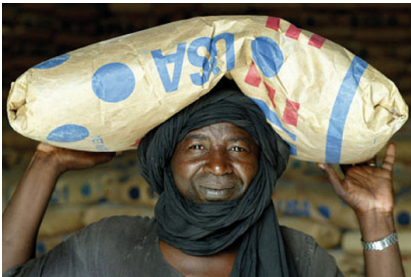
Los programas regionales de los EEUU en Africa del Oeste apoyan a las poblaciones locales.

En Monterrey, México, el Presidente George W. Bush hizo un llamamiento en favor de un nuevo pacto para el desarrollo mundial que vincule unas contribuciones mayores de los países desarrollados a una mayor responsabilidad de las naciones en desarrollo. Como respuesta, los Estados Unidos establecieron la MCC en 2004 para colaborar con algunos de los países menos favorecidos del mundo. La MCC se fundamenta en 50 años de experiencia de los Estados Unidos en materia