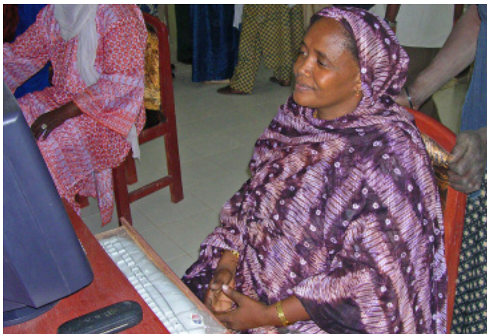
Unos clientes que utilizan un Centro comunitario de Información en Mali.

los donantes se ha reconocido como una "práctica óptima" para la gestión general del proceso del MI.