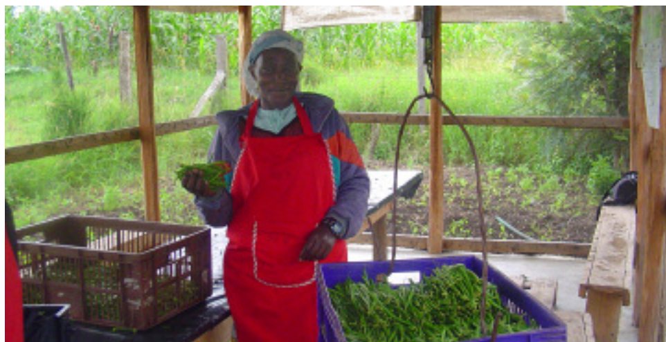
Unos agricultores de Kenya clasifican, pesan y almacenan productos agrícolas para mantener la calidad y la inocuidad.