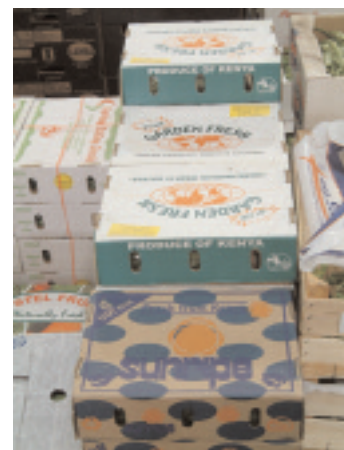
La production du Kenya prête pour l'exportation locale ou mondiale.

Une autre aide s'étend des services d'énergie au tourisme soutenable. L'initiative régionale de l'Asie du Sud inclut un composant d'énergie qui favorise les liens mutuellement salutaires d'énergie parmi les nations de l'Asie du sud. Le programme favorise un arrangement des avantages du commerce régional d'énergie et établit la capacité pour des occasions marchandes d'énergie. En Équateur, les appuis d'assistance technique et de formation soutiennent l'écotourisme local comme une alternative productive aux pêches excessives, améliore le gouvernement local et favorise un plan marin de zonage.