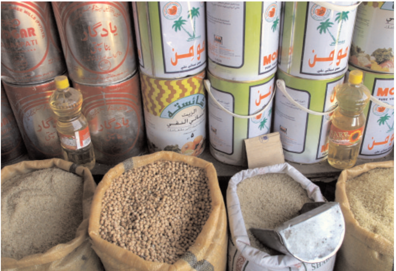
Grains sur une marche en Afghanistan.

États-Unis ont fourni récemment des services d'accèsion et de mise en oeuvre de l'OMC au Népal, qui est officiellement devenu un membre de l'OMC en 2003, et au Cap Vert. L'Ukraine et un certain nombre de pays en Europe de l'Est et dans l'ancienne Union Soviétique ont également profité du support des États-Unis dans ce secteur. En 2004, l'USAID a répondu à la demande d'aide de l'Éthiopie dans son procédé d'accèsion en lançant un projet important de trois ans. Les États-Unis ont fourni un fort appui d'accèsion en 2004 à l'Irak et à l'Afghanistan.