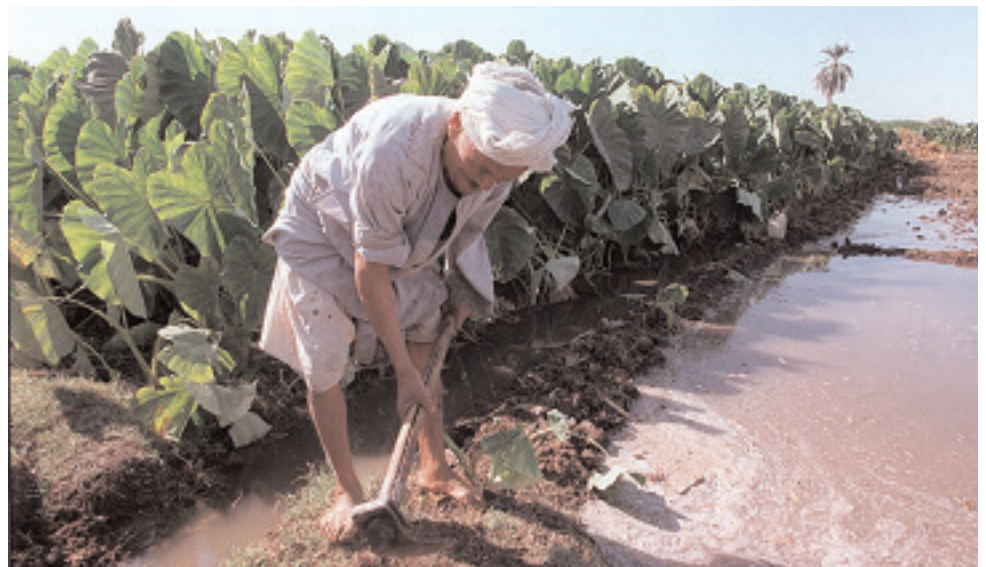
L'amélioration de la productivité du secteur de l'agriculture en Egypte.