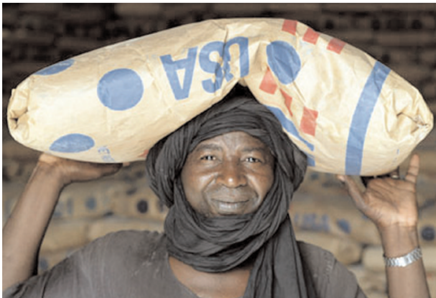
Les programmes régionaux du USAID en l'Afrique d'Ouest don un appui aux populations locale.

À Monterrey, au Mexique, le Président George W. Bush a réclamé un nouveau contrat pour que le développement global lie les plus grandes contributions des nations développées aux plus grandes responsabilités des pays en voie de développement. Pour ceci, les États-Unis ont établi le MCC en 2004 pour travailler avec certains des pays les plus pauvres au monde. Le MCC a mené