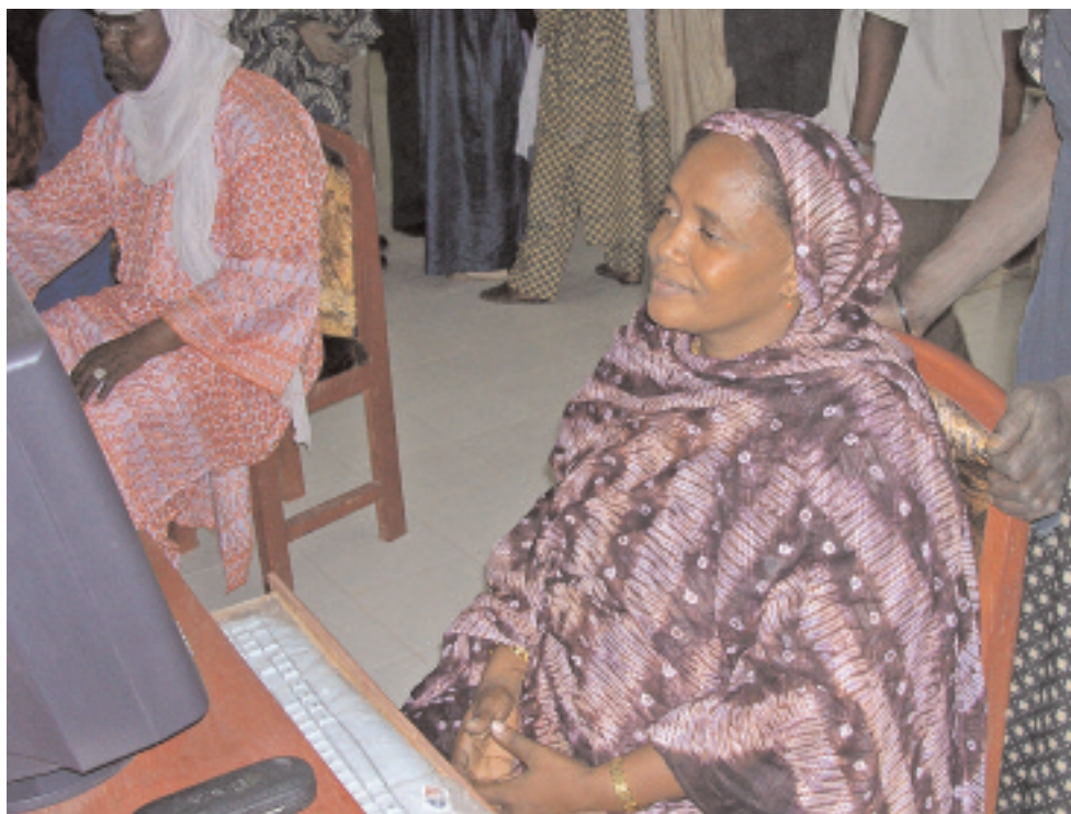
Des clients utilisant un Centre d'information de la communauté au Mali.

L'aide bilatérale de l'USTCB aux LDC participant au processus de l'IF a monté de $36.6 millions en 2001 à plus de $132.9 millions en 2005. Ceci est complété par les contributions américaines aux fonds en fidéicommis de l'IF et aux programmes de l'IF du Centre du commerce international à Genève.