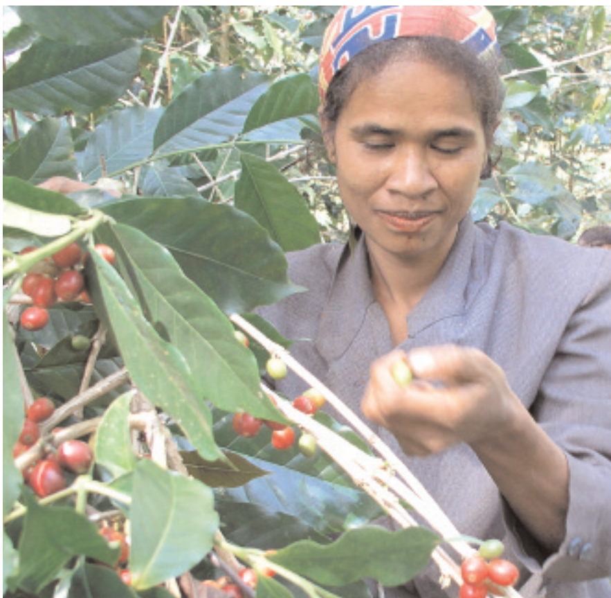
Les producteurs de café du Timor de l'Est augmentent les ventes en identifiant les marchés potentiels pour le café organique certifié.

Les États-Unis sont le plus grand pays donateur pour l'assistance au Renforcement des capacités liées au commerce, fournissant plus de $1,34 milliards pour l'année budgétaire 2005, alors qu'il n'était que de $921,2 millions en 2004. Le Compte du Millénaire des États-Unis (MCA) a contribué au financement du TCB pour la première fois