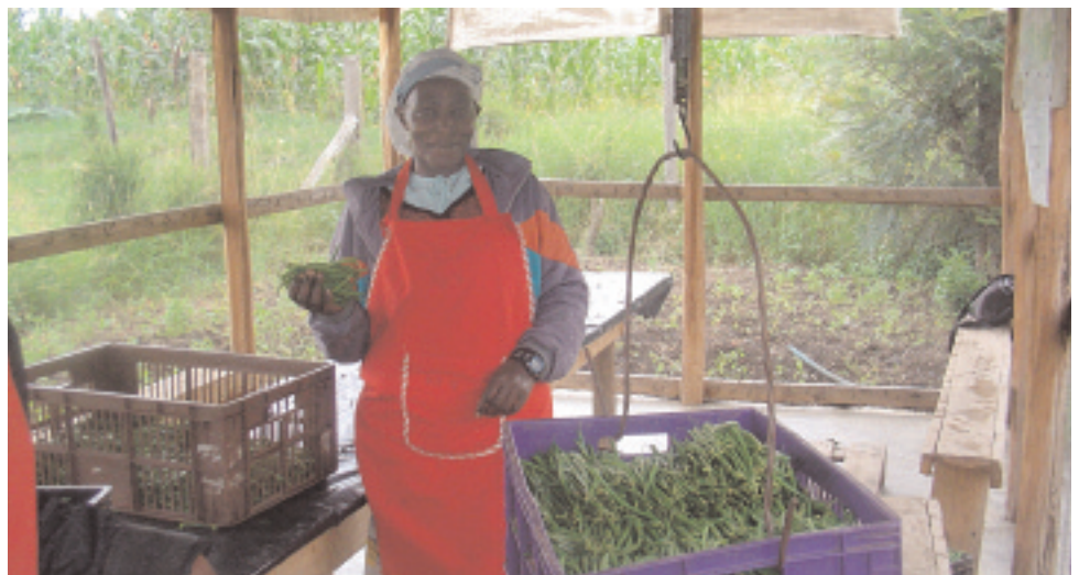
Les fermiers dans la catégorie du Kenya pèsent et stockent le produit pour maintenir la qualité et la sûreté.

■ Starbucks and Green Mountain Coffee (Starbucks et le café vert de montagne), à travers l'Alliance de finances pour le commerce soutenable, aide les petits fermiers à changer à des techniques de production soutenables et les aident à attirer un bon marché pour un café organique certifié. Cette alliance fournit de l'aide en Amérique Centrale et dans