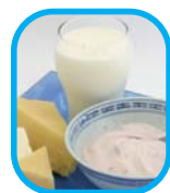
Leche sin contenido graso (fat-free) y productos lácteos de bajo contenido graso (1%)