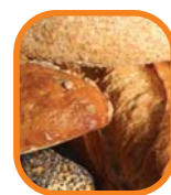
Grains (especially whole grains)

Before going to el mercado , use the idea of a rainbow as your guide for planning meals. Let each color of the rainbow represent a different type of food group. Check your food shopping list to make sure you have included many "colors" for the meals you and your family will prepare.