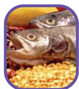
Carnes de bajo contenido graso, aves, pescado, huevos, frijoles, guisantes (arvejas), nueces y semillas.