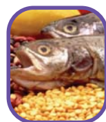
Lean meats, poultry, fish, eggs, beans, peas, nuts, and seeds