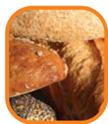
Granos (especialmente granos integrales)

Antes de ir al mercado use el ejemplo del arco iris como guía para planificar sus comidas. Haga que cada color del arco iris represente un tipo diferente de grupo alimenticio. Verifique si su lista de compras representa los diferentes alimentos con los "colores" del arco iris para las comidas que usted y su familia preparará: