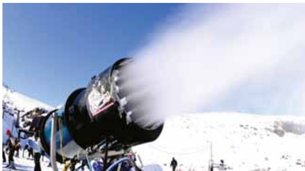
雪球的影响: 随着越来越多注意力聚集在滑雪的影响上,也许更多的滑雪度假村将签署或遵从亲环境项目,如永续坡道倡议。