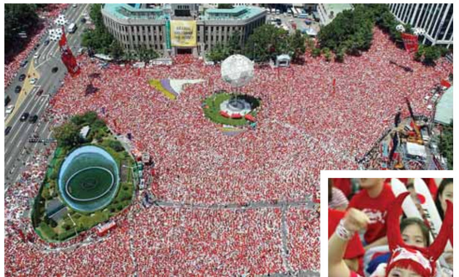
疯狂的球迷：韩国足球迷聚集在汉城观看2002年世界杯四分之一决赛实况转播。2006年世界杯正在努力通过抵消温室气体释放、重复利用和缓解交通来达到对环境的零影响。

为了改善环境状况，美国178个滑雪度假村已经签署了国家滑雪区协会永续坡道倡议（National Ski Areas Association's Sustainable Slopes Initiative），倡议汇集了滑雪最佳环境实践经验，2000年6月起实施。倡议对滑雪地区在诸如计划设计、水和能源利用、垃圾回收、空气质量和森林管理等方面制订了21条规则。有71个滑雪度假村还参加了由美国国家滑雪区协会和国家自然资源保护委员会发起的“让冬季保持洁净”倡议，这项倡议旨在促进在滑雪项目中有效利用能源，以及支持“反对气候变化”有关的立法。