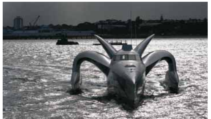
为了保护地球，共同努力：钓鱼和划船运动有许多生态方面的负面影响，但是Earthrace号行动(上方)试图打破使用绿色燃料的环球航海记录，其目的是显示它的海上运动能够较少损害环境。

然而，高尔夫、滑雪和汽车比赛不是仅有的产生环境问题的运动项目。钓鱼被一些人认为是一项有竞争性的运动，而另外一些人则认为是一种消遣娱乐的运动，钓鱼活动正在显现出对鱼群种类非常大的影响。2004年8月27日出版的《科学》(Science)杂志上的一个研究显示：娱乐性钓鱼中捕获的鱼，其中有四分之一是属于美国政府确认为种群正在下降的鱼类。也已经发现其它水上运动对环境有显著影响。传统的舷外发动机和私人小船可能会有30%没有燃烧的燃油释放到水中。海上休闲性娱乐活动中，发动机向空气中散发了大量的碳氢化合物。船类活动项目对许多