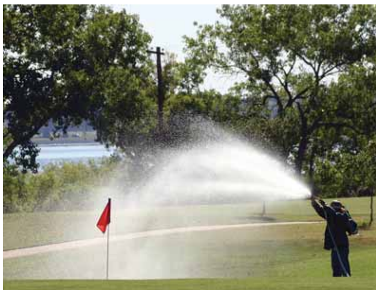
渴望绿色: 高尔夫球场消耗大量的水和杀虫剂,引起了打高尔夫球的人和附近居民双方的关注。

Cohen 开展了一项美国高尔夫球场对水质量影响的调查,目前为止是这一领域最大型的研究,结果发表在 1999 年 5~6 月出版的《环境质量杂志》(Journal of Environmental Quality)上。论文汇总了在 36 个高尔夫球场进行的 17 项研究结果,然而几乎没有发现环境损害方面的证据。Cohen 写道:“各个独