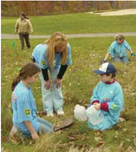
为比赛买单：孩子们在底特律地区植树，作为第40届超级杯减碳项目的一部分。