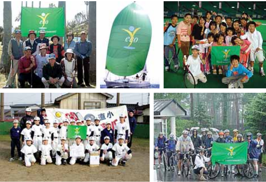
生态旗帜：体育运动中环境意识的标志，在体育赛事上飘扬。

的奥林匹克一百周年大会上，与运动和文化一起，环境因素被确定为奥林匹克宪章中三大基石之一。1995年，由UNEP同国际奥委会(IOC)一起主办、在瑞士洛桑举行的第一届世界体育和环境大会是一个关键性的里程碑，与会代表制订了IOC运动和环境协议。最近一届世界性会议于2005年11月在内罗毕举行，会议起草了关于运动、和平和环境的内罗毕宣言，呼吁IOC和各个国家的奥林匹克委员会充当主导角色，通过运动促进环境的可持续发展。