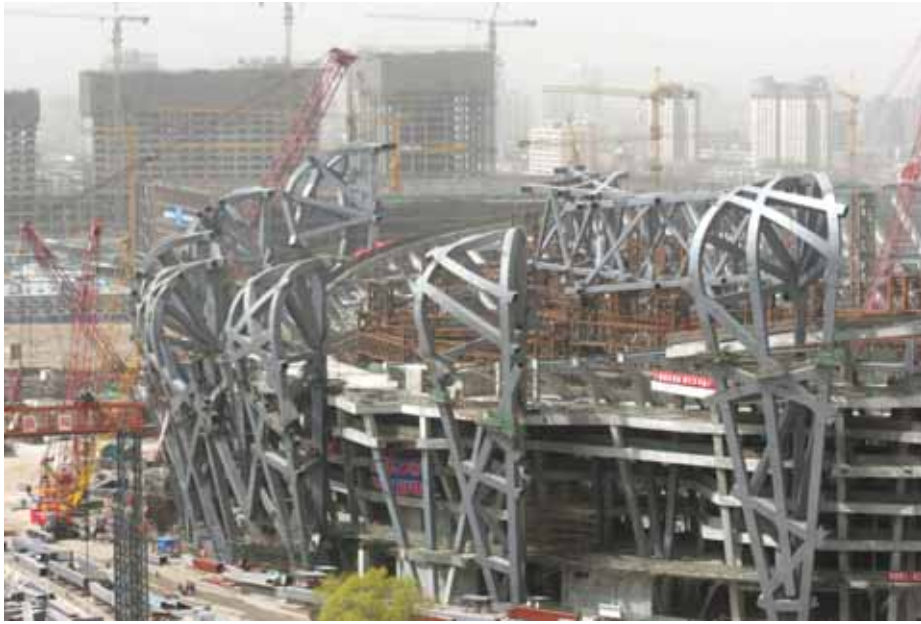
比赛环境：起重机在给国家奥林匹克露天运动场添加钢材块，撞击着正在建设中的2008年奥林匹克运动会运动场“鸟笼（Bird Cage）”。中国投标申请主办赛事中包含环境评估，描述了如可持续运用建筑的承诺。