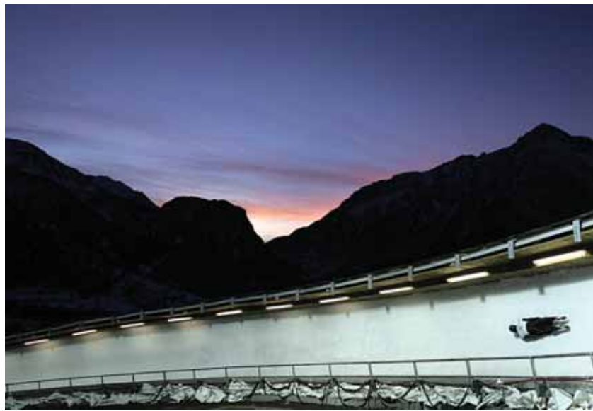
如履薄冰？2006年都灵冬季奥运会使用的长雪橇滑道，含48吨氨，如果泄漏将伤害野生动物。

Pretato认为，除了都灵所有比赛地点和体育场馆的能量消耗外，都灵的OOC考虑到了所有