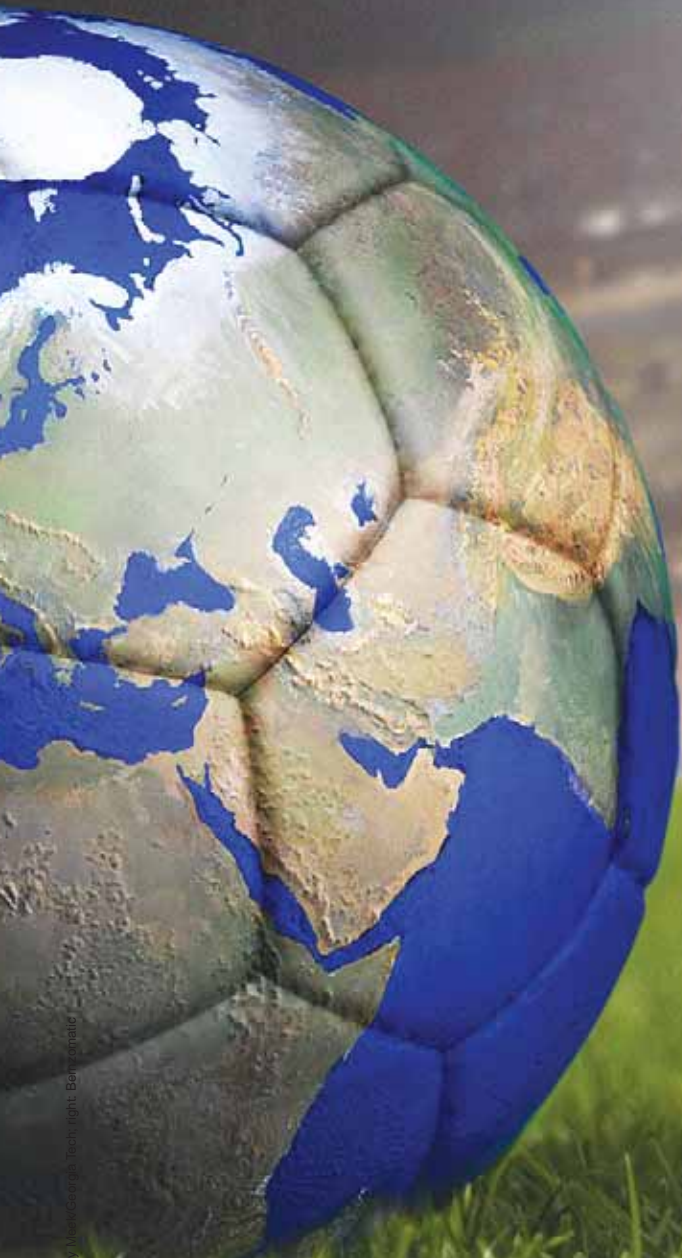
Opposite: Gary W. McCarroll/Photofest; Ben Chait