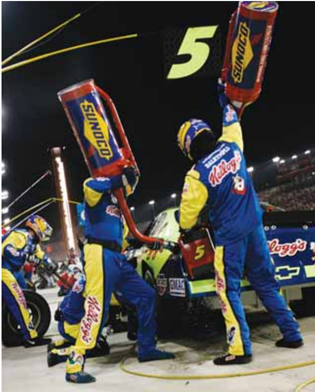
为清洁空气而加固跑道：迫于环保组织要求逐步停止含铅气体释放的压力，2008年起，NASCAR 将要求赛车使用由 Sunoco 制造的无铅燃料。