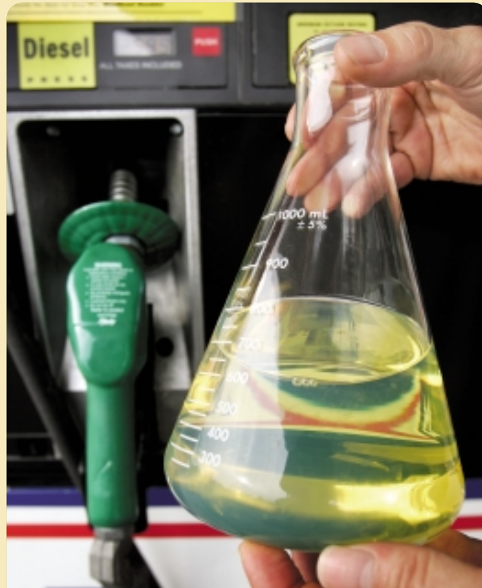
Una mezcla más saludable. Una muestra de combustible B20 que contiene un 20% de biodiesel y 80% de diesel estándar. El biodiesel fabricado de aceite vegetal químicamente alterado se quema de manera más limpia que el combustible diesel tradicional.

Sin embargo, McCormick señala que el biodiesel emite cantidades cuestionables de óxidos de nitrógeno (NO x ) —contaminantes del aire que se mezclan con la luz del sol para formar smog, un irritante respiratorio. “Muchos estudios muestran pequeños