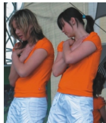
...i tanečnice moderního aerobiku