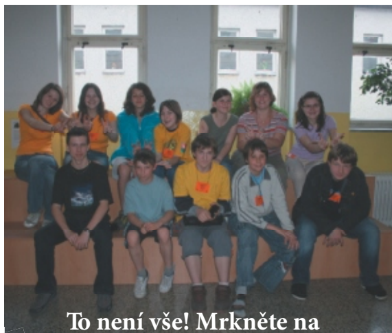
To jsme my