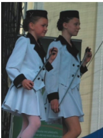
Na Festivalu Globe vystoupily mažoretky...

Největší letošní změnou a zároveň lákadlem byl Festival GLOBE konaný v pátek na náměstí. Také by se dal nazvat „chytřým využitím dne navíc“. Rozhodně však nebyl akcí z nouze.