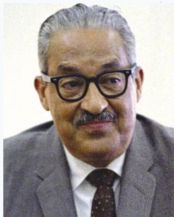
Thurgood Marshall, 1967

Foto de portada: Thurgood Marshall, en el 11 de septiembre, 1962, luego de que el Senado aprobara su puesto en el Tribunal Federal de Apelaciones para el Segundo Circuito.