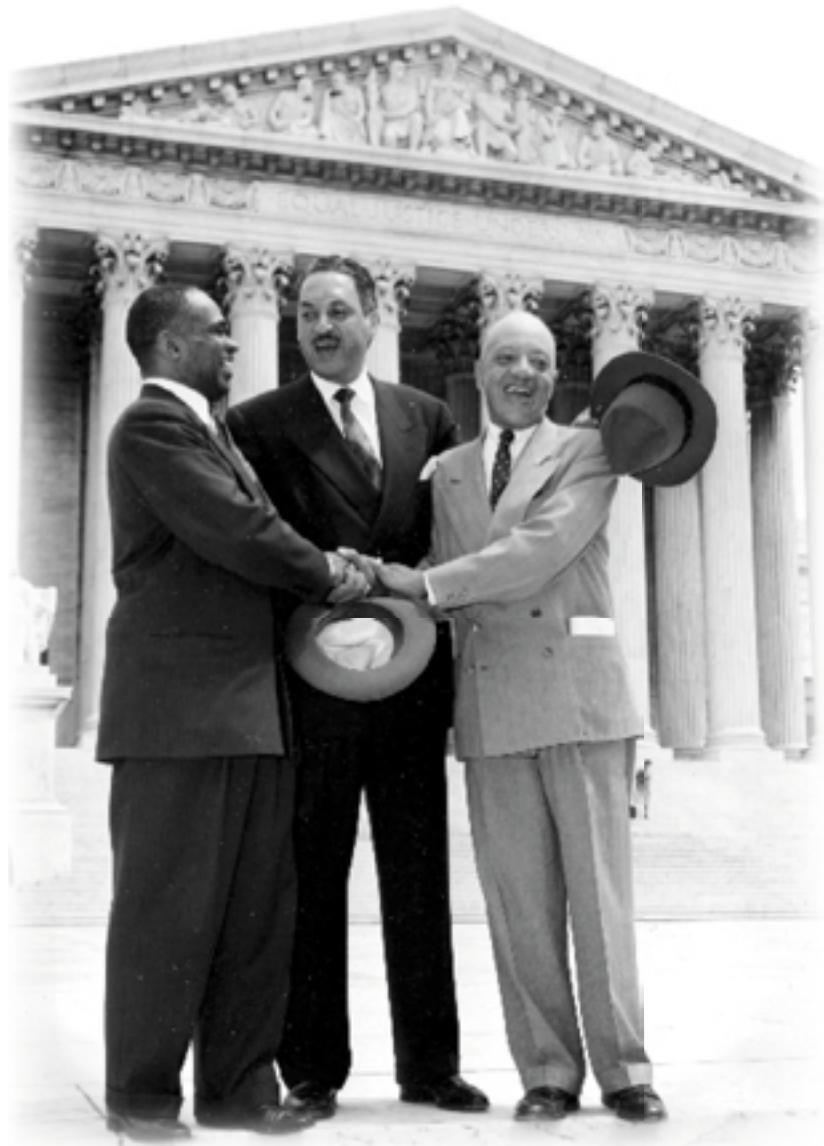
En momentos posteriores al veredicto en el proceso Brown v. Junta de Educación, los abogados George E. C. Hayes (izquierda); Thurgood Marshall (centro) y James M. Nabrit (derecha) se toman de las manos frente la Corte Suprema de Estados Unidos, celebrando su victoria.

De modo significativo, el tribunal procesal había rechazado la demanda de desagravio de Kansas (técnicamente, el demandante era el padre de Linda Brown, el reverendo Oliver Brown), al determinar que las escuelas segregadas blancas y negras eran de calidad