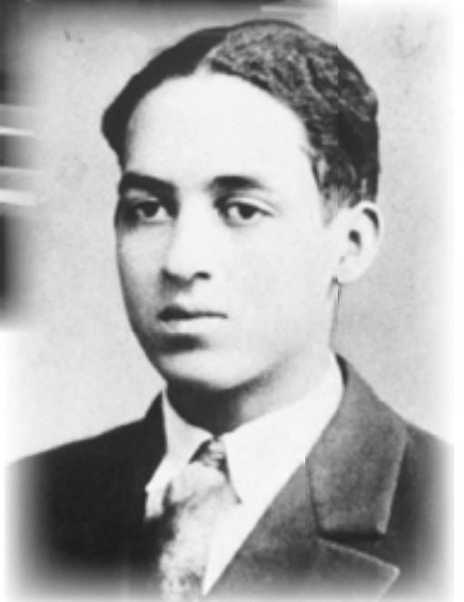
Esta fotografía de Thurgood Marshall en la escuela secundaria fue tomada en algún momento entre 1921-1925.