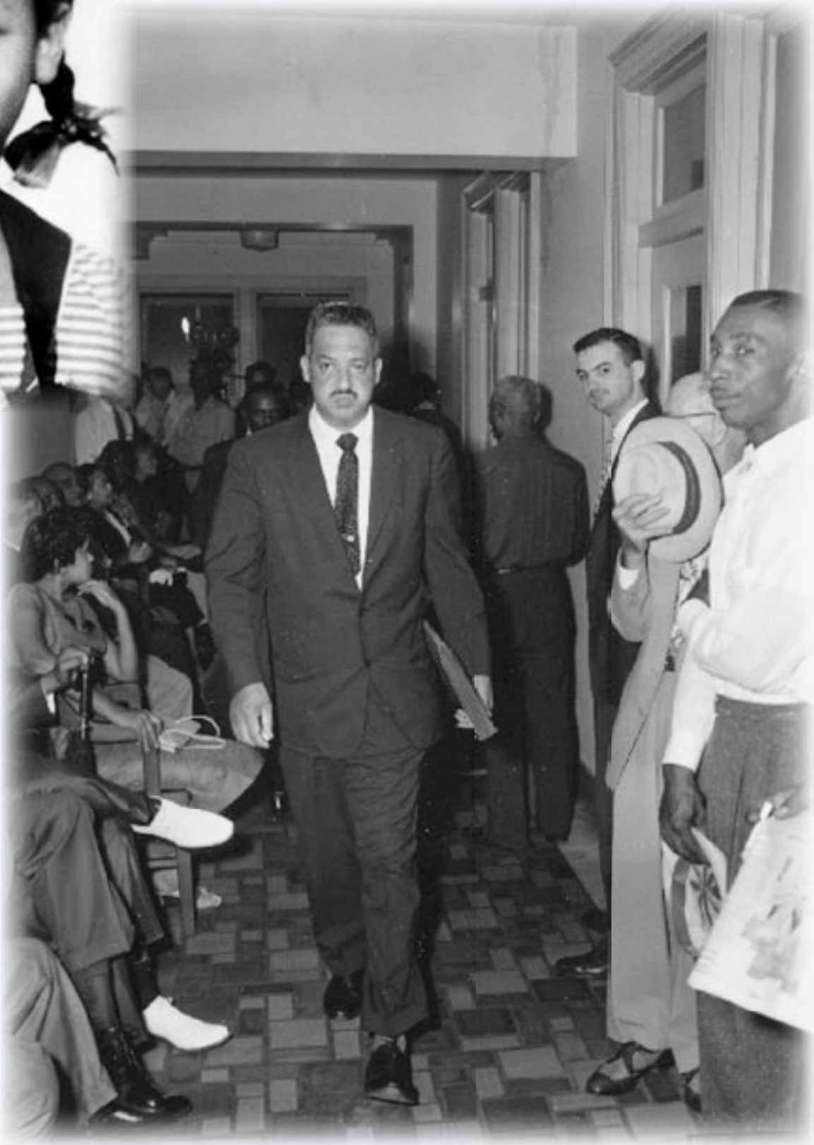
Thurgood Marshall llega a la Corte de Distrito de Estados Unidos en Little Rock, Arkansas, el 20 de septiembre de 1957. Su habilidad legal pudo lograr que el gobernador de Arkansas, Orval Faubus, retire la Guardia Nacional de la Escuela Superior Central e integre la escuela que previamente era solamente para blancos.