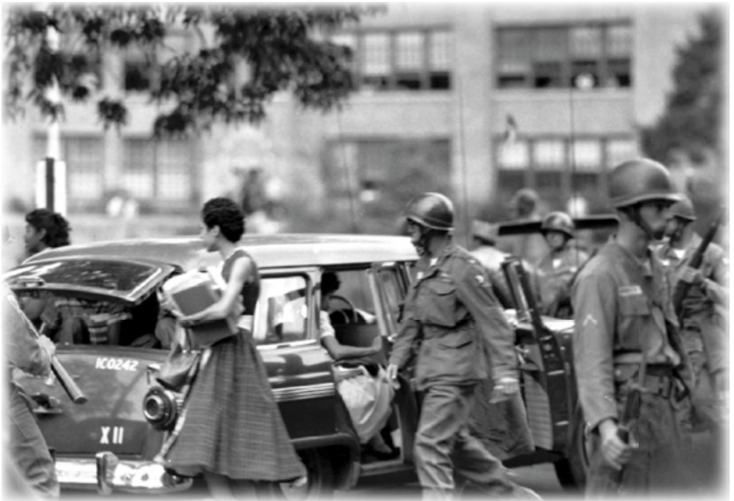
Las tropas federales escoltan a estudiantes negros que llegan a la Escuela Secundaria Central en Little Rock, Arkansas, en la primera semana de integración en septiembre de 1957. Marshall ganó el juicio que sirvió de precedente para que el gobierno federal desplegara tropas para proteger a los estudiantes negros de la violencia quienes protestaban y del llamado del gobernador de Arkansas a la Guardia Nacional para que impidiera la integración.

El Tribunal Supremo oyó argumentar en torno a “Brown” en dos ocasiones separadas. En la segunda, el 8 de diciembre de 1953, muchos comprendieron que se estaba escribiendo historia. Las colas para obtener uno de los 50 asientos reservados al público en general eran largas. Los afortunados oyeron al secretario adjunto de Justicia de Estados Unidos, J. Lee Rankin, plantear el apoyo del gobierno federal al argumento de los demandantes. Afirmó que los jueces del tribunal poseían “el poder y el deber” de dictaminar que la segregación violaba la Constitución. Los que estaban presentes oyeron también el poderoso resumen que hizo Thurgood Marshall. La cuestión, le dijo Marshall al tribunal, consistía en “si los derechos de estos estados [segregacionistas] han de prevalecer, o si ha de