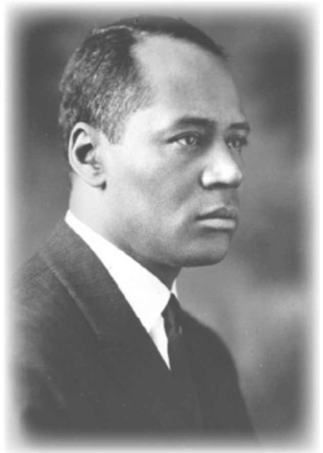
Charles Hamilton Houston, en una fotografía no fechada.

Houston nació en 1895 en la ciudad de Washington. Tenía sólo 19 años cuando se graduó en el Amherst College y fue a luchar en la Primera