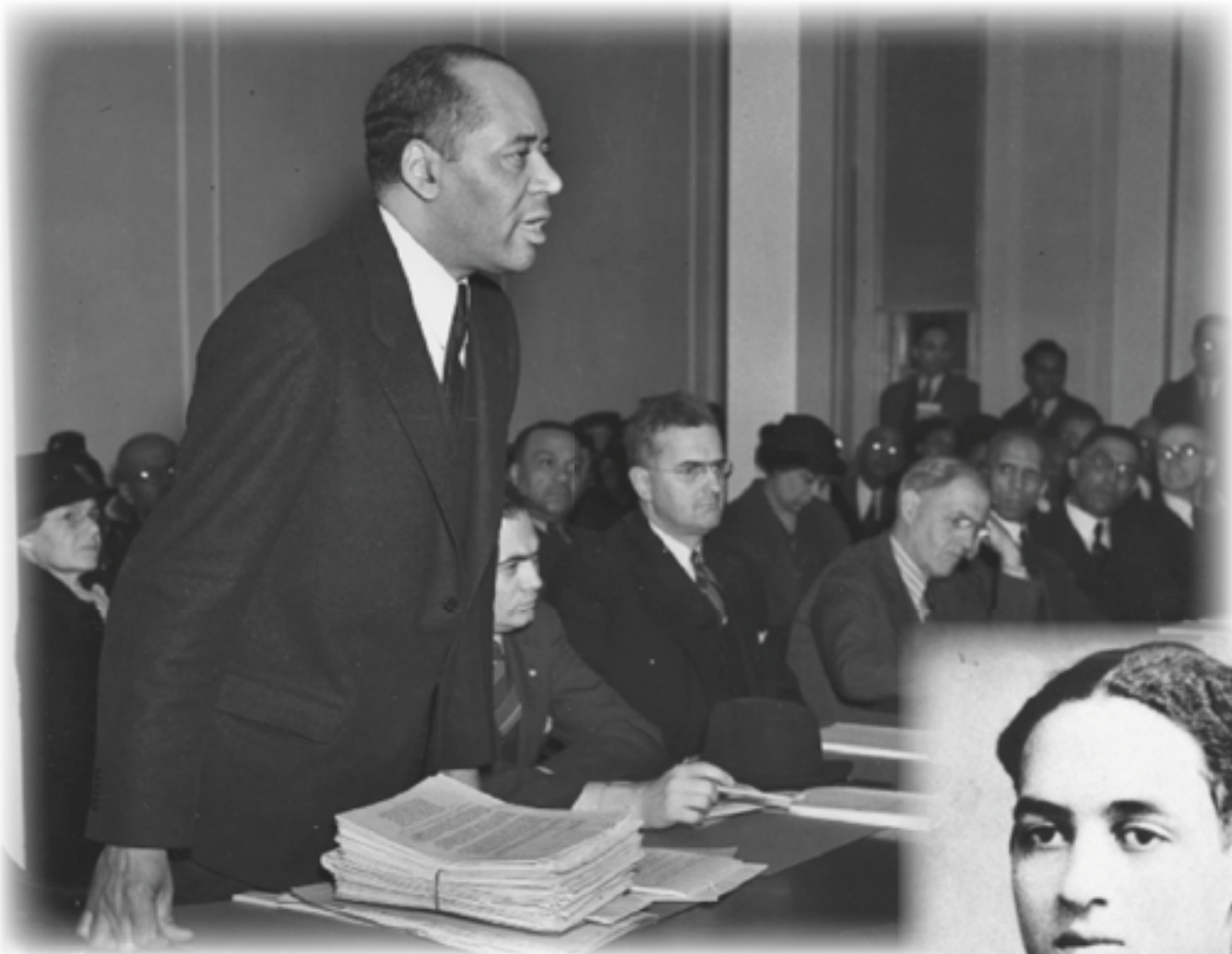
Charles Houston, mentor de Marshall, argumentó casos en la corte durante sus años como decano de la escuela de leyes de la Universidad Howard.

Houston y Marshall decidieron derrotar la decisión “Plessy” en los tribunales federales, demostrando que, en mundo real, lo separado no era nunca igual. Su