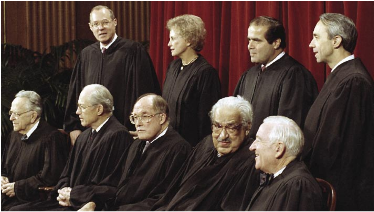
Los jueces del Tribunal Supremo en 1990: de pie: Anthony M. Kennedy, Sandra Day O'Connor, Antonin Scalia y David Souter. Sentados, desde la izquierda: Harry A. Blackmun, Byron R. White, el juez presidente William H. Rehnquist, Thurgood Marshall y John Paul Stevens.

acusaciones federales referentes a los derechos civiles.