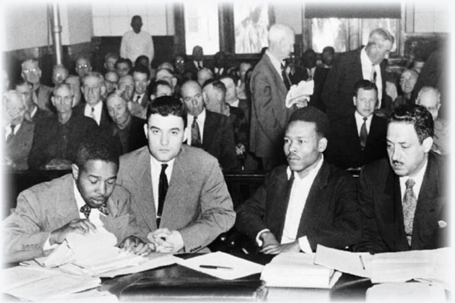
Jack Greenberg, segundo de la izquierda y Thurgood Marshall, fondo a la derecha, consejero titular de la Asociación Nacional para el Progreso de las Personas de Color (NAACP), argumentan un caso en Florida, el año 1952.