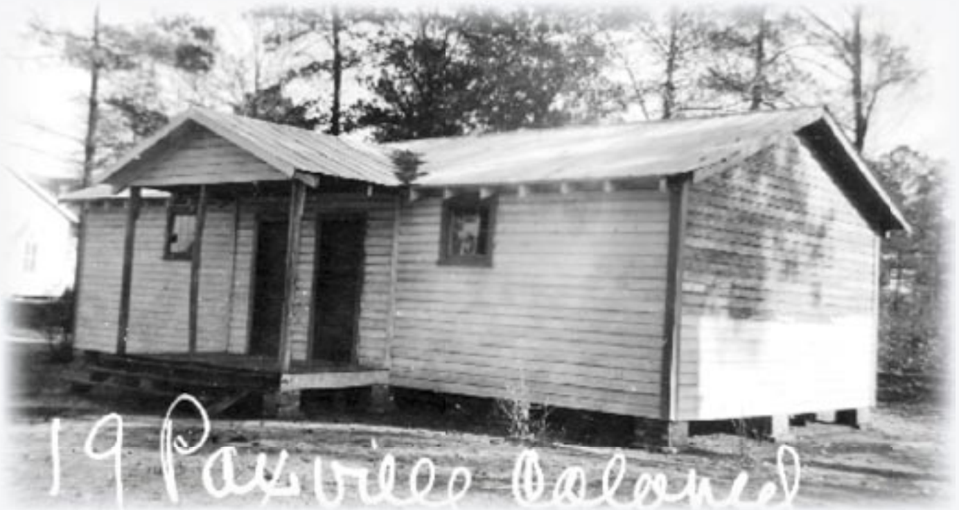
Las escuelas para "Blancos" (encima) y de "De color" (arriba) en Paxville, Carolina del Sur (1935-1950) donde con frecuencia, como en otros estados del Sur las escuelas para "blancos" recibían dos o tres veces más del dinero que las escuelas para afroamericanos.