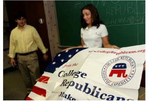
West Virginia Üniversitesindeki öğrenciler Kolej Cumhuriyetçileri posterini açıyorlar, Morgantown.