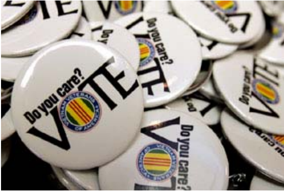
Duayenleri oy kullanmaya çağıran butonlar Tennessee'deki Vietnam Duayenleri Amerika liderliği konferansında sergileniyor.

Daha da önemlisi, halk arasında orta sınıfın artık ulusal refahı paylaşamayacağına, yerini kaybedeceğine ve birkaç elit kesimin devasa kârlardan yararlanacağına dair giderek artan bir düşünce vardır. Seçimden sonra seçmenlerle yapılan anketler, seçmenlerin 21. yüzyılda Amerikan Rüyası'na olan inançlarını kaybetmeye başladıklarını göstermektedir. Seçmenlerin yarısı ancak geçecek kadar para kazandıklarını, yüzde 17'si ise durumlarının giderek kötüleştiğini belirtmiştir. Seçmenlerin üçte birden az kısmı (yüzde 31) ise mali açıdan durumlarının iyiye gittiğini belirtmiştir. Amerikan halkının çocuklarının geleceği konusunda büyük ölçüde endişeye kapılmaları ise daha korkutucudur. Yüzde 40'ı oluşturan bir yoğunluk gelecek nesil Amerikan halkının hayatının bugünkünden daha kötü, yüzde 28'i her şeyin aynı ve yalnızca yüzde 30'u gelecek nesil Amerikan halkının hayatının bugünkünden iyi olacağını düşünmektedir. 2008 yılında, Amerikalı seçmenler oylarını Amerikan Rüyası vaadini yerine getireceğine, yani çalışanlara çocuklarına daha iyi fırsatlar sunmalarını sağlayacak paylaşılan ekonomik refahı ve fırsatı sunacağına en çok inandıkları adaya vereceklerdir.