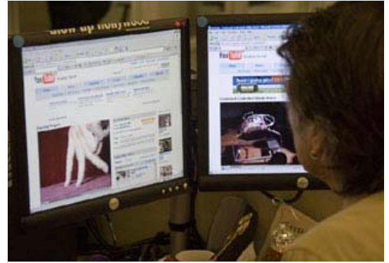
İnternet üstünde bir video paylaşım servisi olan YouTube, Amerika Birleşik Devletleri’ndeki siyasette rol oynuyor.

Diğer netroot kampanyaları Dean kampanyasından önce başlamıştır ve bugüne kadar devam etmektedir. Sözgelimi, San Francisco bölgesindeki yazılım şirketinin kurucuları 1997 yılında dostlarına ve iş arkadaşlarına e-postalar