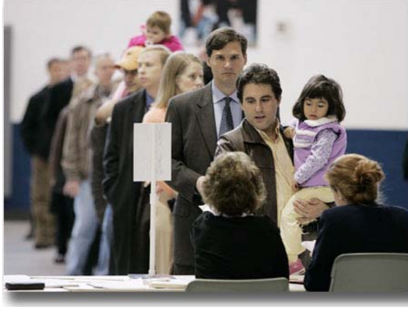
2006 ara seçiminde, seçmenler oy kullanmak için sırada bekliyor, Alexandria, Virginia, 7 Kasım Salı, 2006.