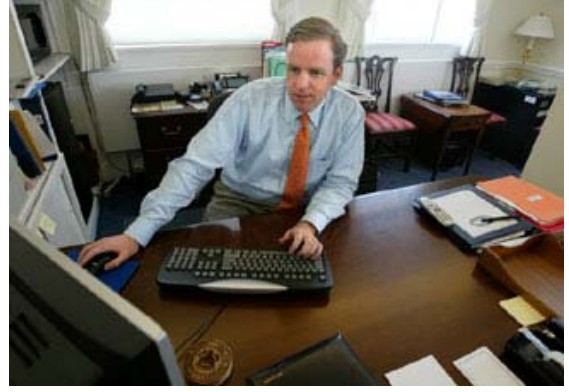
2003 yılında, zamanın Beyaz Saray İletişim Müdürü Dan Bartlett, Beyaz Saray'dan doğrudan ABD vatandaşlarına bağlanılarak yapılan canlı bir sohbet.

Özetle, 2008 yılı Seçim Kampanyası henüz bir sonuca bağlanmamış olsa da, kesin olan bir şey vardır. İnternet, adaylarla ABD seçmenlerinin birbirleriyle etkileşimini sonsuza dek değiştirmiştir. En başarılı bir veya iki adaydan daha fazlası kaynak sağlama konusunda başarılı olabilir ve adaylar halkın kendilerine verecekleri mesajları kontrol edemezler. Halk sesini duyurmak için Web 2.0 araçlarını benimsemiştir; artık bütün mesele adayların halkı ne kadar iyi dinlediğidir.