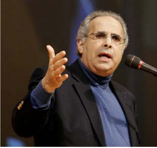
Uluslararası anketör John Zogby Oklahoma City, Oklahoma'da bir kitleye seslenirken 2008 seçimlerinde İspanyol seçmenlerin giderek artan önemine değiniyor.

1960'lı yıllarda, Gallup ve Harris anket kuruluşları vardı. 1970'lerden itibaren önemli televizyon ağları büyük gazetelerle bir ekip oluşturdular. 1992'ye geldiğimizde, hâlâ az sayıda büyük anketler vardı. Medya ve bağımsız anketlerin düşünme şekli açıktı. Onlar, halkı ve katkıda bulunabilecek kişileri yanlış yönlendirmek için sadece sahte anketler düzenleyerek daha iyi olduklarını iddia edebilecek adaylara göz yumarak istismara karşı bir kontrol mekanizması olmuşlar ve güvenilir, bağımsız kaynaklardan elde ettikleri araştırma sonuçlarıyla bir kamu kaydı oluşturmuşlardır.