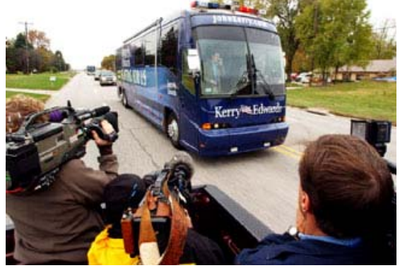
Bir televizyon kameramanı Ekim 2004'te Iowa, Davenport'a gelen bir kampanya otobüsünü filme alıyor.

Başucu kitabı, herkesin günlük programını yapmasını sağlayan kampanya personeli tarafından büyük bir titizlikle ve ayrıntılı bir şekilde derlenmiş bir belgedir. Her muhabirin kendine göre farklı öncelikleri ve projeleri vardır. Hangi olay günün büyük olayı olacak gibi, güne damgasını vuracak olayın olası kaynağı nedir? Hikâyeleri yazıp göndermek için gerekli süre programda ve doğru noktalarda belirtilmiş mi? Bulduğumuz yerler ve çalıştığımız kurumun kendi üretim programları dolayısıyla, çoğumuzun farklı son teslim süreleri vardır. Atlayabileceğim, dolayısıyla adayın personelinden biriyle üstünde çalıştığım haber analizi hakkında konuşabileceğim bir haber var mı?