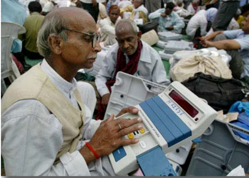
Hindistan'da, bir oy kullanma memuru Mayıs 2007 seçiminden önce elektronik oy kullanma makinelerini kontrol ediyor.