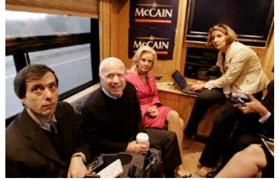
Senatör John McCain başkanlığa aday olduğunu ilan ettikten sonra eşi ve personeliyle birlikte kampanya otobüsünde New Hampshire eyaletindeki Portsmouth'dan Concord'a gidiyor, Nisan 2007.

1998 yılında Washington Post'ta çalışıyor ve o zaman Senatör olan Al Gore'un Süper Salı olarak bilinen ön seçimde haberini yapıyordum; Süper Salı'da birkaç güney eyaleti, bölgenin başkanlık adaylığında etkisini arttırmak amacıyla ön seçimlerini aynı gün yapıyordu.. (Al Gore güneyde iyi sonuçlar aldı; ancak kuzey eyaletlerinde buna müteakip yapılan seçimlerin kaynakları kendisinde yoktu.) Gore doğduğu eyalet olan Tennessee'deki bir hastanede durdu; hastanede son teknolojiyle donatılmış bir çocuk bölümü vardı. Orada zamanın Arkansas Valisi Bill Clinton tarafından karşılandık, ben de Clinton'la röportaj yapmak için hastane gezisine katılmamaya karar verdim. Daha önceki konuşmalarda, kendisinin mükemmel ve erişilebilir bir siyasi analizci olduğunu öğrenmiştim; görüşmemiz de son derece iyi geçti. Orta Batı'da rakip olmayan bir gazetede çalışan bir meslektaşımınla anlaşarak ona Clinton'la olan haberimle ilgili bilgi verdim; karşılığında o da bana hastane turuyla ilgili bilgi sundu.