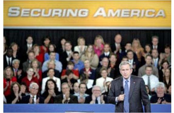
Başkan Bush, Florida'daki Tampa limanında dünya çapında teröre karşı açılan savaşla ilgili konuşuyor, Şubat 2006.

Ayrıca, küreselleşme ABD çalışanlarını diğer ülkelerdeki temel haklarını koruyamayan düşük maaşlı çalışanlara karşı rekabet etmeye ittiğinden, seçmenler artık küreselleşmenin yararlarından da şüphe etmeye başlamıştır.