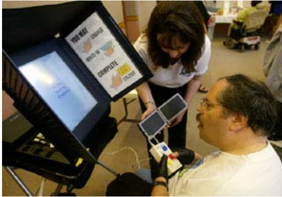
Help America Vote Act'ın isteği üzerine (Amerika Oy Kullanma Eylemine Yardım Et), yeni teknoloji artık engelli seçmenlerin de oy kullanabilmesini sağlıyor.