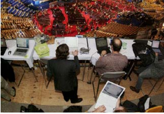
Demokratik Ulusal Kongre'deki yaygın yayın ve yazılı medya yazarlarının yanında blog'cular için özel bir bölüm hazırlanmıştır. "Blog'cunun Bulvarı", 2004 yılında, Boston (Massachusetts)'da ulusal siyasi kongreyi ilk kez canlı yayında haber yapmıştır.

göndermeye başlamışlardır; bu e-postalarda arkadaşlarından seçilmiş yetkililerini zamanın Başkanı Bill Clinton'a karşı yapılan suçlama sürecini bitirmeye ve diğer politika meselelerine "geçmelerini" çağrılarını istemişlerdir. E-posta kampanyası öyle büyük yankı uyandırmıştır ki, bu kurucuların dostları ve iş arkadaşları bu e-postaları diğer insanlara göndermeye başlamışlardır. Zamanla, bu küçük kampanya süregelen davalara, özellikle Irak'taki savaşı bitirmeye odaklanan sürekli bir halk politikası organizasyonu haline gelmiştir. MoveOn.org, e-posta tabanlı siyasi kampanyalarında yer alan milyonlarca İnternet kullanıcısıyla şimdi Amerika'daki en güçlü siyasi eylem komitelerinden biridir.