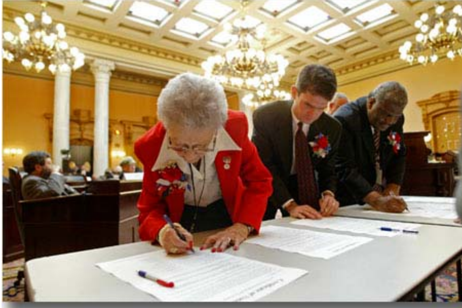
Ohio Kolombus'taki Eyalet Meclisinde, Ohio seçici kurulu heyeti oy kullanıyor, Aralık 2004.