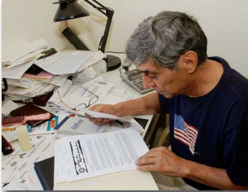
Bu siyasi aktivist Güney Amerika seçmen kaydına para akıtmayı umuyor ve insanları oy kullanmaya teşvik ediyor, Colorado.