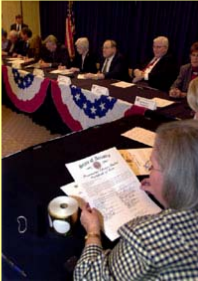
Arizona'da, Phoenix'teki eyalet meclisindeki bir tören sırasında, seçmenlerin oy pusulalarına resmi eyalet mührü basılmaktadır.

Amerikan federalizminin önemli özelliklerinden biri, başkanın seçiminde eyalet olarak 50 eyaletin yer almasıdır. Bu sistem – Seçici Kurul – her eyalete belirli sayıda seçmen oyu verir; bu oyların sayısı eyaletin ABD Senatosu ile ABD Temsilciler Meclisindeki üyelerinin toplam sayısına eşittir. Eyaletler, Senato ile Temsilciler Meclisindeki sandalyelerini nüfuslarına orantılı olarak alırlar. Seçici oyları bütün seçici oyların (hali hazırda 538'de 270) çoğunluğunu oluşturan bir dizi eyaletteki çoğunluk oyunu kazanabilen başkan adayı, başkan olur. Bu sistemi eleştirenler, doğrudan seçimdeki sadeliği argüman olarak sunuyor. Her bir eyaletteki oy toplamlarını göz ardı edip sadece ulus çapındaki oyları sayarak bir kazanan belirleyemezsiniz. Amerika Birleşik Devletleri böyle bir sistemi benimsemiş olsaydı, adaylar yalnızca en kalabalık eyaletlerde kampanya çalışması yürütme ve bu yerlerdeki en fazla oy sayısını almaya çalışıp nüfusu da az olan eyaletleri göz ardı etme eğiliminde olurlardı.