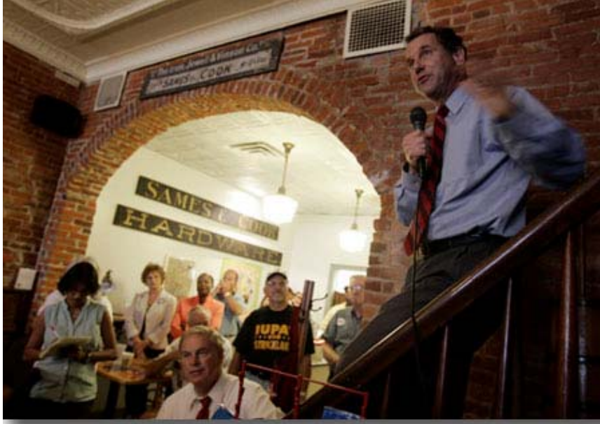
Mount Gilead Ohio'da seçim kampanyasını sürdüren Senato adayı Sharrod Brown, bir kahve evinde seçmenlere seslenirken, Ağustos 2006.

ABD'de federal büro için seçim kampanyasına katılmak, adayların kampanyalarını finanse etmesi için büyük miktarda para kaynağı sağlamasını gerektiriyor; bu paranın sağlanması ve harcanması ise ABD hükümeti tarafından ciddi biçimde düzenleniyor. Seçim hukuku uzmanı Jan Witold Baran bu yazısında şahısların ve kurumların kampanyaya katkıda bulunmaları konusundaki yasal sınırlamaları açıklamakta ve kampanyaların harcamaları nasıl belirlendiğine ve başkanlık seçimlerinin özel ve genel olarak finanse edilmesine değinmektedir. Baran, Washington DC'de bulunan Wiley Rein LLP hukuk bürosunun ortağı, aynı zamanda Fox News, National Public Radio ve ABC News'in yorumcusu ve yasal analizcisidir.