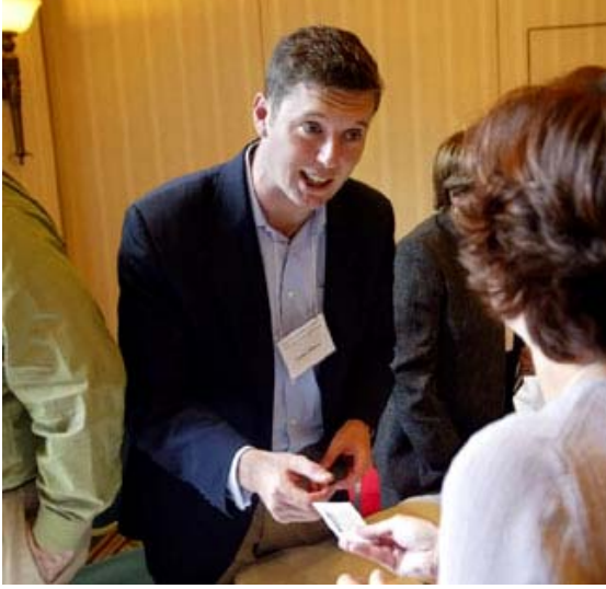
Irak savaşı konusunda uzman olan Patrick Murphy 2006 ara dönem seçimlerinde kongrede bir sandalye kazanmak için kampanya çalışmalarını sürdürüyor, Philadelphia, Pennsylvania.

2006 kongre seçimlerinin ardından, bölünmüş hükümet Washington'a damgasını vurmuştur; Temsilciler Meclisi ve yasama kanadına Cumhuriyetçiler, Senato'daki keskin bir ayrıma rağmen Kongre'nin her iki kanadına ise Demokratlar hâkim olmuştur.