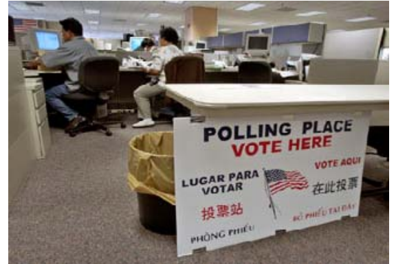
California, San Jose’de oy pusulaları federal Oy Kullanma Hakları yasasına uygun olarak İngilizce, İspanyolca, Çince ve Vietnam dilinde sunulmaktadır.

Belki de seçim yetkililerinin karşılaştığı en büyük güçlük, oy pusulası çalışanlarıyla seçmenleri yeni oy kullanma teknolojileri konusunda eğitme sürecidir. Oy pusulası çalışanlarının ortalama yaşının 72 olduğu ABD’de, kontrol edilip taşınması gereken bilgisayar hafıza kartlarına sahip elektronik cihazların devreye girmesi, ulusal bir seçimin