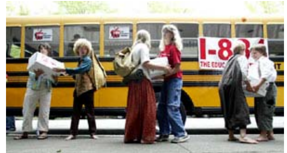
On iki yaşındaki öğrenciler okul servislerine dilekçelerle dolu kutular yüklüyorlar. Seçimde Seattle, Washington’daki eğitim için ek kaynak sağlayan bir referandum kazanmak istiyorlar.

Genellikle, kadınların Sosyal Güvenlik, sağlık ve eğitim gibi daha çok “KADIN” meselelerine, erkeklerin ise savaş ve ekonomi gibi “BİZ” meselelerine eğildiği düşünülmektedir. Son üç ulusal seçim (2002, 2004 ve 2006) bu geleneksel düşüncelerin artık geçerli olmadığını göstermektedir. 2004 yılında ve yine 2006’da, kadınlar anketörlere oy kullanıp kullanmamak veya kime oy verecekleri konusunda kendilerini motive eden konuların aslında geleneksel olmayan “kadın meseleleri” olduğunu söylemişlerdir. İçinde 10 seçeneğin sunulduğu kapalı uçlu bir sorudan, Irak’taki durum motive edici sorun olarak listenin en başında gelmiş (yüzde 22), bunu terörle mücadele takip etmiştir (yüzde 15). Ahlak/aile değerleri ile iş/ekonomi meselelerinin her biri yüzde 11 oran almış, kalan diğer altı seçenek Tablo 2’de görüldüğü gibi yalnızca tek haneli cevaplar almıştır.