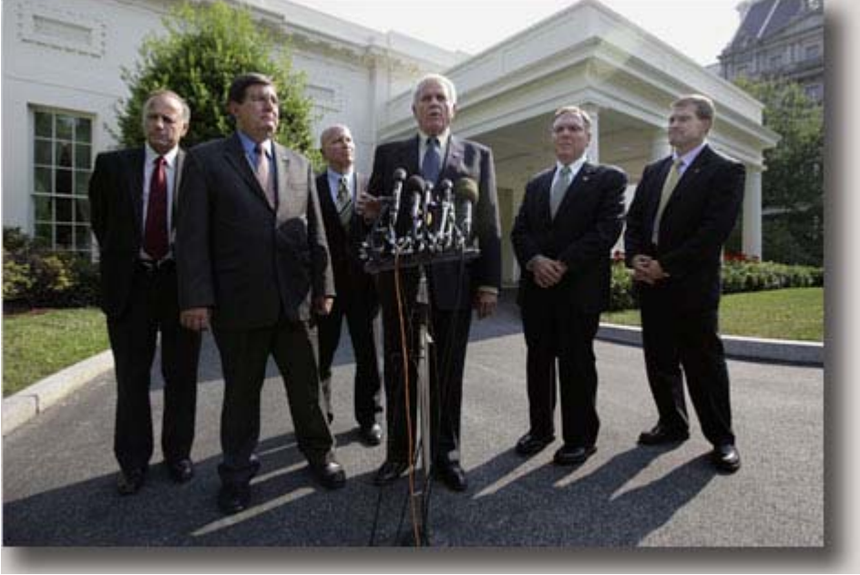
Kongre üyeleri Temmuz 2006'da Irak'tan dönmelerinin hemen ardından Beyaz Saray'da Başkan Bush ile yaptıkları toplantıdan sonra muhabirlerle konuşuyor.