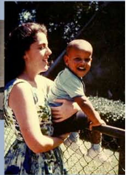
باراك الفتى مع أمه آن دونهام، حوالي سنة 1963.