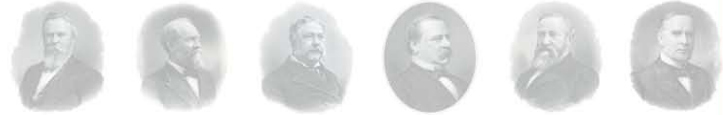
رذرفورد هيز جيمس غارفيلد تشنستر آرثر غروفير كليفلاند بنجامين هاريسون وليام ماكينلي