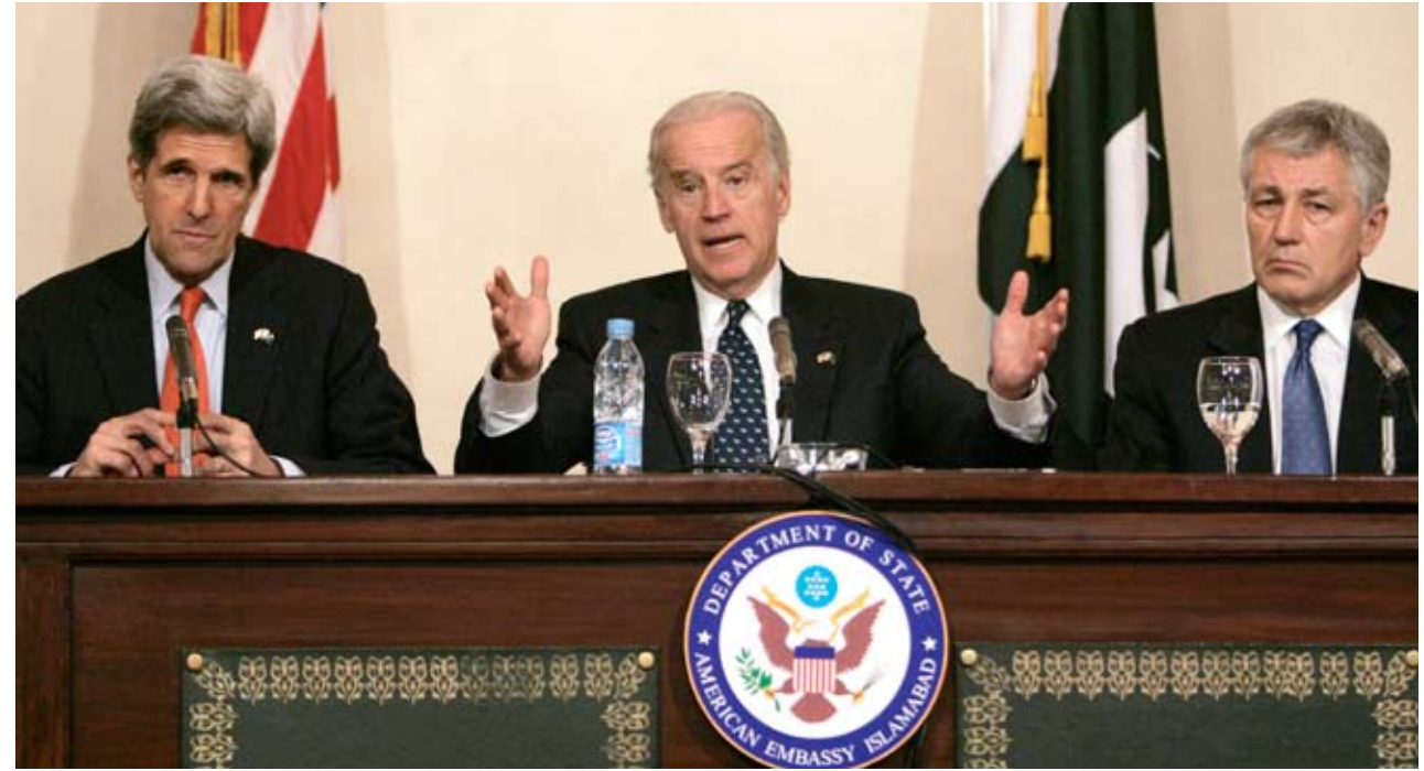
أعضاء مجلس الشيوخ، من اليسار: جون كيري، جوزيف بايدن وتشارلز هيغل في إسلام اباد، باكستان، شباط/فبراير، 2008.

إلى معظم المراقبين، كان الجهد الذي بذله لمحاربة الأعمال العدائية في منطقة البلقان خلال تسعينات القرن الماضي. وُصف بايدن بأنه كان صوتاً مؤثراً في حث إدارة كلينتون على اتخاذ إجراءات ضد الزعيم الصربي سلوبودان ميلوسوفيتش. خلال ظهورهما معاً في سبرينغفيلد، قال أوباما إن بايدن "ساعد في تصميم سياسات تؤدي إلى إنهاء عمليات القتل الجارية في البلقان". وعلى وجه الخصوص، حث بايدن على التدخل لوقف عمليات التطهير الاثني ضد المسلمين في البوسنة. ولاحقاً، دعم حملة حلف الناتو في القصف الجوي لإجبار صربيا على الانسحاب من كوسوفو.