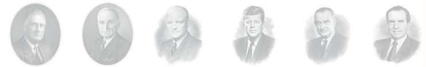
فرانكلين روزفلت هاري ترومان دوايت آيزنهاور جون كينيدي ليندون جونسون ريتشارد نيكسون