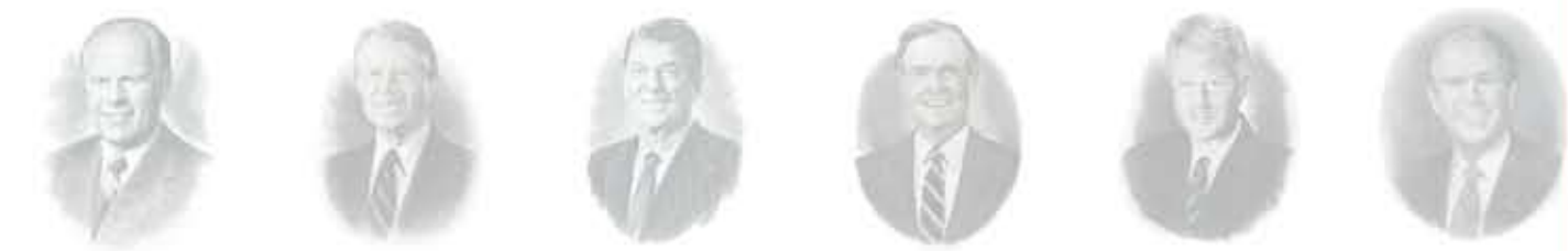
جيرالد فوردي جيمي كارتر رونالد ريغان جورج هربرت بوش وليام كلينتون جورج ووكر بوش