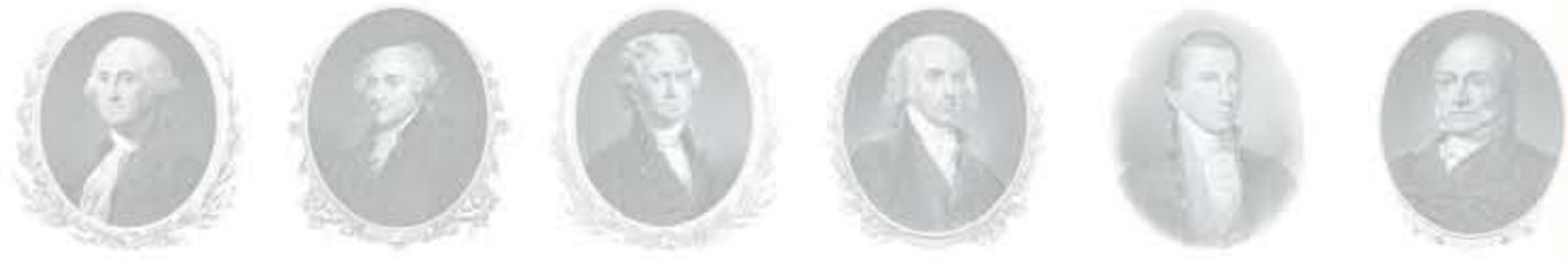
جورج واشنطن جون آدمز توماس جيفرسون جيمس ماديسون جيمس مونرو جون كوينسي آدمز