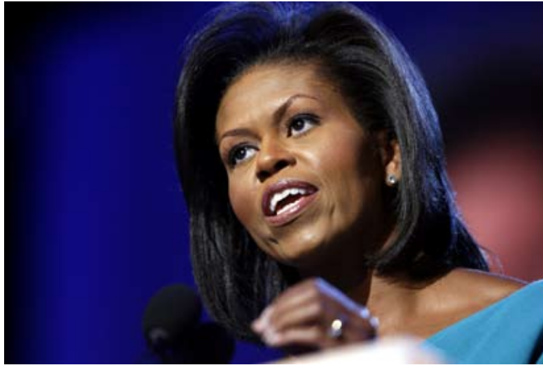
ميشيل أوباما تتحدث في المؤتمر القومي للحزب الديمقراطي في 25 آب/أغسطس، 2008. أسفل: سافرت عائلة أوباما سوياً خلال مراحل كثيرة من الحملة الرئاسية.

يأمل أوباما وزوجته أن يساعد حماسهما للخدمة العامة، وخبرتهما المهنية الواسعة، وإنجازتهما في التعامل مع التحديات المستقبلية. وراء رغبة باراك في أن يصبح رئيساً للبلاد وأن يكون له تأثير إيجابي على العالم ابتداءً من الآن، ولدت سنة 1998، وساشا (مختصر اسم ناتاشا)، وقد ولدت سنة 2001. والفتاتان ستكونان أصغر سكان البيت الأبيض سناً بعد آيمي كارتر التي كانت في التاسعة عندما انتخب