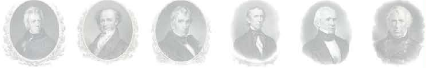
أندرو جاكسون مارتن فان بيورن وليام هنري هاريسون جون تايلر جيمس بوك زكاري تيلور