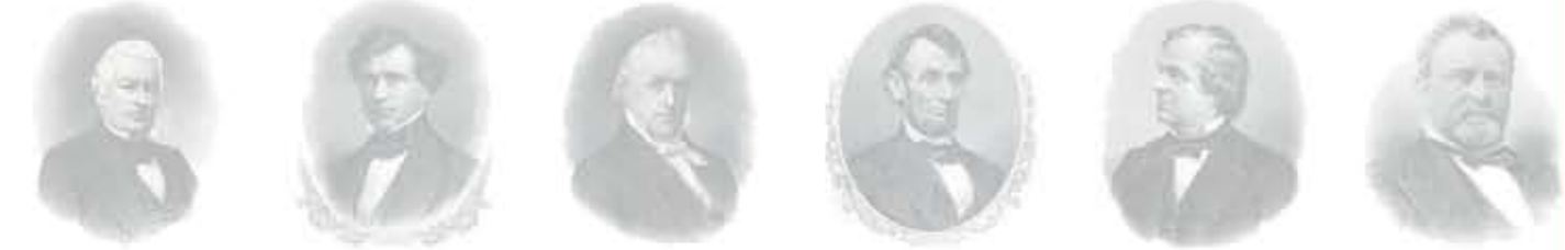
ميلارد فيلمور فرانكلين بيرس جيمس بيوكانان أبراهام لنكولن أندرو جونسون بوليسيس غرانت