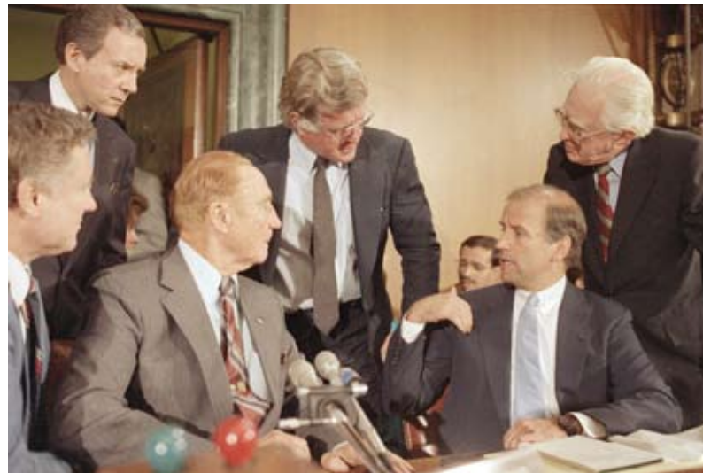
السناتور بايدن جالساً إلى اليمين مع زملائه أعضاء اللجنة القضائية في مجلس الشيوخ، آب/أغسطس، 1986.

لكن قبل التصويت على القرار النهائي، عمل بايدن مع السناتور الجمهوري ريتشارد لوغار من ولاية إنديانا، لإصدار قرار لا يجيز القيام بعملية عسكرية إلا بعد استئذاف الجهود الدبلوماسية. صوّت بايدن لصالح إجازة الحرب بعد أن رُفض هذا القرار. ولكنه صوّت أيضاً ضد إدخال تعديل كان سيفرض بموجبه على إدارة بوش أن تسعى للحصول