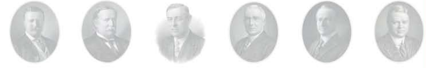
ثيودور روزفلت وليام تاфт وودرو ويلسون كاليفن كوليدج كاليفن كوليدج هربرت هوفر