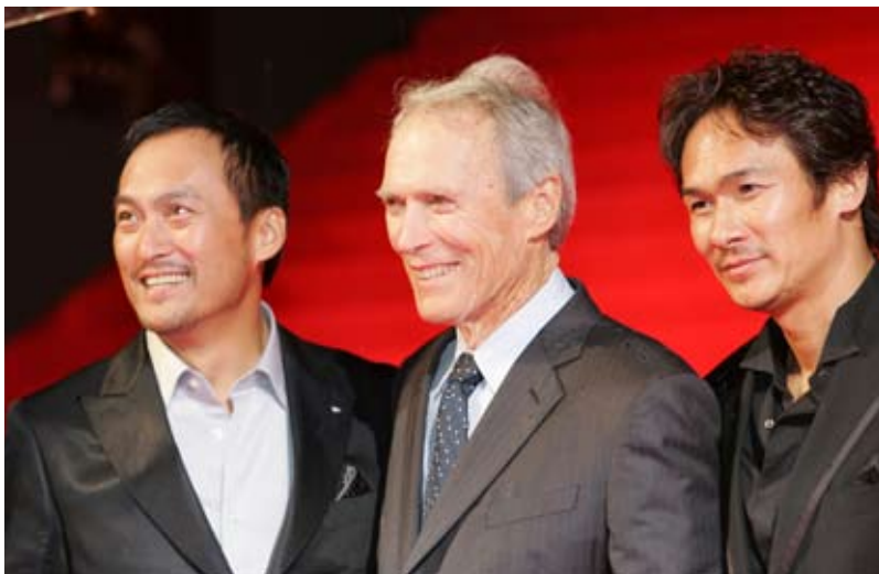
Режиссер Клинт Иствуд с японскими актерами Кеном Ватанабе (слева) и Цуеси Ихарой на премьере фильма «Письма с Иводзимы» в Токио.

аудиторией, для которой Вторая мировая война священна, и недопустимо оценивать ее как тщетную попытку или трактовать с позиций нравственной равнозначности. Это славное прошлое, которое воспевается.