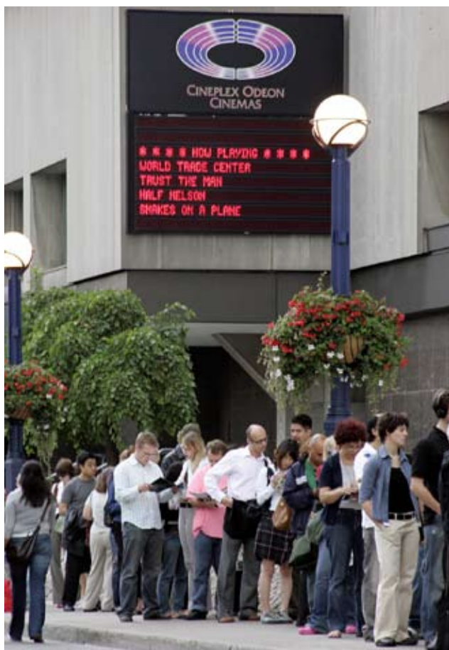
Очереди на просмотр фильмов кинофестиваля в Торонто.

ность лучше узнать собственную культуру и познакомиться с другими культурами посредством кино, современные фестивали часто служат каналами, по которым передается представление о культурах, находящихся за пределами американского национального кино и Голливуда. Так они становятся барометрами внимания мировой критики и в то же время часто обеспечивают финансирование и прокат малобюджетным творческим работам.