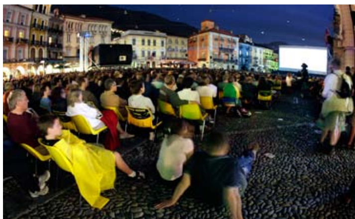
Международная аудитория собирается на кинофестивале в швейцарском Локарно.

Послевоенные тенденции в глобальной экспансии голливудского рынка и вследствие этого распространение и популярность международного кино в Америке сегодня имеют специфические экономические и технологические причины и обрели новые очертания. Пожалуй, важнее всего то, что современные международные кинофестивали, переживающие настоящий бум, стали одним из самых эффективных способов рекламы и поддержки иностранных фильмов на международном