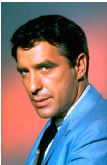
Актер и кинорежиссер Джон Кассаветес.

Альтернатива независимого кино, которая позволила американским зрителям увидеть такого рода фильмы на своем языке, не возникла из ничего. Недавно умерший актер и кино-