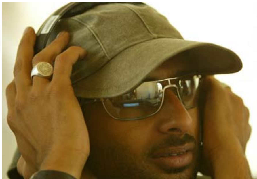
Предоставлено Бадром Бен Хирси и Комитетом распространения арабских фильмов