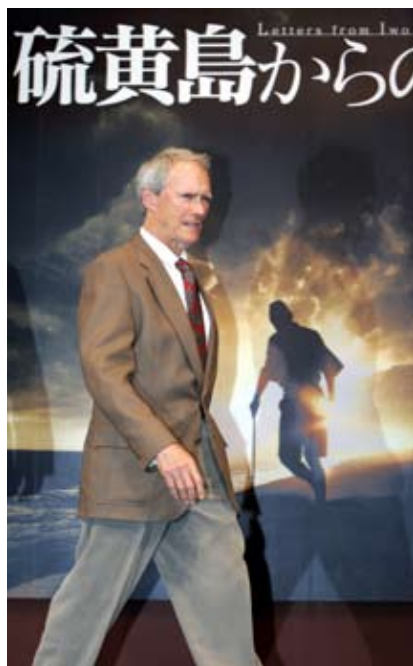
«Письма с Иводзимы» Клинта Иствуда не были включены в категорию фильмов на иностранном языке, хотя в нем звучит главным образом японская речь.

компании «Парамаунт» в 1948 году заложили основу, которая постепенно, но в корне изменила направление развития американской культуры фильмов и привела к формированию современной международной кинематографической сцены. Эти решения фактически