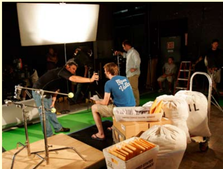
Этот фильм снимается при поддержке Комиссии по кино штата Техас.

Много лет назад правительство США выпустило несколько художественных фильмов и тесно сотрудничало с Голливудом в создании фильмов, которые поднимали дух народа в военное время. Однако, начиная со Второй мировой войны, эти программы были прекращены как по бюджетным, так и по принципиальным соображениям. Единственным исключением была работа, выполнявшаяся правительственными учреждениями, которые по определению имели дело с иностранной аудиторией. Например, Информационное агентство США в течение многих лет создавало фильмы для показа иностранной аудитории в дополнение к другим своим образовательным программам. Один из таких фильмов, «Джон Кеннеди: годы молний, день барабанов», посмертное посвящение убитому президенту, даже получил в 1965 году приз Академии за лучший документальный