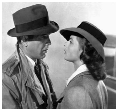
Сцена из классического фильма Майкла Кертица «Касабланка».

С усилением культурной экспансии Америки после Второй мировой войны судебные решения по делу