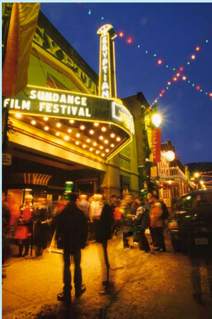
Поклонники кино собираются каждую зиму в Парк-Сити, штат Юта, на кинофестивале «Сандэнс».