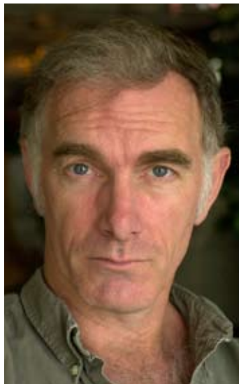
Сценарист и кинорежиссер Джон Сэйлз.

режиссер Джон Кассаветес (единственный кинорежиссер, который получил приз, названный в честь него самого, на церемонии присуждения наград «Независимый дух») снимал фильмы в стиле независимого кино еще в 1957 году, когда появилась его картина «Тени», ставшая впоследствии легендарной.