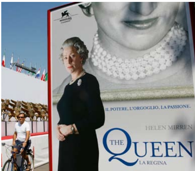
Лауреат премии Академии киноискусства Хелен Миррен на плакате фильма «Королева» на Венецианском кинофестивале.

« Флаги наших отцов » и « Письма с Иводзимы » Две картины Клинта Иствуда беспрецедентны в истории Голливуда. Обе они рассказывают об одних и тех же событиях с разных точек зрения, повествование ведется в них от лица противников. Эти два параллельно выпущенных фильма заняли одни из первых мест в списках «10 лучших фильмов», составленных по итогам года ведущими кинокритиками. Но ни тот, ни другой не был принят американской