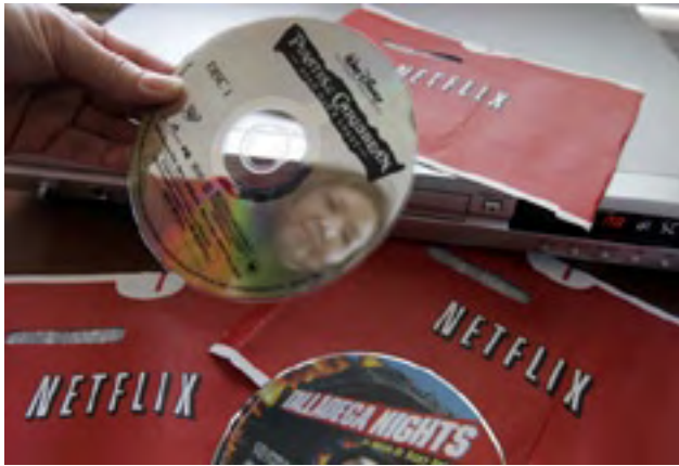
Netflix envoie des DVD par courrier, révolutionnant l'accès à la vidéo chez soi.

Ce n'est pas, et j'insiste sur ce point, que les films