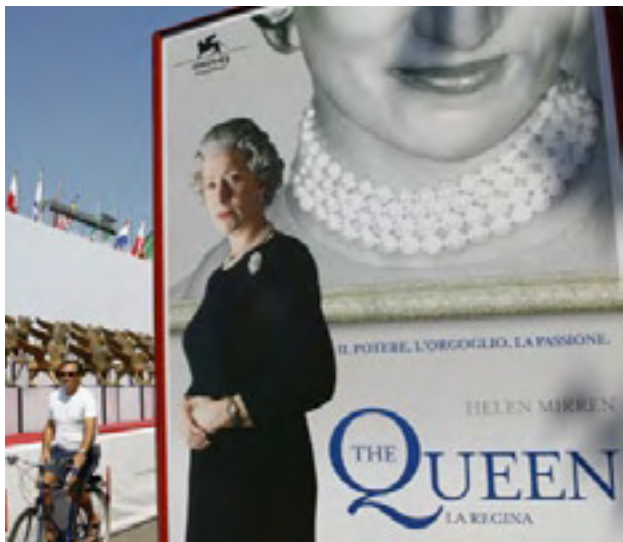
Helen Mirren, Oscar de la meilleure actrice, apparaît sur cette affiche de The Queen au festival du film de Venise.

Mémoires de nos pères et Lettres d'Iwo Jima – Le doublé ambitieux de Clint Eastwood a été un coup de dé sans précédent dans l'histoire de Hollywood : deux films