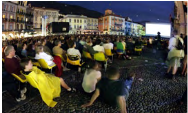
Un public international se rassemble pour le festival du film de Locarno (Suisse).

Le premier festival du film, celui, toujours influent, de Venise, s'est tenu pour la première fois en 1932 et aujourd'hui, de Cannes et Berlin à Toronto et Telluride