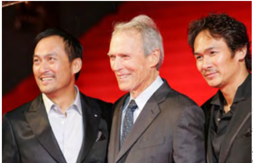
Le réalisateur Clint Eastwood est accompagné par les acteurs japonais Ken Watanabe (à gauche) et Tsuyoshi Ihara à la première mondiale, à Tokyo, du film Lettres d'Iwo Jima .

séparés racontant la même histoire de l'arrière de deux lignes ennemies différentes. Les deux films dont la sortie avait été étalée dans le temps se sont retrouvés très haut sur la liste des « 10 meilleurs films » établie par les critiques de films mais ils n'ont pas été suivis par le public américain pour lequel la seconde guerre mondiale est un moment sacré que l'on célèbre et jamais une vaine entreprise ou un événement à l'aune duquel on mesure ses qualités morales.