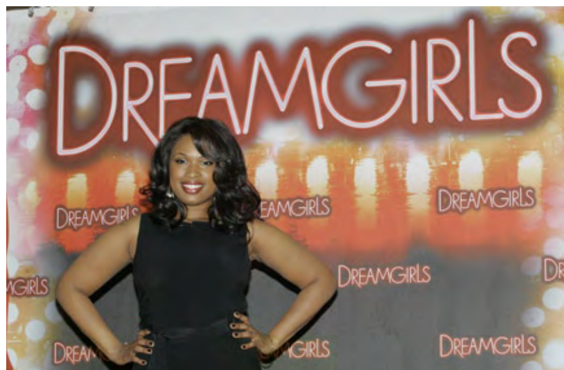
Jennifer Houston a obtenu un Oscar pour sa performance dans la comédie musicale Dreamgirls

Les Infiltrés – La dernière en date des études par Martin Scorsese du rituel des gangsters américains est un vrai métissage : c'est une nouvelle version pleine de bruit et de fureur de Infernal affairs , film criminel à suspense tourné à Hong Kong en 2002, interprété par des acteurs américains, filmé dans le Boston irlandais et débordant de l'adrénaline qui est la marque du réalisateur italo-américain depuis Mean Streets (1972). Avec en vedette deux enfants de Boston, Matt Damon et Mark Wahlberg, qui débitent avec leurs accents respectifs dans des décors authentiques (coup de chapeau à la vraisemblance qui