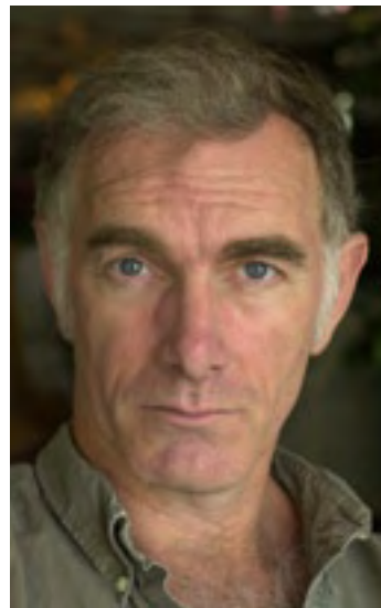
Le scénariste et réalisateur John Sayles.

leur propre langue n'est pas né du jour au lendemain. L'acteur et réalisateur John Cassavetes, aujourd'hui décédé, (le seul cinéaste en l'honneur duquel un prix des Independent Spirit Awards a été nommé) faisait déjà des films de style indépendant en 1957, date de réalisation du légendaire Shadows .