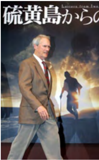
Les Lettres d'Iwo Jima , de Clint Eastwood, n'étaient pas inscrites dans la catégorie des films étrangers bien que le film soit pratiquement tout en japonais.