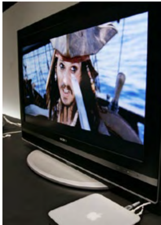
Le film Pirates des Caraïbes est diffusé sur un écran d'ordinateur.

L'Internet a ouvert la voie à un nouveau modèle de tournage et de distribution. La majorité des films sont créés et distribués par de grandes sociétés – des studios cinématographiques, des chaînes de télévision et de grandes sociétés de distribution. Mais, grâce à l'Internet, il est possible de produire un film destiné à un public restreint et de vendre des DVD (disques vidéo numériques) directement à ce public, sans passer par les structures de diffusion qui auraient probablement refusé ce projet en raison de son faible attrait auprès du grand public. Peter Broderick, expert de la distribution, note que Reversal , film dramatique sur le catch au lycée, n'a jamais été diffusé au cinéma ou à la télévision, ni même dans des magasins de vidéo, mais a généré plus d'un million de dollars de recettes en ventes de DVD et d'articles apparentés sur l'Internet. Dans The Long Tail: Why the Future of Business Is Selling Less of More , l'auteur, Chris Anderson, explique comment l'Internet permet aux