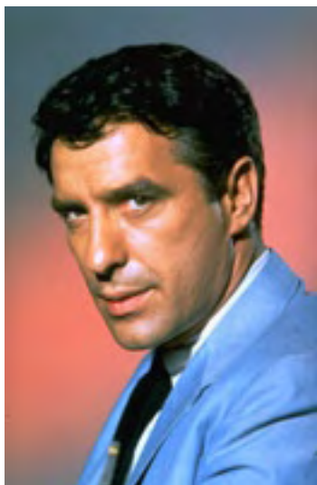
L'acteur et réalisateur John Cassavetes.

Le cinéma indépendant qui a permis aux spectateurs américains de voir ce genre de films dans