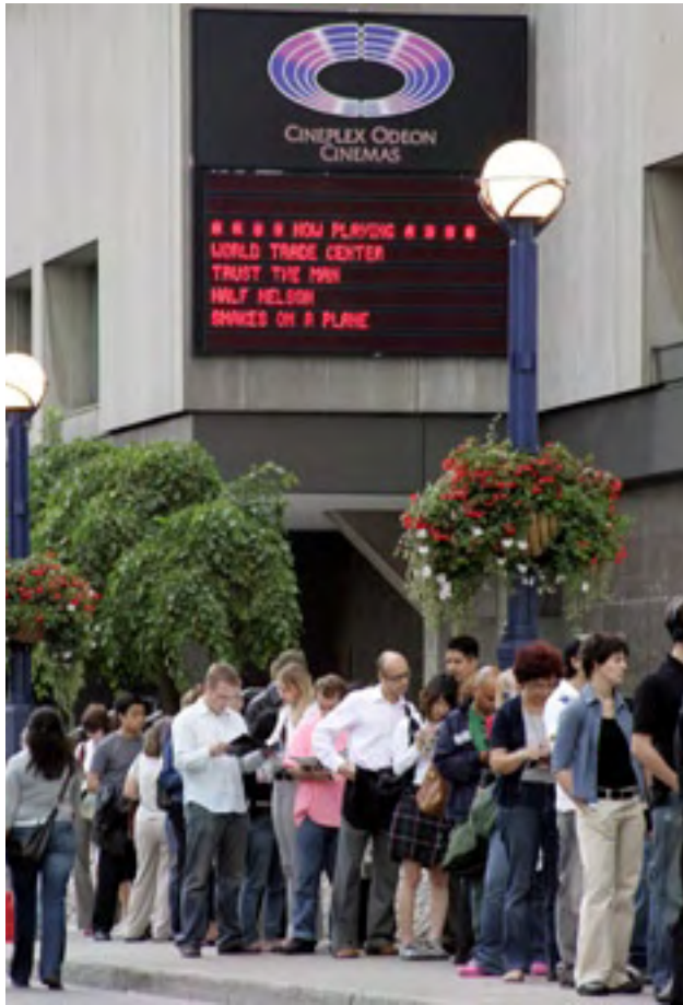
Des queues se forment au festival du film de Toronto.