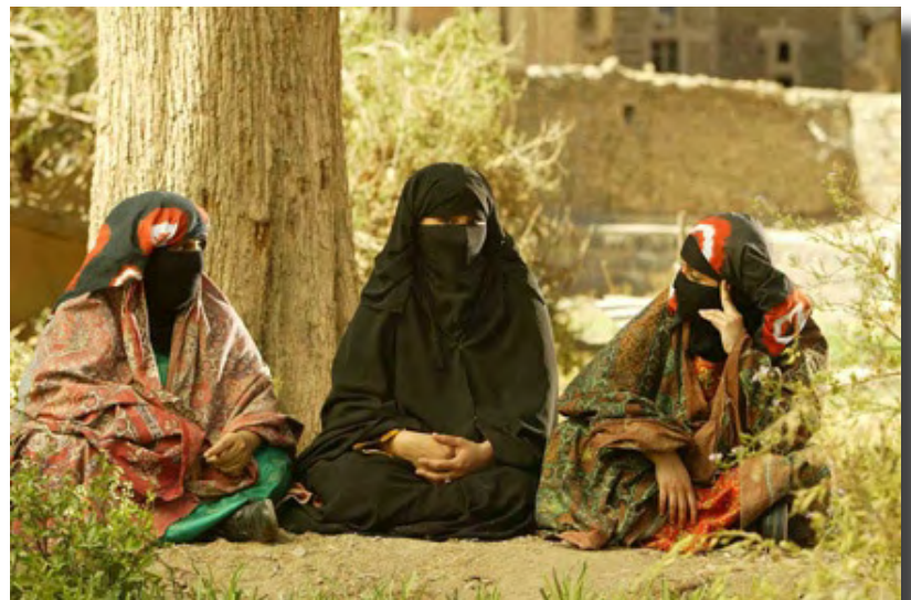
Une scène d'un des films de Ben Hirsi tourné au Yémen.

Ben Hirsi espère que son expérience de tournage de films au Moyen-Orient encouragera les autres cinéastes arabes, notamment ceux des pays plus conservateurs du Golfe qui n'ont pas de tradition cinématographique. Il a vu de nombreux jeunes réalisateurs formés en Europe ou en Amérique du Nord revenir dans leurs pays pour y tourner des films en dépit des difficultés. « Il y a une nouvelle vague du film arabe », a-t-il déclaré dans une interview sur le site Internet Netribution, « c'est un style nouveau et très excitant et les choses sont en train de changer ».