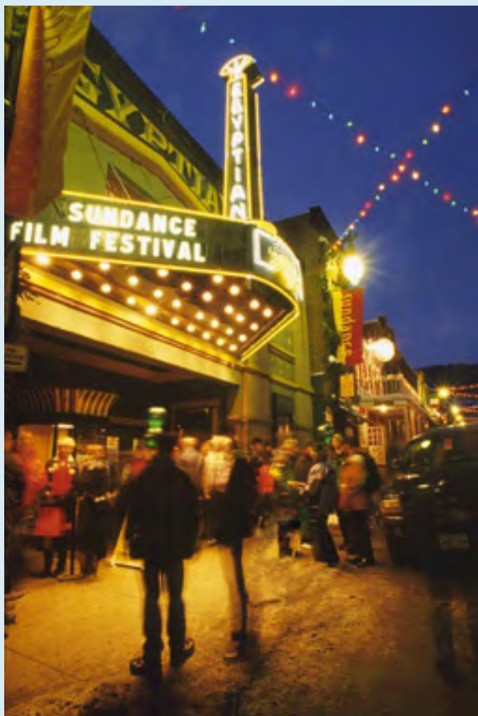
Des hordes de cinéphiles envahissent chaque hiver Park City (Utah) lors du Festival du film de Sundance.