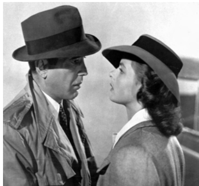
Une scène de Casablanca , classique de Michael Curtiz.

Avec l'expansion culturelle des États-Unis après la Deuxième guerre mondiale, les décrets de Paramount de 1948 ont posé les assises d'un mouvement qui