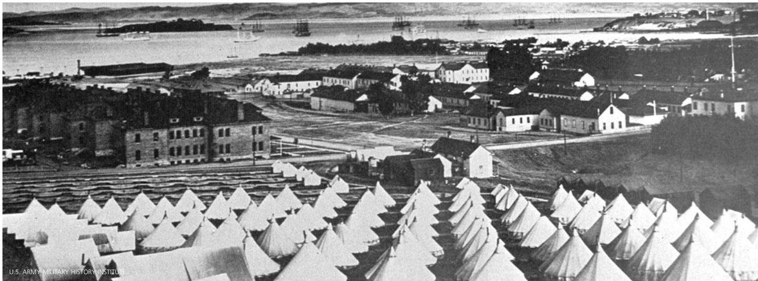
U.S. ARMY MILITARY HISTORY INSTITUTE