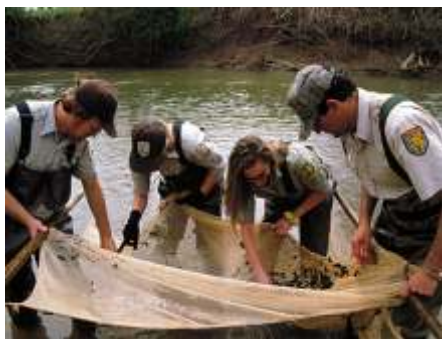
Hợp tác sẽ mang lại nhiều ích lợi cho mọi người

Các tiểu bang thường dùng những ngân khoản này để mua thêm đất đai cho