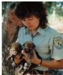
Chó sói đỏ con USFWS Ảnh chụp bởi: George Gentry