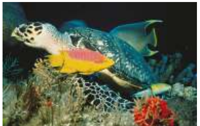
Rùa Biển Mỏ Ó USFWS Ảnh chụp bởi: Anja Burns

Công tác Bảo Tồn là cho Hôm Nay và Mai Sau USFWS Ảnh chụp bởi: Carl Zitzmann