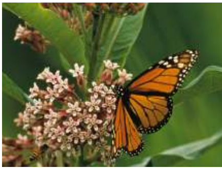
Bướm Chúa trên Hoa Sữa rừng, Edwin B. Forsythe NWR USFWS

Vào những năm gần đây, Cơ Quan luôn có một danh sách gần 2,000 loài đang đợi để được gia nhập vào chương trình này.