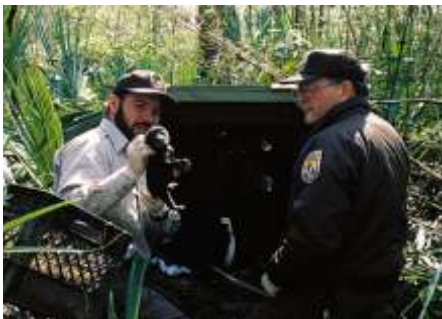
Nghiên cứu về Gấu Đen Louisiana USFWS

để cùng làm việc với một mục đích là bảo đảm thế hệ tương lai của Hoa Kỳ sẽ được tận hưởng những vẻ đẹp tuyệt vời và phong phú của thiên nhiên. Muốn gia nhập Cơ Quan, xin liên lạc với Văn Phòng của địa phương gần nơi bạn đang cư ngụ.