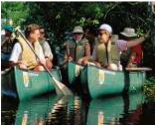
Chèo thuyền trong khu Bảo tồn Thiên Nhiên USFWS