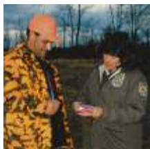
Thi hành pháp luật USFWS