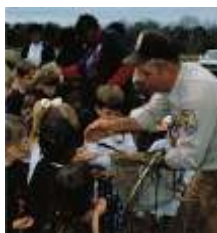
Giáo dục Môi Sinh