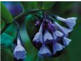
Hoa Chuông Xanh USFWS Ảnh chụp bởi: Jim Clark