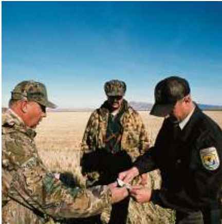
Kiểm tra Giấy Phép Đi Săn USFWS

Những nhân viên của nhóm này có nhiệm vụ thi hành các luật lệ về thiên nhiên cũng như các hiệp ước mà Cơ Quan đã ký kết. Họ điều tra từ những vụ nhỏ như vi phạm luật cấm săn bắn chim thiên di đến những vụ lớn như tổ chức săn bắn trái phép, và chuyên chở bất hợp pháp các loại thú bị cấm. Với sự hợp tác của các nhân viên thuộc Sở Quan Thuế và Bộ Nông Nghiệp, các nhân viên của Cơ Quan theo dõi những dịch vụ buôn bán sinh vật hoang dã và ngăn chặn những chuyến hàng lậu chuyên chở các động và thực vật bị cấm. Cơ Quan cũng điều hành một phòng khám nghiệm tối tân nhất thế giới. Tại đây, các nhà chuyên gia của Cơ Quan phân tích tang chứng để giúp các nhân viên điều tra giải được mọi tội phạm liên quan đến thiên nhiên.