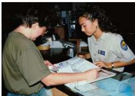
Thiện nguyện viên cho Khu Bảo Tồn USFWS

Mỗi năm hàng ngàn công dân Hoa Kỳ tình nguyện làm việc với Cơ Quan. Những tình nguyện viên này làm việc sát cánh với nhân viên của Cơ Quan dưới nhiều hình thức như làm hướng dẫn viên cho các cuộc thăm viếng và giảng dạy viên, hoặc trợ giúp các hoạt động khác như giúp băng bó vết thương của các loài chim, tu bổ nơi sinh sống của sinh vật, kiểm soát dân số của sinh vật hoang dã, xây dựng lại các lối đi và làm việc tại các trung tâm dành cho du khách. Nhiều công dân Hoa Kỳ cũng gia nhập những nhóm “Băng Hữu” để làm việc cho các khu bảo tồn thiên nhiên thuộc địa phương của họ. Ngoài ra công dân Hoa Kỳ cũng có thể đóng góp ý kiến về các hoạt động chính của Cơ Quan hoặc các đề án liên quan đến việc cai quản các cơ sở của Cơ Quan. Muốn biết thêm chi tiết, xin vào mạng lưới của Cơ Quan hoặc liên lạc với văn phòng gần nhất nơi bạn đang cư ngụ.