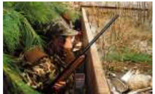
Săn các loài Chim Nước USFWS