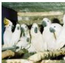
Két bị tịch thu