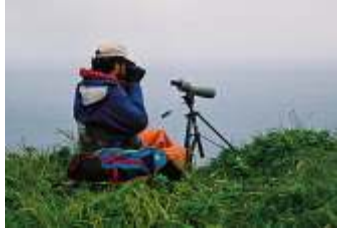
Quan sát thiên nhiên USFWS