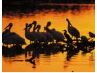
Bồ Nông dưới ánh hoàng hôn