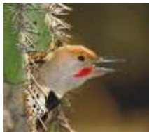
Chim Northern Flicker USFWS