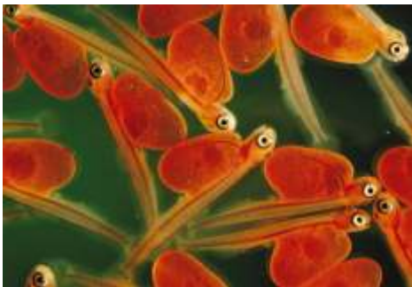
Cá Hồi sơ sinh

Một trong những nhiệm vụ quan trọng nhất của Cơ Quan Ngư Sản và Sinh Vật Hoang Dã Hoa Kỳ là bảo tồn dân số của cá và các loại ngư sản khác; đồng thời bảo vệ và phục hồi các nơi chúng cần để sinh sống. Các nhà sinh vật học chuyên về ngư sản của Cơ Quan làm việc tại các văn phòng nằm rải rác trên nước Mỹ như Văn Phòng Phụ Giúp Việc Điều Hành Ngư Sản và Sinh Vật Hoang Dã, Trại Cấy Trứng Cá Quốc Gia, Trung Tâm Chuyên Môn về Ngư Sản, và Trung Tâm Y Tế Ngư Sản là những người có nhiều kinh nghiệm về vấn đề bảo tồn tài nguyên của ngư sản. Với những cố gắng không ngừng, Cơ Quan Ngư Sản và Sinh Vật Hoang Dã Hoa Kỳ đã đóng góp rất nhiều vào việc bảo vệ một nền ngư nghiệp trị giá hàng tỉ Mỹ kim, ngăn chặn sự diệt chủng của nhiều loài thủy sản, và nhất là đem lại cho những người đi câu một nguồn giải trí lành mạnh.