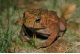
Cóc Mỹ Châu USFWS Ảnh chụp bởi: Karen Hollingsworth

Cơ Quan Bảo Tồn Ngư Sản và Sinh Vật Hoang Dã Hoa Kỳ có nhiệm vụ bảo vệ một môi sinh trong lành cho con người, cá, và sinh vật trong thiên nhiên, đồng thời giúp người dân biết giữ gìn và hưởng thụ thiên nhiên.