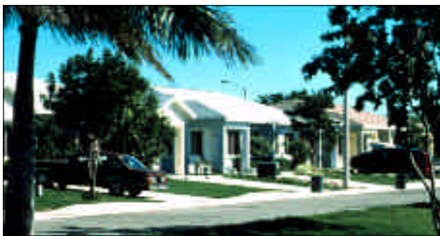
Ejemplo de una vivienda moderna para campesinos construida con ayuda de la Oficina de Desarrollo Rural del USDA

Las condiciones de las viviendas de los campesinos son muy inferiores en comparación con aquellas de otros estadounidenses. En algunos casos, viven en casas que son un poco mejor que cabañas. Para los trabajadores migratorios, el panorama es particularmente desalentador.