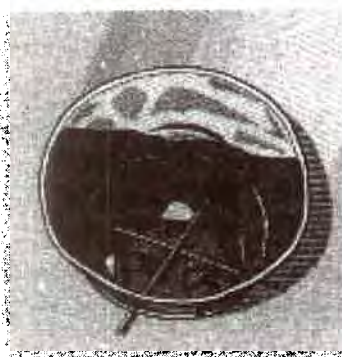
Fig. 56. Coloque as varas atravessadas no tambor

Cortar os furos para as varas: Mesmo acima das aberturas de meia-lua (a volta 1/3 da altura do tambor), corte um furo com o mesmo diâmetro das varas de metal. Directamente cruzado do buraco, do outro lado do tambor corte um segundo furo de modo que a vara possa se inserir dentro dos dois furos. Repita os passos e faça mais dois furos nos lados opostos do tambor. Insira cada vara para dentro dos furos para fazer um X ou cruzar