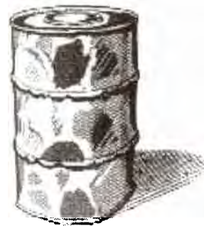
Fig. 55. Um tambor de 220 litros