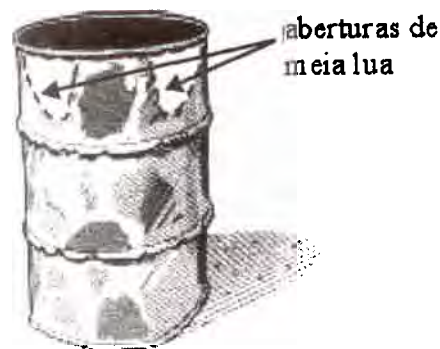
Fig. 55. Vire o tambor e ponha a parte do fim aberta sobre o chão

Cortar os furos para as varas: Mesmo acima das aberturas de meia-lua (a volta 1/3 da altura do tambor), corte um furo com o mesmo diâmetro das varas de metal. Directamente cruzado do buraco, do outro lado do tambor corte um segundo furo de modo que a vara possa se inserir dentro dos dois furos. Repita os passos e faça mais dois furos nos lados opostos do tambor. Insira cada vara para dentro dos furos para fazer um X ou cruzar