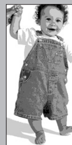
MANUEL 11 MESES DE EDAD DA SUS PRIMEROS PASOS

Si vive o cuida de personas como éstas, usted también debe vacunarse. Al protegerse, usted ayuda a proteger a su familia y amigos.