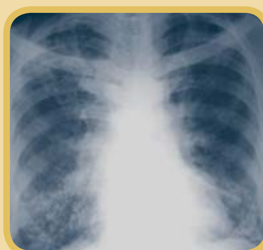
Pulmón con infección