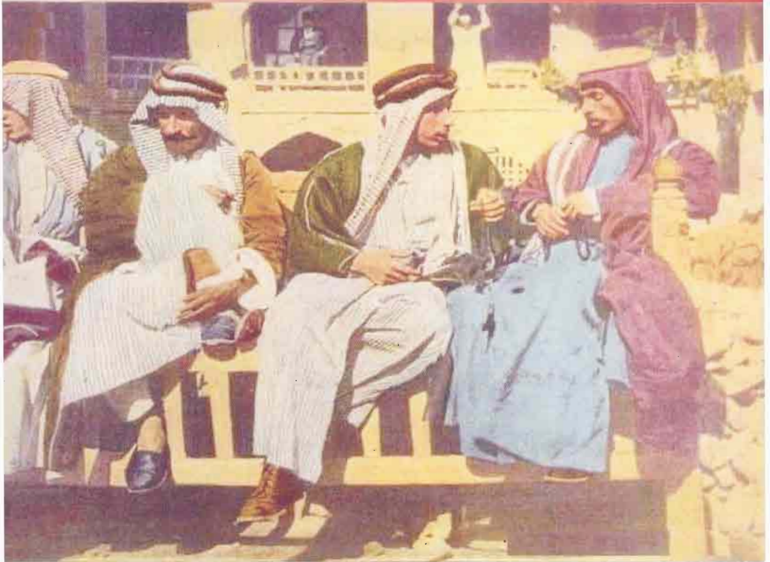
COFFEE LIFE IN BAGHDAD 1922