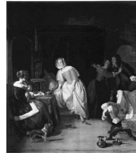
Gabriel Metsu Holandés, 1629–1667

De Hooch crea un ambiente sereno y acogedor para describir la tranquilidad del hogar, enfatizando las líneas de los ladrillos del pavimento, de las contraventanas y de la cerca de madera. Sobre el muro del jardín se puede vislumbrar la torre de la nueva iglesia de Delft. El Dormitorio , otra pintura de De Hooch en esta sala, representa una madre cambiando las sábanas de la cama mientras que su hija parece pedir permiso para salir al patio a jugar. Esta ordenada sala de recibo, alicatada con azulejos de vidrio blancos y azules, recuerda que Delft fue uno de los centros de cerámica más importantes. Merece también señalarse que incluso este modesto hogar muestra orgulloso sus tres pinturas y espejos enmarcados.