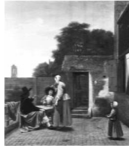
Pieter de Hooch Holandés, 1629–1684