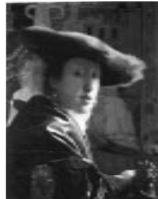
Johannes Vermeer La muchacha con sombrero rojo hacia 1665 Colección de Andrew W. Mellon 1937.1.53

La luz en Joven con flauta es algo uniforme y la mano derecha de la mujer y el codo izquierdo están torpemente cortados en los bordes del lienzo. Si no es del mismo Vermeer, esta segunda pintura fue creada por alguien íntimamente familiarizado con su trabajo, posiblemente un aprendiz, quizá incluso uno de sus muchos hijos.