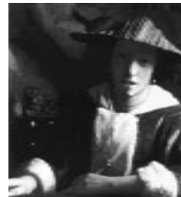
Atribuido a Johannes Vermeer Joven con flauta , Hacia 1665 Colección Widener 1942.9.98