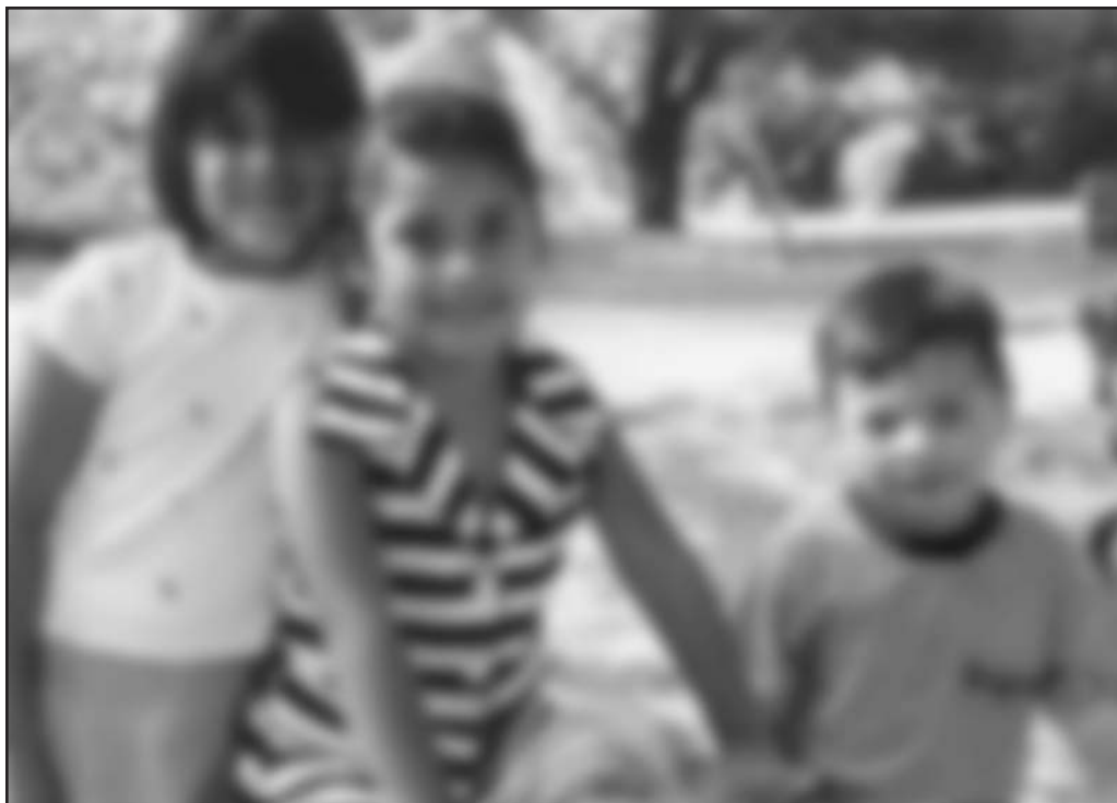
La misma imagen vista por una persona con cataratas