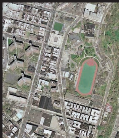
热效应：美国国家航空航天局（NASA）Landsat卫星于2002年8月14日拍摄的照片（左图），显示了曼哈顿上城的地面温度（红色表示高温，蓝色表示低温）。一个大型人工草坪体育场所产生的高温与一个大的黑色屋顶所产生的温度相似（见右图，Google Earth照片）。凉爽的温度点通常对应于城市植被，例如公园、街道树木和水体。

Croft补充到：“尽管我们非常需要开放式空间，但如今的问题不是开放式空间，而是主动式的娱乐设施。在我看来，开放式区域和安装人造草坪的运动场之间没有任何关联。”