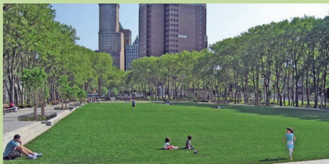
引入延缓期：纽约布鲁克林的Cadman广场，因铺设了一层像图画般完美人造草坪地毯而自夸。2007年秋季，纽约州议会提议对出售和安装含有橡胶颗粒的人造草坪设立一个延缓期，直到纽约州完成对人造草坪潜在健康影响的综合评估。

合理保养人造草坪需要清洁运动场以去除人的体液和动物粪便，许多制造商因此向市场上推出了清洁产品。美国运动场制造商协会在其2006年出版的《人造草坪运动场：建设和维护指南》（ Synthetic Turf Sports Fields: A Construction and Maintenance Manual ）中指出，一些人造草坪运动场的拥有者应该每月对运动场消毒两次，对于污染物集中的边线区域，清洁次数应该更为频繁。