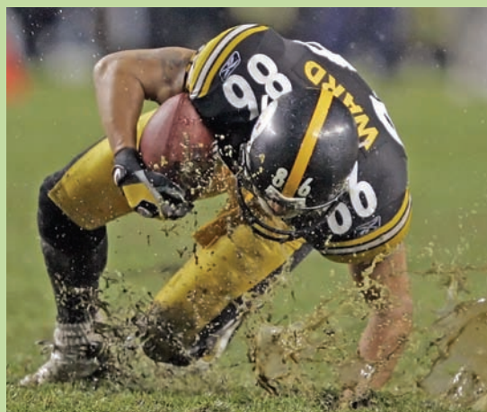
成本和效益的权衡：碰撞性较强的运动会毁坏天然草坪（上图），但对橡胶颗粒填充物（见下图冲撞时喷溅的填充物）的未知健康影响和其他环境健康问题的担心，让一些买家不完全放心人造草坪所带用的好处。

一些研究显示，这些化学物在轮胎燃烧时会被大量释放，也可以在橡胶颗粒老化的过程中被缓慢释放出来。例如，在国际运动表面材料科学协会2006年会上，挪威公共卫生研究所的研究者们汇报了其对于室内体育场草坪来源的化学物的研究。这篇名为“人造草坪树脂：足球运动员健