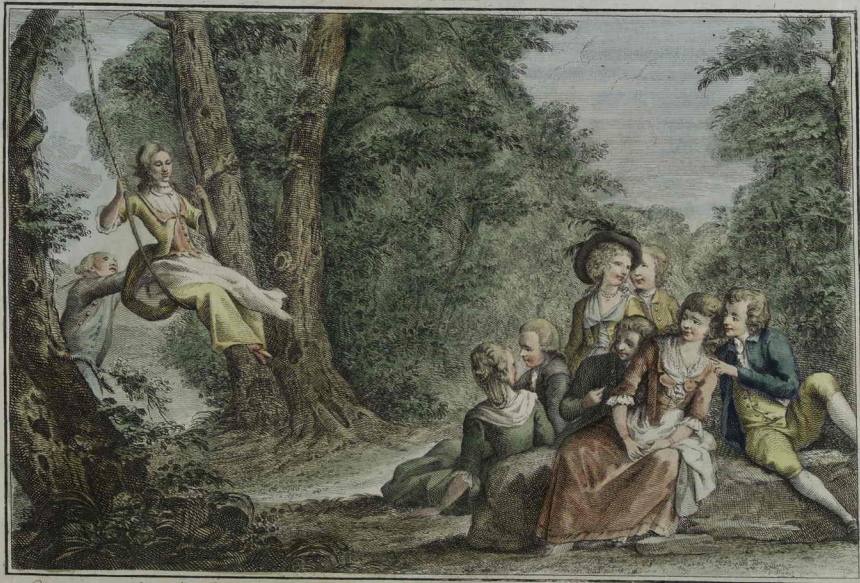
4. Gioca vaga donzella all'altalena, L'ALTALENA E tosto in tanto ai cuor dolce catena