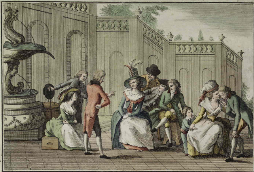
Copre il riso talor labbro Sincero LA BERLINA. che vuol ridendo motteggiar sul vero.