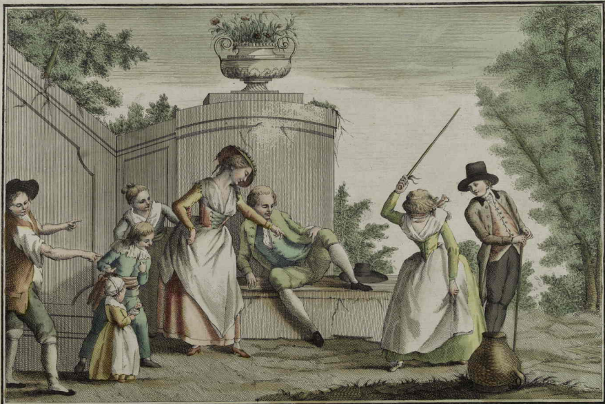
5. Se il guardo offesa un anverso foco LA PENTOLACCIA giannai del vero si discopre il loco.