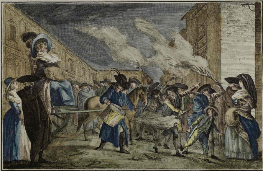
So in sua Stagion quest'è Befana vera, LE BEFANE Quanto feco ne avrà L'annatà intiera.