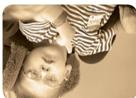
Si la ictericia no se detecta y se atiende de manera adecuada puede causar daño cerebral prevenirlas.

Para obtener más información: visite www.cdc.gov/ncbddd/Spanish/spkerniterus.htm (en español) www.cdc.gov/jaundice (en inglés)