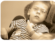
Si la ictericia no se detecta y se atiende de manera adecuada, puede causar daño cerebral (kernicterus). Pero el kernicterus puede prevenirse.

Para obtener más información: visite www.cdc.gov/ncbddd/Spanish/spkerniterus.htm (en español) www.cdc.gov/jaundice (en inglés)