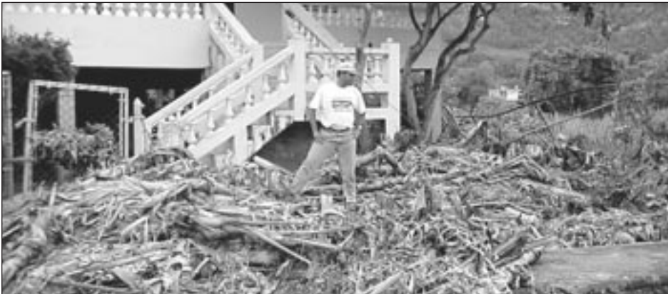
Escombros dejados por las corrientes de aguas de inundación frente a una casa en Guayanilla.

Publicado por la Agencia Federal para el Manejo de Emergencias y la Agencia Estatal para el Manejo de Emergencias PUERTO RICO / 19 DE JUNIO DE 2001 / FEMA VOLUMEN 1