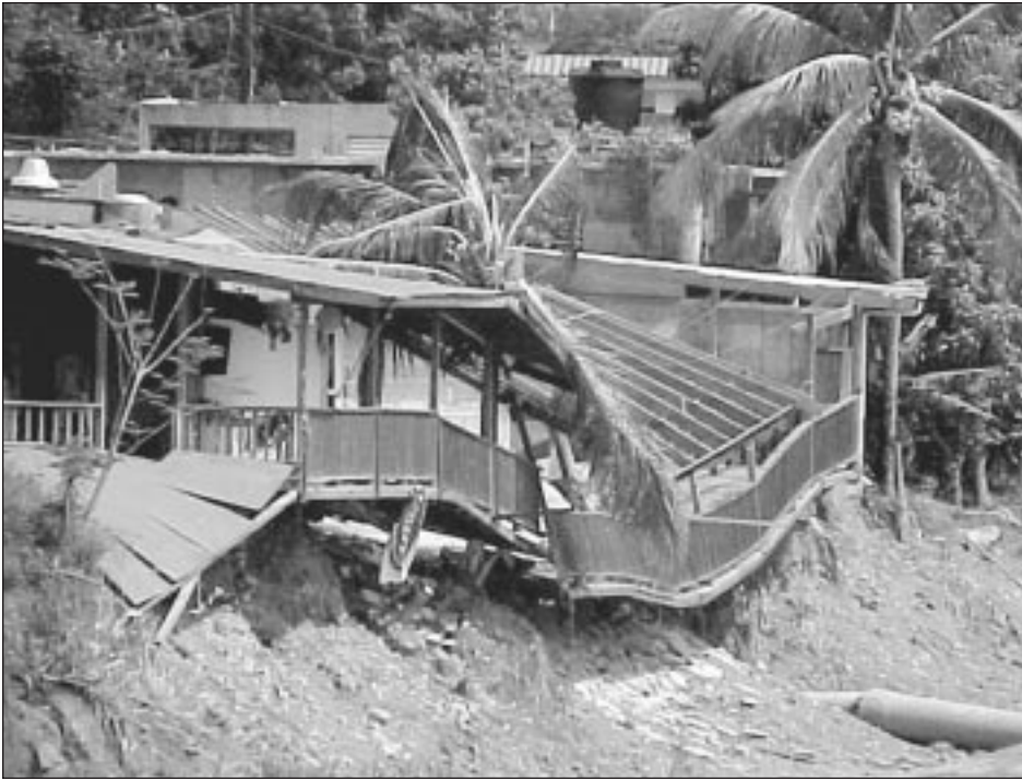
Estructura afectada por deslizamiento de tierra en el área oeste de la isla.