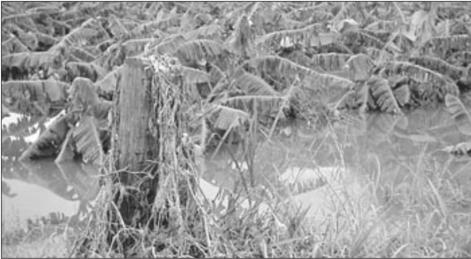
La agricultura del área oeste sufrió grandes pérdidas debido a las fuertes lluvias de mayo.