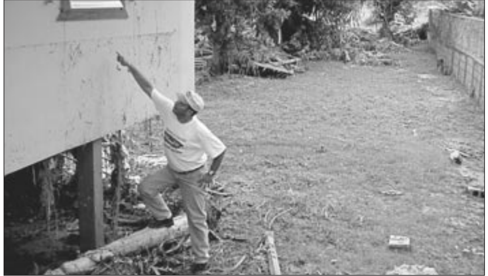
Empleado de FEMA muestra el nivel que alcanzaron las aguas de inundación en algunas partes.

Hay representantes de SBA en tres Centros de Recuperación por Desastre de Yauco, Guayanilla y San Germán y en los tres centros rodantes de Lajas,