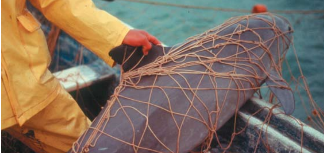
A vaquita drowned by entanglement The vaquita is vulnerable to entanglement in nets with a large range of mesh sizes

The four most frequently mentioned risk factors are summarized in the subsections below.