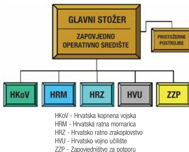
Slika 3. Glavna zapovjedna struktura OS RH

Glavni stožer je združeno tijelo Oružanih snaga ustrojeno u sklopu Ministarstva obrane, nadležno za zapovijedanje, pripremu i uporabu Oružanih snaga, u skladu sa zapovijedima vrhovnog zapovjednika i aktima ministra obrane. Nadležan je za uporabu OS RH i obavlja stručne poslove za potrebe vrhovnog zapovjednika i ministra obrane.