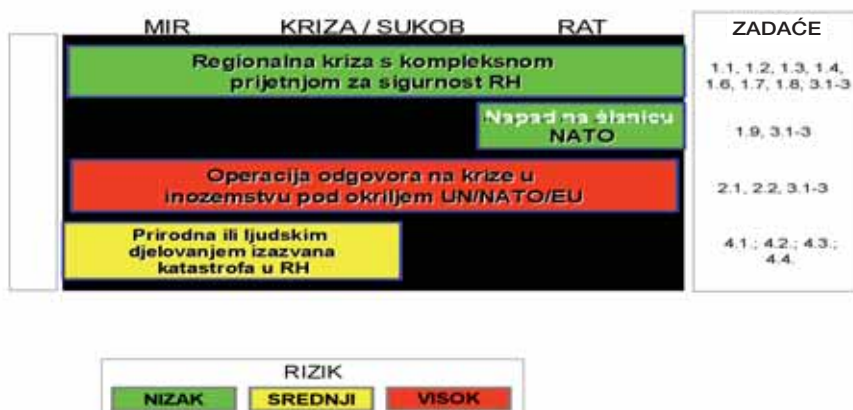
Slika 2: Scenariji - misije i zadaće - rizici