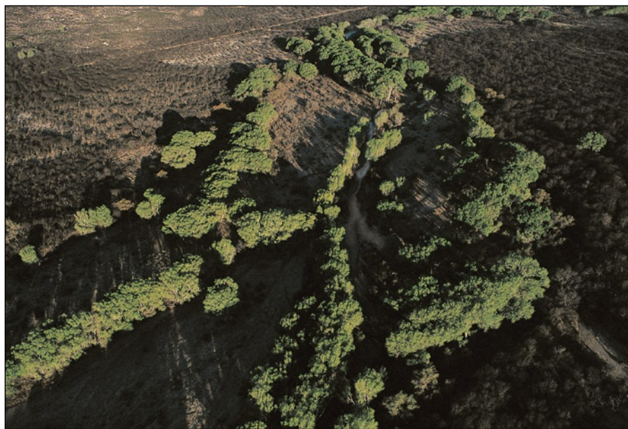
La rivière San Pedro.