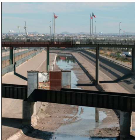
Vue du fleuve Rio Grande, qui borde les États-Unis et le Mexique, à partir d'un pont de passage international de la ville frontalière Ciudad Juárez, Mexique.

Parce que l'eau est essentielle à la survie de tous les organismes vivants, bon nombre de pays considèrent qu'un accès adéquat à l'eau constitue un droit fondamental de l'être humain. On a retrouvé la trace de conflits portant sur les droits d'accès à l'eau jusqu'en 2 500 avant Jésus-Christ, et l'on s'attend à ce que de tels conflits surviennent plus fréquemment à l'avenir, à mesure que les populations augmenteront, que le développement économique se poursuivra et que les modèles climatiques changeront.