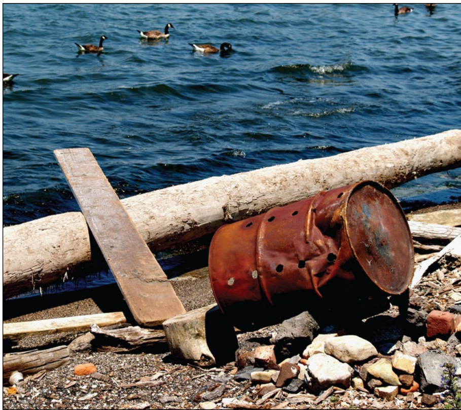
Rivage du lac Érié.

Malheureusement, au cours de la dernière décennie, les concentrations de phosphore dans le lac Érié ont augmenté de nouveau. La charge des tributaires en phosphore dissous est en augmentation. L'hypoxie et l'anoxie observées dans le bassin central sont plus importantes et se produisent pendant une plus longue période. La prolifération des cyanobactéries dangereuses Microcystis et la multiplication du Cladophora , algue verte filamenteuse adhérente, s'approchent des niveaux observés dans les années 1970. En conséquence, la gestion des nutriments, en particulier du phosphore, demeure la priorité absolue pour ce qui est de l'amélioration du lac, et les États-Unis et le Canada sont en train d'élaborer une nouvelle stratégie binationale de gestion des nutriments pour le lac. Même si les stocks de perchaude sont en train de se reconstituer dans l'ensemble du lac, la situation des principales espèces prédatrices (doré jaune, truite grise et grand corégone) demeure préoccupante.