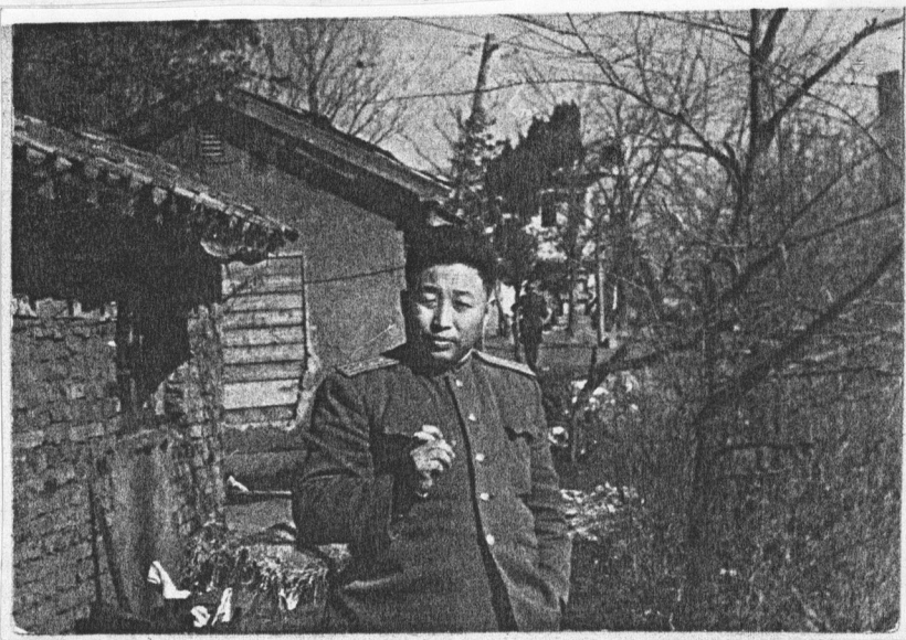
사진은 조선생이 1951년 말부터 조선어민군 총방식령부 특별 군정 대대로 개설이 되어진 평양시 한구역에서 촬영 한 것이다.

1945년 4월 중순에 끝으로 기다리지 않은 군사령령을 다 뉴겐스군 군사령령으로 부하 받았다. 이것이 한인 제 일차 군 대 소로 몇천만 여들은 소련군과 함께 군대 총역원으로 처음으로 북한 땅을 드리게 된 한인 소련군대가였다. 조선생은 소련군 25군단 산하 부대, 연남부대 성원들과 함께 9월에 평양 에 입성한후 25군단 정치부에서 북한 언변들을 위하여 평양 신문사 한개를 개조하여 "조선신문"이라고 명명하고 발간하기 시 작한 신문사의 문장 고정원으로 1945년 9월부터 1950년 8월