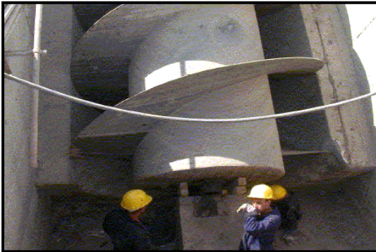
تم إصلاح لولب ارخميدس الذي يستعمل في رفع المياه الى بداية عملية المعالجة.