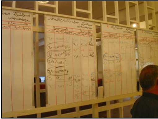
لوحات التجارة في بورصة تبديل العملة في العراق.