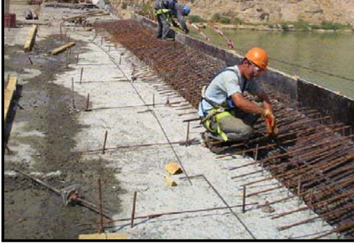
العمل في دعامات وقضبان جسر تكرير.