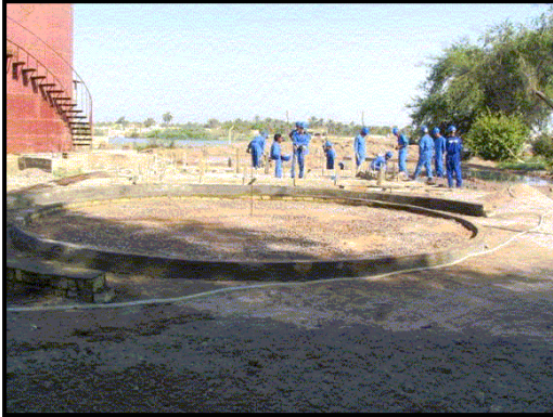
الاساس لوحدة معالجة المياه في مشروع الطاقة الكهربائية الحراري في جنوب العراق.

ميناء ام قصر - - تتضمن مشاريع الوكالة الامريكية للتنمية الدولية USAID في تنظيم ادارة الميناء وتعيين ملاحين لأرشاد السفن وتنسيق النقل في الميناء وتسهيل خدمات الشحن مثل المخازن ومركبات نقل الشحنات والخزن .