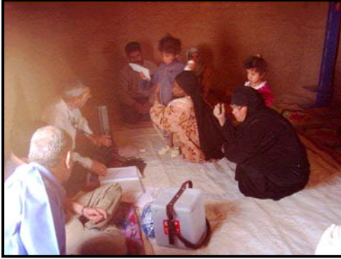
عملية الفحص الطبي للاشخاص المرحلين في محافظة ديالى. IDPs داخليا