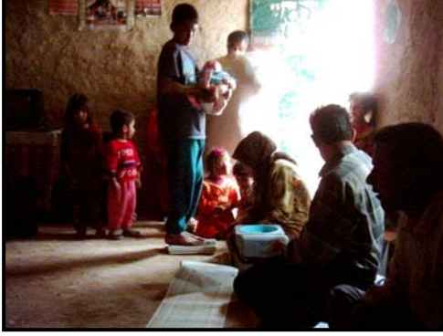
وزن الاطفال خلال عملية الفحص الطبي للاطفال.