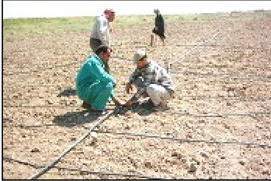
عملية تنصيب أدوات الري بالتقطير في محافظة القادسية.