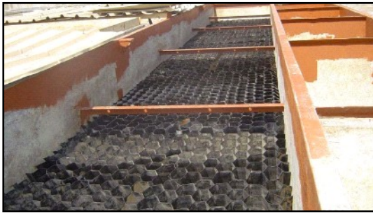
خزان بعد عملية اعادة التأهيل في احد المناطق في البصرة لمشروع معالجة المياه.

الماء وتعزيز الصحة العامة- - تتضمن مشاريع الوكالة الامريكية للتنمية الدولية USAID في مجال الماء وتعزيز الصحة العامة في العراق اعادة تأهيل و اصلاح البنى التحتية الاساسية للماء وذلك لتوفير الماء الصالح للشرب ولتعزيز الصحة العامة في المجتمع ولتطوير الري .