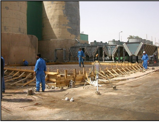
عمال يقومون بوضع الاساس للمبادل الحراري الجديد.

• قام كادر البنى التحتية خلال شهر تشرين الاول 2003 بتسهيل عملية اعادة تأهيل الشبكة الوطنية للطاقة الكهربائية لأنتاج قدرة كهربائية اكبر من مستويات ما قبل الحرب والتي تبلغ 4,400 ميغاواط ،وفي حزيران بعد اشهر من انخفاض انتاج الطاقة الكهربائية في الوحدات لأغراض الصيانة بدأ الانتاج يزداد بشكل مستقر وقد وصل الى 5,000 ميغاواط في شهر تموز 2004 ، ويتجاوز الانتاج اليومي حالياً بشكل منتظم 110,000 ميغاواط من الساعات.