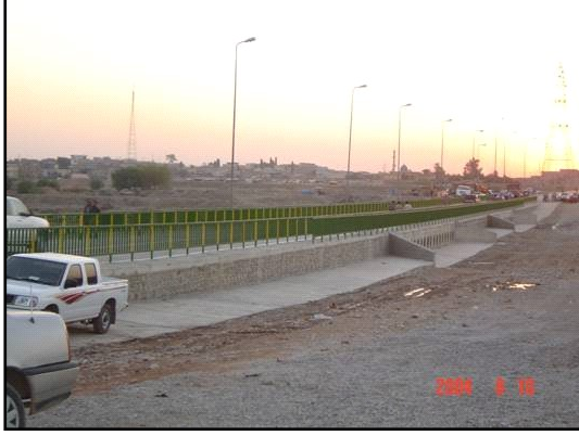
الجسر بعد اعادة الاعمار.

● سيتم ترميم العيادات الصحية لقرينتين في وسط العراق ضمن منحة من برنامج مبادرة الانتقال في العراق ITI. وتقع هذه العيادات في المناطق الريفية وقد تدهورت بعد سنوات عديدة من الاهمال ، وستقوم المنحة بأعادة تأهيل هياكل البناء وتوفير الاثاث والتجهيزات الاساسية بينما ستوفر المجاميع المساهمة الأخرى الادوات والمعدات الطبية. وستعمل هذه الفعاليات على تحسين معايير الرعاية الصحية الموجودة لمواطني هذه المناطق ، وستساعد في تقليل التوتر في المنطقة وأعادة الثقة بالحكومة حول امكانياتها في تلبية احتياجات المواطنين .