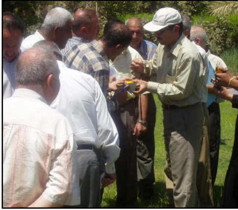
موظفون من هيئة الولايات المتحدة في اراضي تجارب نظام تحديد المواقع العالمي GPS.