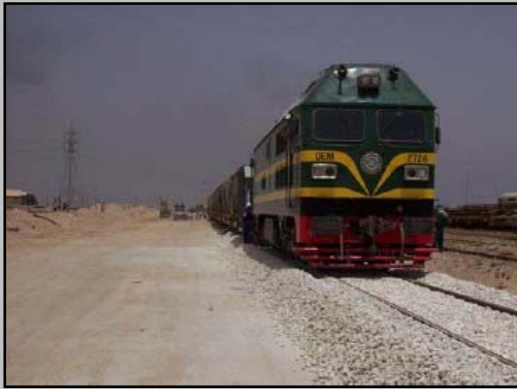
اعادة اعمار طريق سكك الحديد للقطارات بدعم من الوكالة الامريكية للتنمية الدولية

تساعد الوكالة الامريكية للتنمية الدولية USAID الشعب العراقي في إعادة اعمار وطنهم عن طريق العمل مع الحكومة العراقية المؤقتة ، ويتم تنفيذ برامج الوكالة الامريكية للتنمية الدولية بالتنسيق مع الامم المتحدة UN ودول التحالف المشتركة والمنظمات غير الحكومية (NGOs) وشركاء القطاع الخاص . ومهمة الوكالة الامريكية للتنمية الدولية USAID في العراق تتضمن توليها برامج في مجال التعليم والرعاية الصحية والأمن الغذائي وإعادة اعمار البنى التحتية وأدارة المطارات وانعاش الاقتصاد و مبادرات تطوير المجتمع و الديمقراطية والتنسيق بين المؤسسات الحكومية ومبادرات الانتقال .