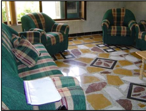
مركز ثقافي تم تأثيثه مؤخراً في شمال العراق.