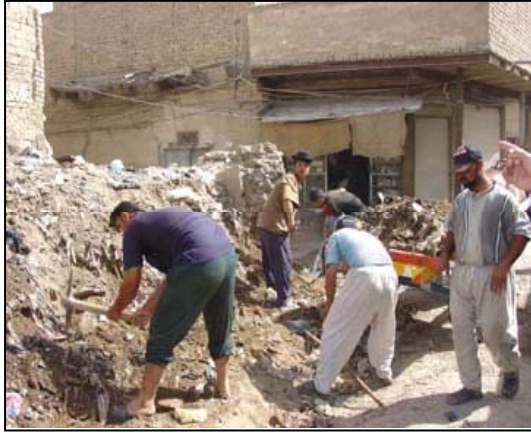
عمال واعضاء من المجتمع يقومون بأزالة الانقاض الصلبة من قطعة فارغة في محافظة بابل.