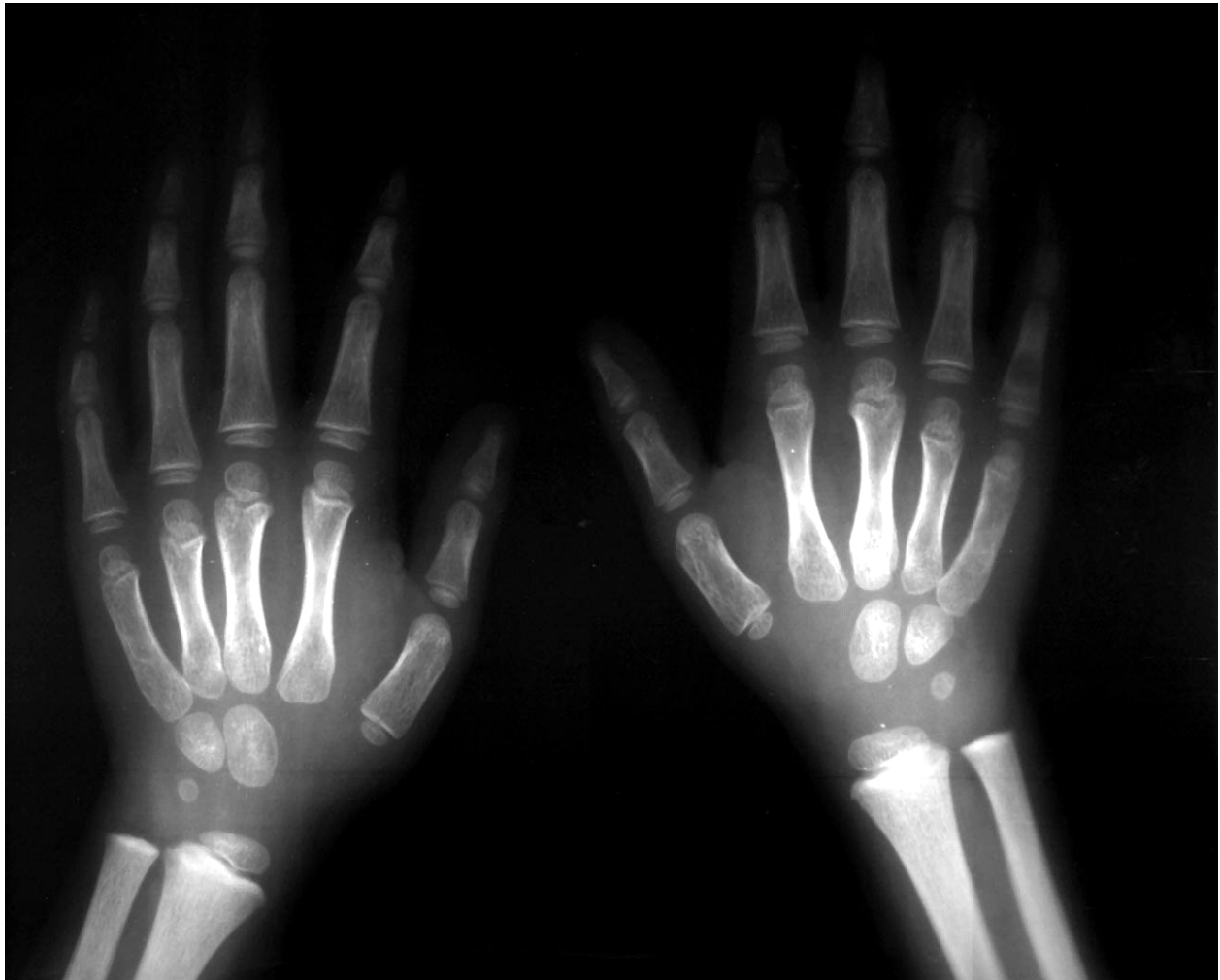
Figura 2. Radiografías de huesos largos en las manos

"Líneas de plomo" presentes en un niño de 5 años con retraso en el crecimiento radiológico y con un nivel de plomo de 37.7 \mu\text{g}/\text{dL} . (Fotografía cortesía de la Dra. Celsa López, Unidad de Investigación en Epidemiología Clínica, IMSS, Torreón, México).