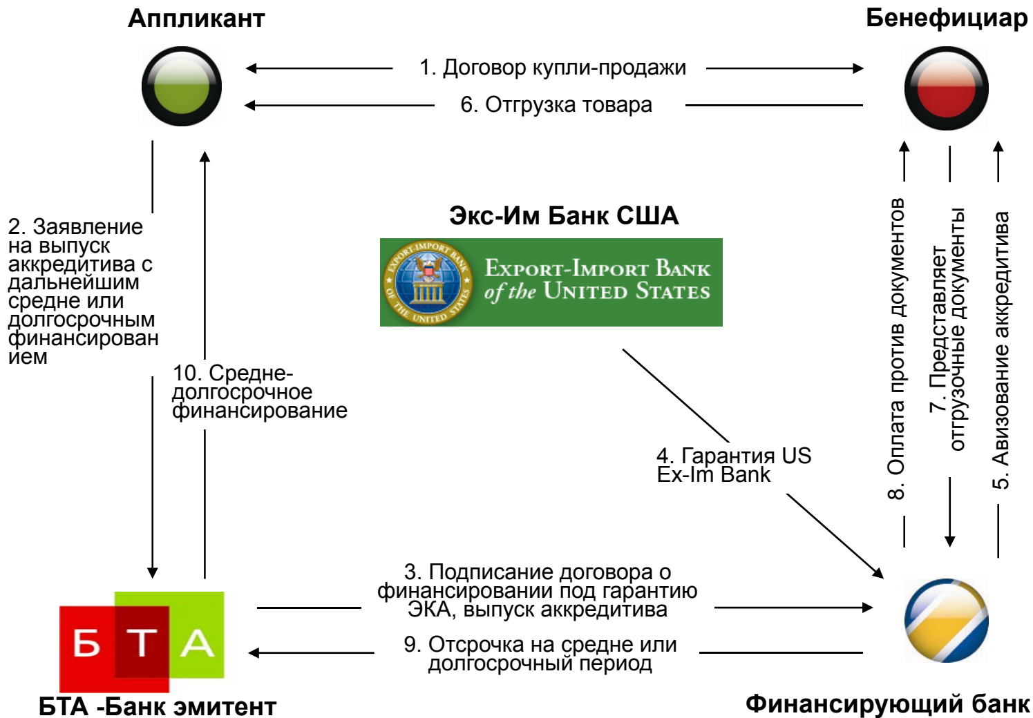
Схема финансирования под гарантию US Ex-Im Bank