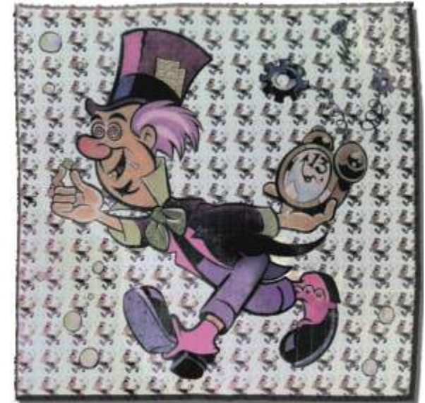
Papel secante con LSD.