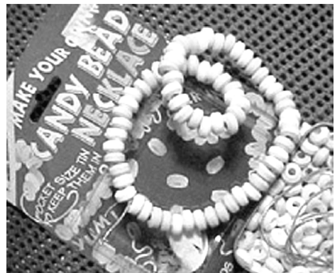
Pendientes hechos de caramelos en forma de pastilla se sirven para esconder MDMA.

Muchos jóvenes reventoneros usan ropa llamativa y portan accesorios que suelen asociarse con el consumo de drogas de club y la cultura del reventón. Esos jóvenes se visten para estar cómodos. Por lo general llevan prendas de vestir ligeras y sueltas. También se visten por capas para poder ir quitándose la ropa poco a poco según se van acalorando por las horas de baile. Muchos chicos usan calzones cortos sueltos o pantalones largos muy amplios y de pierna ancha. La mayoría de las chicas llevan camisetas, sostenes de bikini, corpiños cortos, tops elastizados, y blusas cortas sin espalda para mantenerse frescas. Luego de horas y horas de baile y con el consumo de MDMA—que eleva la temperatura corporal—muchos reventoneros terminan despojándose de la mayor parte de la ropa. Algunos aficionados a los reventones, sobre todo las mujeres,