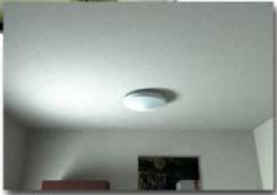
ក្រោយពេលសំណាម