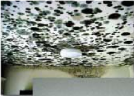
មុនពេលសំណាម