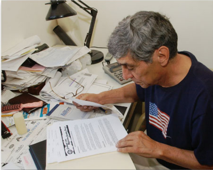
这位政治活动人士在为动员科罗拉多州拉美裔选民登记投票筹款。

最近的选举民调揭示了即将参加 2008 年总统大选投票的美国公民所关注的问题、他们的各种信念和情绪。选民对恐怖主义威胁深感担忧，对国内问题感到悲观，并希望政府改革。民主党民意调查人丹尼尔·戈托夫(Daniel Gotoff)得出的结论是：“对大变革往往保持沉默的美国选民，如今却对维持现状感到紧张不安。”戈托夫是位于首都华盛顿的莱克研究所(Lake Research Partners)的合伙人。