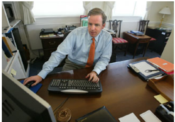
2003 年，时任白宫联络办公室主任的巴特利特(Dan Bartlett)在参与白宫与美国公民的一次直接网谈。

总之，尽管 2008 年的竞选活动尚在继续，但有一点已确凿无疑：互联网已永远地改变了候选人与美国选民之间的交流方式。其结果不仅限于能够使名列前茅的一、两名候选人在筹款上获得成功，而且也使候选人再也无法完全控制信息的发布与传播。公众已通过 Web 2.0 工具来表达他们的呼声；接下来要看候选人能够多么仔细地倾听。