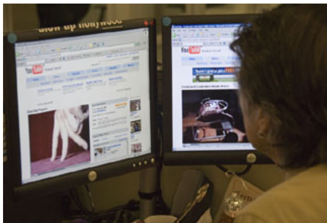
互联网上视频共享服务网站 YouTube 正在美国政治舞台上发挥作用。

2004 年霍华德·迪安(Howard Dean)的总统竞选班子是最著名的早期在线基层——亦称“网路基层”——社群体力量之一。曾被媒体和政治评论家视为三线候选人的迪安，通过使用博客、大规模电子邮件竞选活动以及在线社群讨论，从网上聚集起巨大的支持声势。不久，迪安得到来自全国成千上万人的支持，包括捐款。随着他在互联网上的形像越来越突出，主流媒体的报纸、电台和电视台注意到他在筹款方面获得的成功以及从网上获得的广泛支持，也开始对他进行更多的报导。骤然间，他成了需要认真对付的一支政治力量。虽然他最终未能获得民主党提名，但他在互联网上成功运用的组织技术，给需要为其他目标而调动支持力量的自由活动人士奠定了网络基础设施。