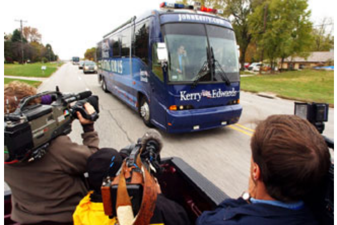
2004 年 10 月电视记者在拍摄一辆抵达艾奥瓦州达文波特的竞选轿车。

美国的总统竞选是一场有很多人参与的复杂微妙的互动，是一个令所有参与者精疲力尽的漫长过程，有些人会感到格外疲惫不堪。例如，在初选期间排名第三、第四或第五的候选人会在每天的日程中塞进更多活动，特别是在艾奥瓦（全国最早举行党内预选的州）和新罕布什尔（全国最早举行初选的州）这样的关键性小州；在这里，“零售政治”，即与选民进行面对面的接触，不仅十分关键，而且也是人们所期待的。