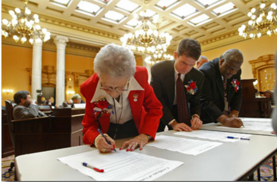
2004 年 12 月俄亥俄州选举团成员在哥伦布市州议会大厦举行的投票仪式上签名证票。