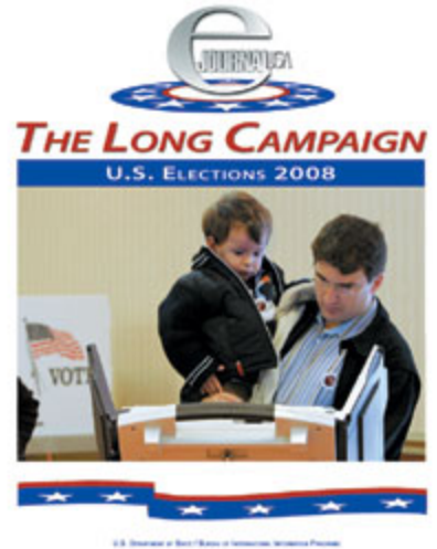
俄亥俄州一位父亲 2006 年抱着儿子在电子投票机上投票。