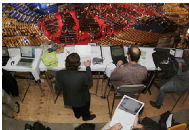
在民主党全国代表大会期间，在广播电视和报纸等主流媒体记者附近特别设立了一个博客作者工作台。2004 年“博客者大道”(Blogger's Boulevard)在马萨诸塞州波士顿第一次实况转播了这次全国性的政治会议。

在手机上拍摄到的对萨达姆·候赛因(Saddam Hussein)执行死刑的镜头。尽管伊拉克政府公布了一段记录执行死刑准备过程的官方录像，但成为全世界头版头条消息的却是现场一位旁观者拍摄的 UGC。