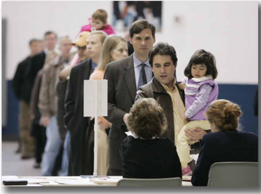
在 2006 年 11 月 7 日举行的中期选举中，弗吉尼亚州亚历山德拉市的选民在排队投票。

库克：在任总统及副总统均不参加总统选举，实属 80 年来第一次。选举机会对两党全面敞开，的确不