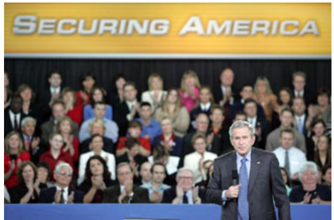
2006 年 2 月，布什总统在佛罗里达州坦帕港就全球反恐之战发表讲话。

美国人对经济问题的关心随时间而变化。获得稳定和报酬好的工作依然是人们的主要关切，但是，随着美国就业者发现他们越来越难跟上生活费用的上涨，得到合理医疗保险如今成了选民关切的首要经济问题。当被要求说出什么是个人最担心的经济问题时，多达 29%的选民提到不断上涨的医疗费用，这个数字高于担心税负上升的人(24%)、担心退休保障的人(16%)、担心失业的人(11%)、也超过对儿童保育和学费开支感到担心的人(10%)。将享有价格合理的医疗保健看作是“美国梦”支柱之一的美国人，如今把急剧上涨的医疗费用看作是对全家能否维持中产地位和实现美国梦的直接威胁。选民们还认为，医疗保健费用是对个人创业的一大障碍，这对一个有 48%的人想自己创业的社会而言是意味深长的。