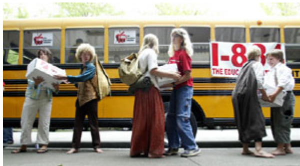
12 岁的学生把请愿箱装上校车。他们希望把为华盛顿州西雅图市增添教育经费的提案列为公民投票议题之一。

美国妇女在民意调查中表示，在 2004 年和 2006 年，促使她们决定投票以及投谁的票的因素，是非传统的“妇女议题”。在一个含 10 项议题的选择中，伊拉克局势是促使女性投票的首要问题(22%)，其次是反恐之战(15%)。伦理/家庭价值观和就业/经济问题各占 11%。对其余六个关注问题的选择只占一位数字(见表 2)。