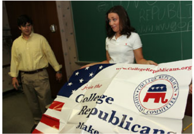
位于摩根顿城的西弗吉尼亚大学学生在展示“大学共和党”海报。

贾甘纳坦还表示，新入籍的公民比本土出生的公民更珍视投票权。她说：“我想，当你生来就有这些权利，你可能不以为然。当你没有这些权利，而一旦得到，就显得非常珍贵。”