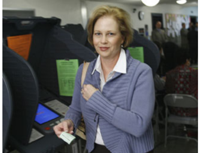
得克萨斯州第一夫人佩里(Anita Perry)2006年11月早上在奥斯汀特拉维斯县参加投票。

[ http://www.verifiedvoting.com/ ]。在实行依得票次序决定胜负的选举制度的爱尔兰，人力点票工作可能需要长达一个星期，然而，试图引入电子投票加快速度的尝试却以失败告终。