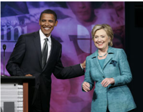
2007 年 9 月争取获得总统候选人提名的民主党参议员奥巴马和克林顿在佛罗里达州的科勒尔盖布斯参加民主党预选辩论会。

库克：与过去相比，接触全体选民变得越来越难。二、三十年以前只有三大电视网，通过它们基本能接触到所有人。如今出现了有线电视和卫星电视，电视频道多达几百个，还有其他许多媒