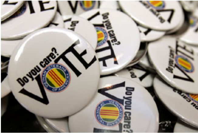
在田纳西州纳什维尔举行的“越战老兵组织领导会议”上展示的敦促老兵投票的徽章。

更重要的是，公众越来越感觉到，中产阶级不再能共享国家的繁荣，而且随着少数上层人士获取巨额利润，中产阶层的境况其实是在倒退。选举后的民意调查结果反映出，选民对 21 世纪实现美国梦的信心正在下降。有足足一半的选民说，他们的生活仅仅能过得去，另有 17% 的选民说，他们今不如昔。不到三分之一的选民(31%)说，他们的经济能力正在提高。更令人吃惊的是美国人对下一代的前景所表示的悲观。多达 40% 的美国人说，他们预期下一代美国人的生活不如今天，28% 的人说，同今天差不多，只有 30% 的人预期下一代美国人的生活会比今天好。在 2008 年的选举中，美国选民将会选择最可信赖的候选人，确保美国梦给人们的希望，即共享经济繁荣和劳工阶层能让自己的下一代得到更好机会。