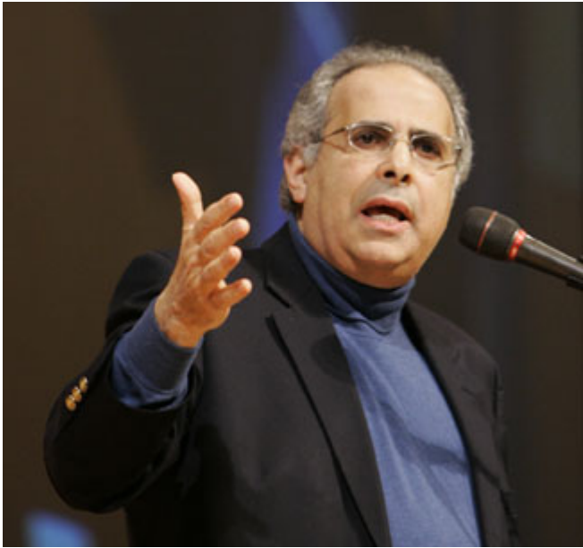
国际民调专家佐格比在俄克拉荷马州俄克拉荷马市讲话，说明拉美裔选民在 2008 年选举中具有更加重要的作用。

随着有线新闻网和其他新媒体的迅猛发展，公共民调也出现激增。到 2006 年，公共领域的独立民调至少有二十几种，而这个数字还在不断上升。因此，现在的一个重要问题是，各种新闻媒体和民意调查是否泛滥成灾。但到目前为止，美国人看来对更多的新闻选择和更多的民调表示欢迎。美国人希望有连属感，希望知道他们自己的看法是主流派还是少数派，以及他们支持的候选人在更广泛的选民中——即在除了他们身边的朋友和家人、美发师和理发员、便利店和街坊邻里以外的范围内——表现如何。