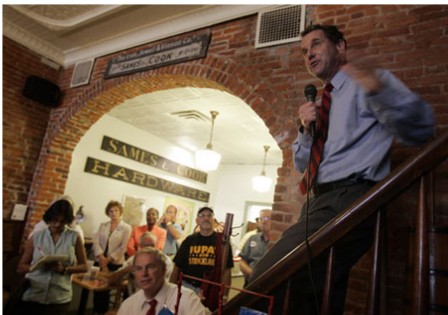
参议院候选人布朗 (Sharrod Brown) 2006 年 8 月在俄亥俄州芒特吉利阿德竞选期间，在一个咖啡店向选民发表讲话。