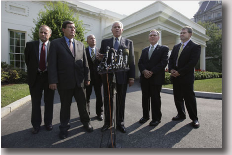
这些国会议员在 2006 年 7 月访问伊拉克归来后，与布什总统在白宫举行会晤，并随后向记者发表讲话。

对美国人民来说，选举国会议员与选举总统同样重要。本文介绍了美国国会的结构，在国会选举中起作用的各种因素，以及 2008 年选举对美国政府政策可能产生的影响。桑迪·梅塞尔(L. Sandy Maisel)是缅因州沃特维尔的科尔比大学(Colby College)政府学教授。