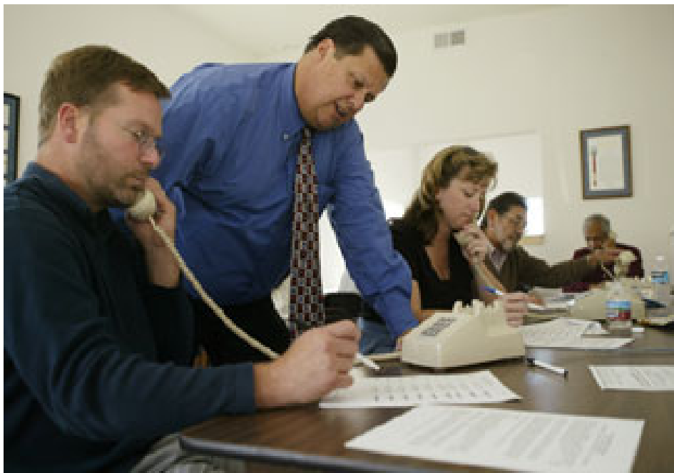
加利福尼亚第 53 国会选区候选人戈登 (Mike Gordon) 与竞选活动志愿人员讨论竞选战略。

联邦法律对个人或政治委员会捐款的数额有不同数额的限制。例如，个人给任何一位竞选人的捐款不得超过 2300 美元。这一限额是对每一次选举而言。因此，一个人可以在初选活动中为某一竞选人捐款最长达 2300 美元，而后在大选活动中再为这名候选人捐款最长达 2300 美元。夫妻被视为两个人，因此，两人在一次选举中可以最多捐 4600 美元。