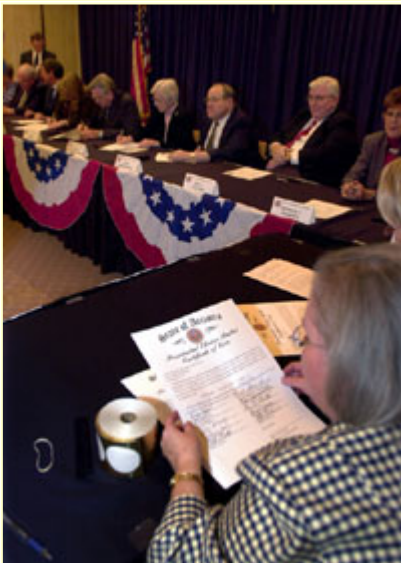
在亚历桑那州菲尼克斯市市府大厦正在举行的给州选举人选票加盖州政府印章的仪式。

不赞成这种制度的人士认为直接选举更简单明了。只要对全国选票进行统计，不必考虑各州的总票数，就能宣布谁是得胜者。但是，如果美国采纳这样的制度，候选人可能只重视在人口最多的几个州展开竞选活动，以便在那里赢得最多的选票，但忽视人口较少的其他一些州。