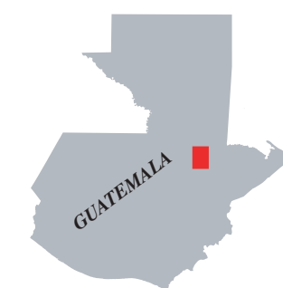
MAPA de LOCALIZACIÓN MAP LOCATION

Deslizamientos de tierra inducidos por la tormenta de Septiembre de 1999 Landslides triggered by September 1999 rainstorm